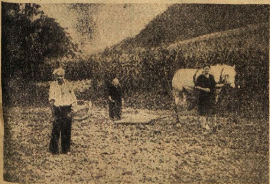
Vrtovškova partizanska družina dela in pripravlja za partizane leta 1942

Mestni odbor OF Trbovlje vabi vse članstvo in ostalo prebivalstvo mesta Trbovlje, da se v četrtek, 20. septembra t. l. ob 17. uri udeleži