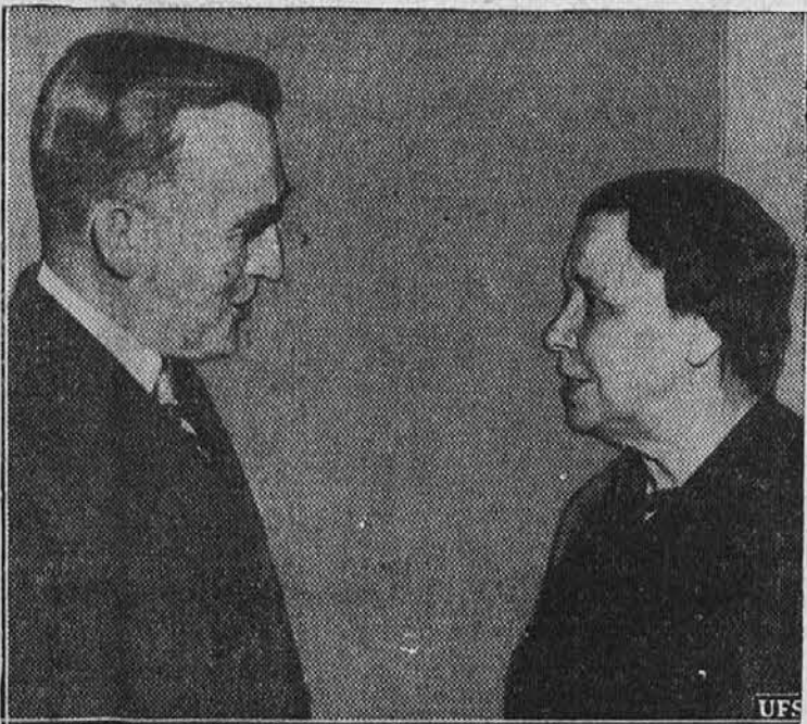
Hatlie W. Caraway, edina ženska senatorica Zed. držav. Izvoljena je bila iz države Arkansas. Najprej je bila imenovana v ta urad na izpraznjeno mesto svojega umrlega moža, potem je bila pa pri volitvah izvoljena od naroda.