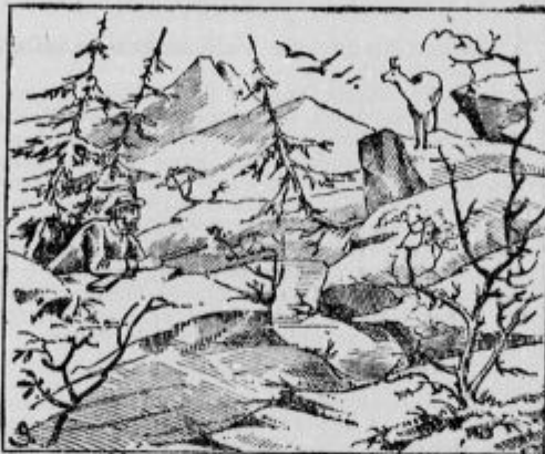
Kje je Repoštev?