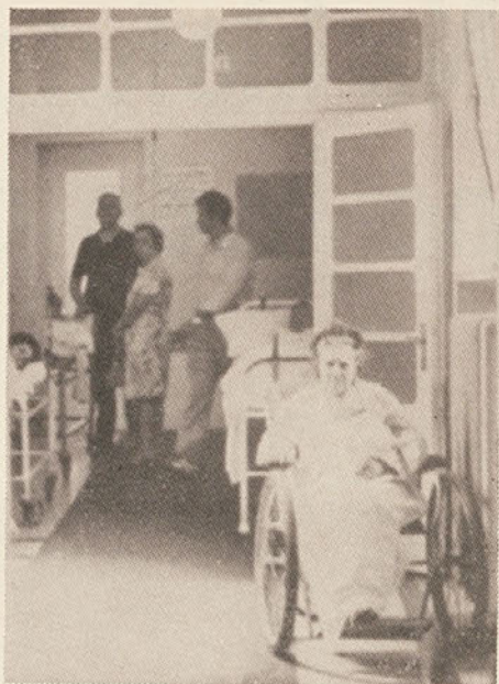
Splošna bolnišnica v Trstu, ki je bila zgrajena leta 1841, je bila predvidena za 700 bolnikov, danes pa je v njej okrog 2109 bolnikov. Gradnja nove bolnišnice na Katinari zelo počasi napreduje. Sicer pa je v Trstu vsestransko neurejena zdravniška služba. Skrajni čas je, da se napravi red tudi na tem področju. Volitve lahko pospešijo korake, ki vodijo k temu cilju!

«Errare humanum est, perseverare diabolicum», pravijo. Zakaj se