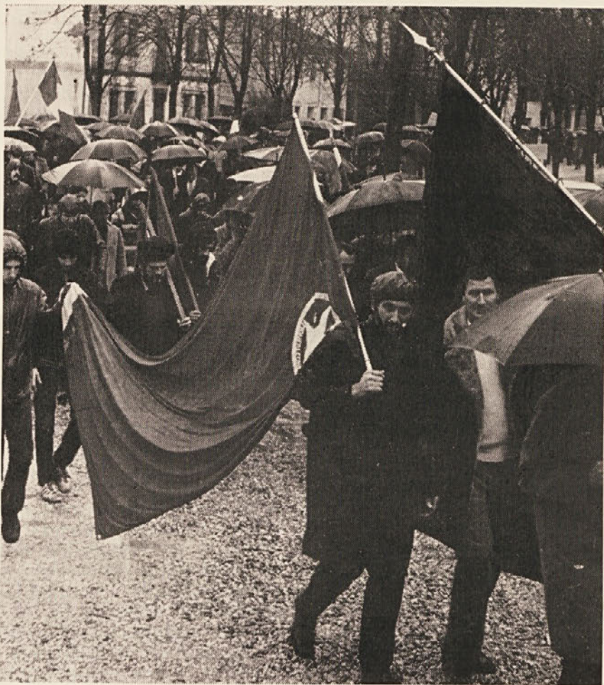
Protifašistična enotnost je bila močnejša od vlade, ki jo vodita Andreotti in Malagodi. Onemogočila je nevarno izzivanje. Zmaga, za katero so komunisti dali odločilni delež, naj bo v spodbudo v boju za utrditev in zaščito demokracije. Tudi volitve naj bodo del tega boja in naj pospešijo padec sredinsko-desničarske vlade!

Srednjih poti v kritičnih trenutkih ni. Zato zabimo tudi slovenske katoliške volivce, naj 26. novembra okrepijo KPI. Naši interesi so skupni: smo proti centrizmu, smo proti fašizmu, smo za napredek.