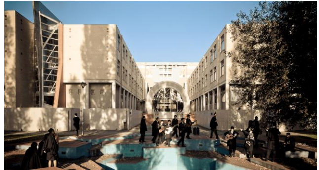
Figure 1 - Main building of the Porto Accounting and Business School

In Portugal, every student has to pay tuition and in ISCAP this is no different. If you are an Erasmus student, you do not need to worry about that because these fees are only for full-time students. If a student does not possess the financial resources to pay these fees, they may apply for a scholarship, and with this application, the student can receive either a full scholarship (all tuition fees are paid) or a partial scholarship (half of the tuition fees are paid and the student must pay the other half).