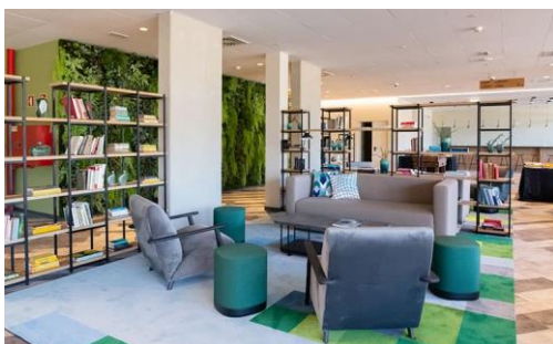
Figure 3 - Common area in student residence

Finding accommodation in Porto is usually not difficult, although it may be a little expensive, there are many student residences and apartments throughout the city but mainly in the university areas but unfortunately, there are no student dormitories from the universities where you can find accommodation at a cheap price, however, rent for a student residence in Porto usually varies around the 250-350 euros, while a private apartment can have a rent up to 600 euros depending on the size and location of the place.