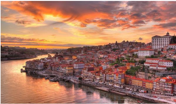
Figure 2 - Riverside of Porto

ISCAP (Porto Accounting and Business School) was founded in 1886 and with over 5000 students ISCAP is one of the oldest universities in Porto. It is known for having a wide range of courses and is also one of the institutes that takes pride in honoring the academic traditions in Porto year after year. Every year ISCAP receives around 100 students from the Erasmus program per semester, and additionally, between 150 and 200 international students from PALOP countries (African countries that have Portuguese as their official language).