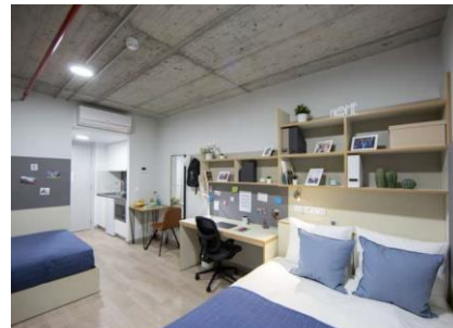
Figure 4 - Double room in a Student residence