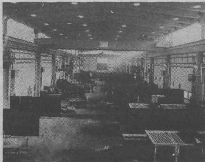
Novi prostori oddelka novogradenj

● SGP SLOVENIJA CESTE: SLOVESNOST Z NOVO DELOVNO ZMAGO