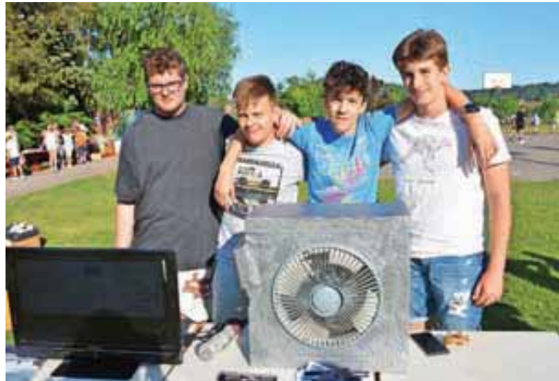
Osmošolci so prikazali tudi, kako so izdelali rekuperacijski sistem.

V tednu, ko je bil dan odprtih vrat, so OŠ Preska v okviru mobilnosti Erasmus+ obiskali učenci, stari 15 let, iz romunskega mesta Sibiu. Na sprejemu so se predstavili učenci prvih razredov, prav posebno vez pa so z njimi spletli devetošolci.