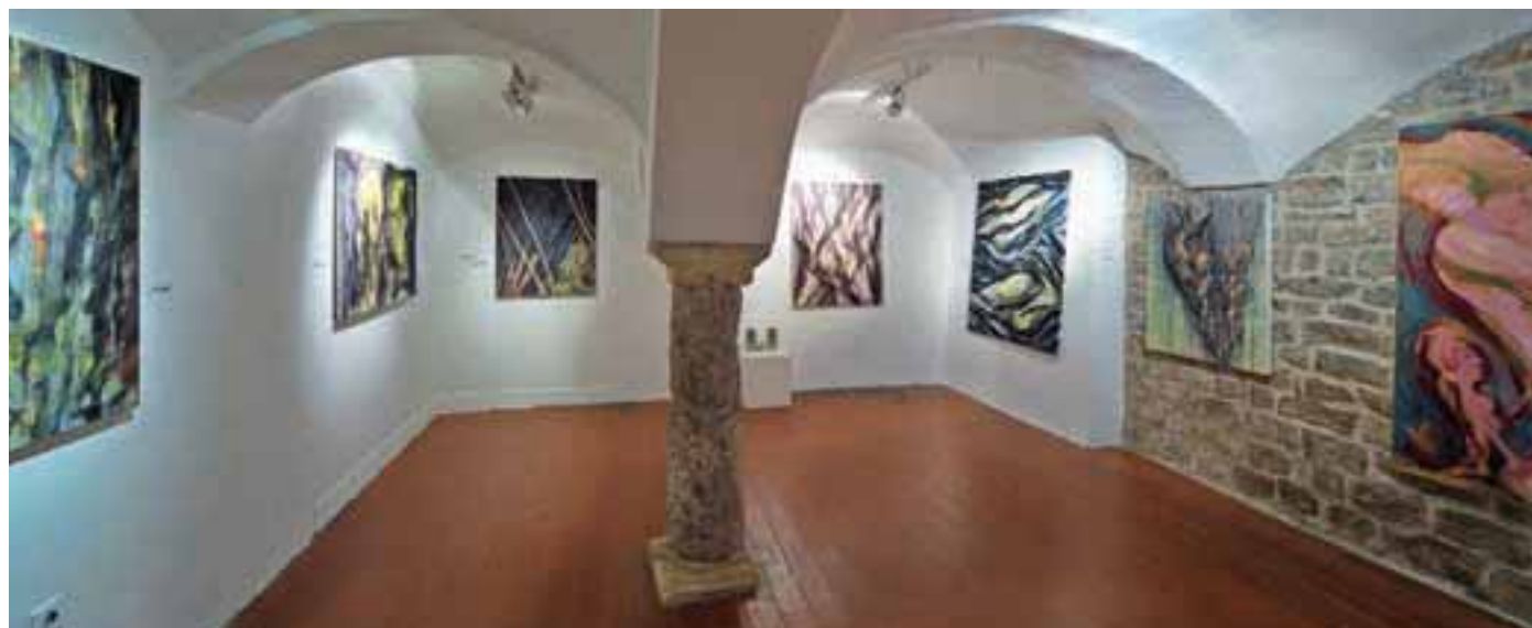
Pogled na razstavo v Galeriji Ivana Groharja

Rad slišim vtise obiskovalcev razstave svojih del. Bolj so drugačni in daleč od mojih misli, bolj se mi zdijo zanimivi. To je plačilo za moj trud, saj sliko puščam odprto za širše in bolj raznolike interpretacije. Ljudje slike povezujejo s stvarmi ali dogodki iz zasebnega življenja, v njih vidijo figure, živali, ki se v mojih slikah vedno znova pojavljajo. Ob svojih delih rad poslušam občutke drugih.