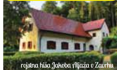
rojstna hiša Jakoba Aljaža v Zavrhu

INFORMACIJE in OBVEZNE PRIJAVE za ŠTART 1 NA: info@visitmedvode.si ali na 01 361 43 46 (6.- 11. in 14. - 17. ure)