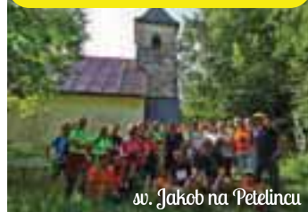
sv. Jakob na Petelincu