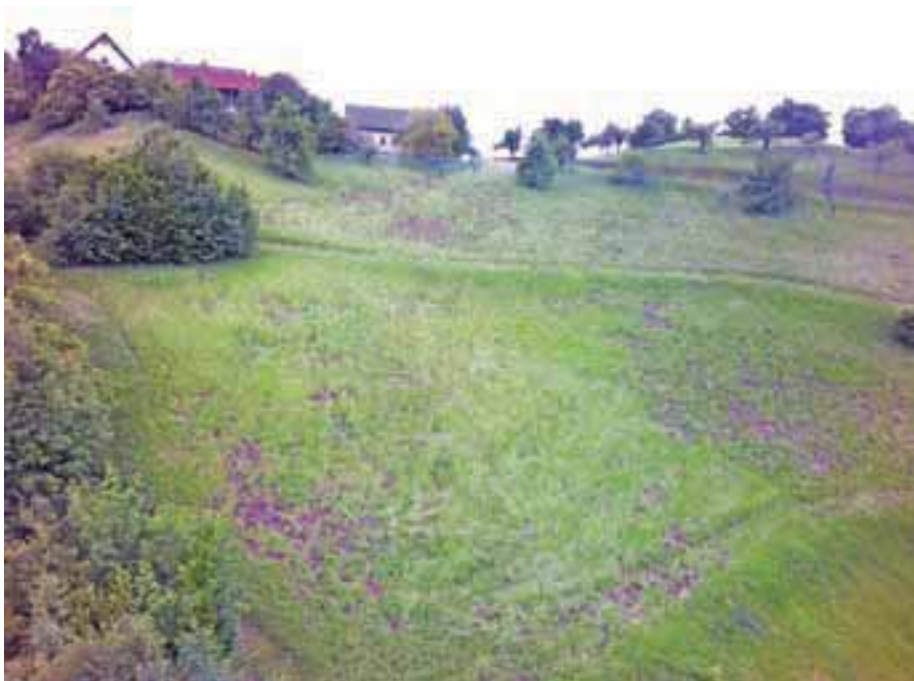
Divji prašiči so bili na delu tudi na Tehovcu.

Tehovnikovi imajo kmetijo na Tehovcu. Da so bili divji prašiči na delu, je na travnikih več kot očitno. »Pridejo ponoči ali v zgodnjih jutranjih urah. Težave se iz leta v leto le še stopnjujejo. Razlog je najverjetneje prevelika populacija, ki se ne obvladuje. Za divjimi prašiči ostane prazna, blatna in močno onesnažena krma,« poudarja Tehovnikova in dodaja, da je primerna krma bistvenega pomena za zdravje govedu. Kmetijo smo obiskali