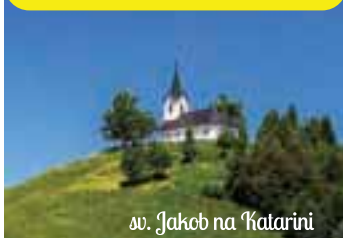
sv. Jakob na Katarini