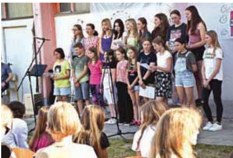
Pripravili so tudi kulturni program.