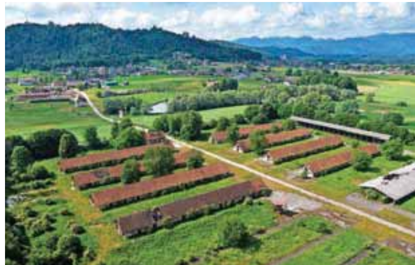
Območje nekdanje Agroemone v Hrašah sameva.