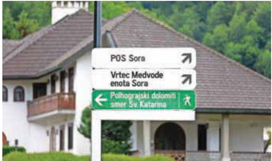
Občina Medvode je začela s postavljanjem novih obvestilnih tabel.

Postavljena je v obliki lamel, ki omogočajo vodenje do kulturnih, naravnih ali turističnih znamenitosti ter tudi do drugih gospodarskih subjektov ali objektov. Na lamele se lahko vnesejo tudi imena in logotipi gospodarskih subjektov. »Prva trasa, na kateri smo se lotili novega urejanja, je območje od Preske do Sore in naprej proti Dolu. Turistična obvestilna signalizacija za javni sektor je že postavljena, v nadaljevanju pa želimo postaviti še obvestilne table za gospodarski sektor. Vse gospodarske subjekte, ki bi želeli svojo signalizacijo na tem območju, smo zato pozvali, da nam sporočijo svoj interes. Postavitev lamele je možna znotraj naselja, v katerem je podjetje, torej v prvi fazi na trasi Medvode–Preska–Vaše–Go-