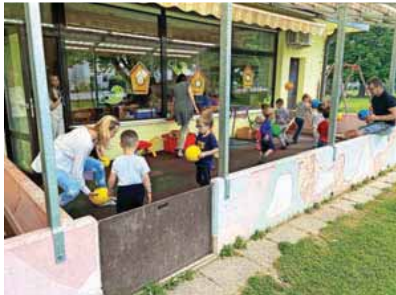
Enote Vrtca Medvode so odprle svoja vrata tudi za starše in hkrati izvedle dan fit pedagogike.