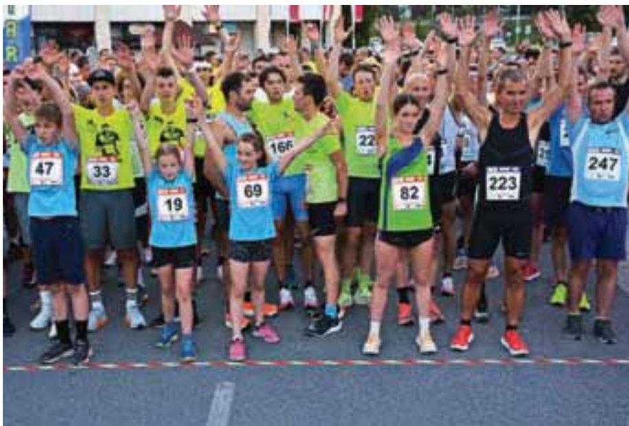
Na startu je bilo skoraj 240 tekačic in tekačev.