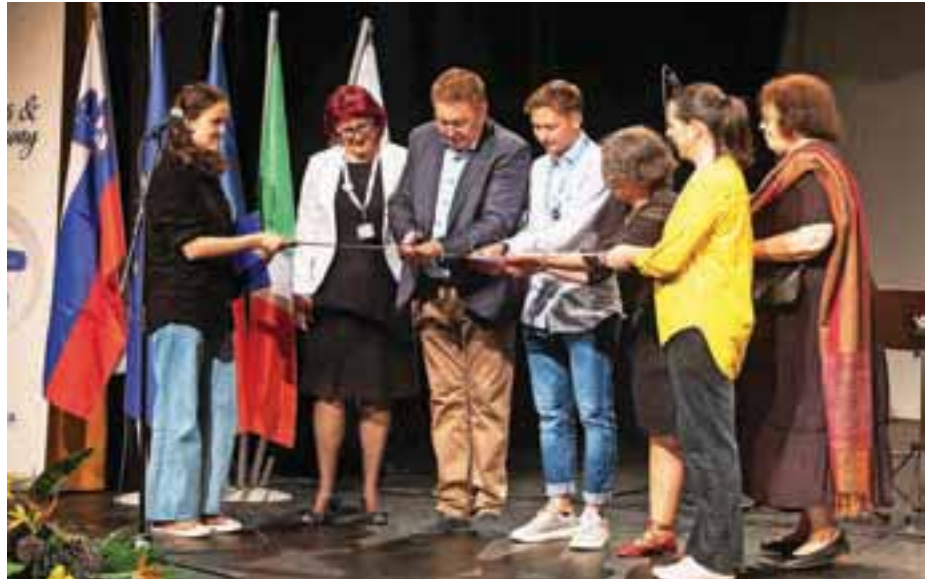
Utrinek z odprtja razstave

Srečanje je pomenilo tudi zaključek projekta Lepota harmonije (Lens & Harmony), v katerega so bile vključene Medvode, Crest, Ponte san Nicolo in Nidda. Prijatelji iz Nemčije se ga niso mogli udeležiti, so pa prispevali fotografije. Namen projekta je bil skozi fotografijo in glasbo povezati prijateljska mesta ter spodbuditi medkulturni dialog in razumevanje. Mednarodni odbor Medvode je s projektom na evropskem razpisu uspešno kandidiral že leta 2019. Zaradi epidemije so ga prestavljali dve leti. V Medvodah in v vsakem od vključenih mest so izvedli anketo med prebivalci na temo stereotipov, pripravili so izbor fotografij in poiskali glasbenike. Vsako mesto je objavilo fotografski natečaj in izmed prispelih fotografij v Medvode poslalo najboljše. Skupaj je bilo oddanih več kot šestdeset fotografij 16 avtorjev. V fi-