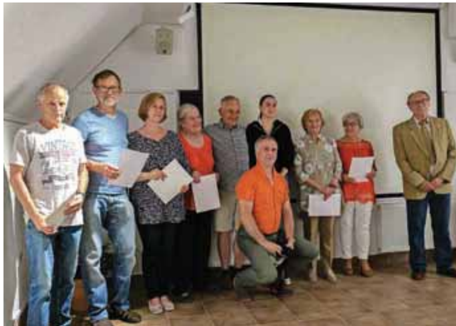
Prisotni prejemniki priznanja za desetletno aktivno delo v KUD JaReM