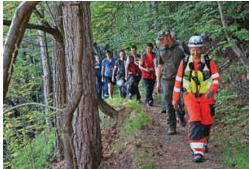
Iskalna akcija je bila uspešna. Lovca, pogrešanega na območju Gontarske planine, so našli.