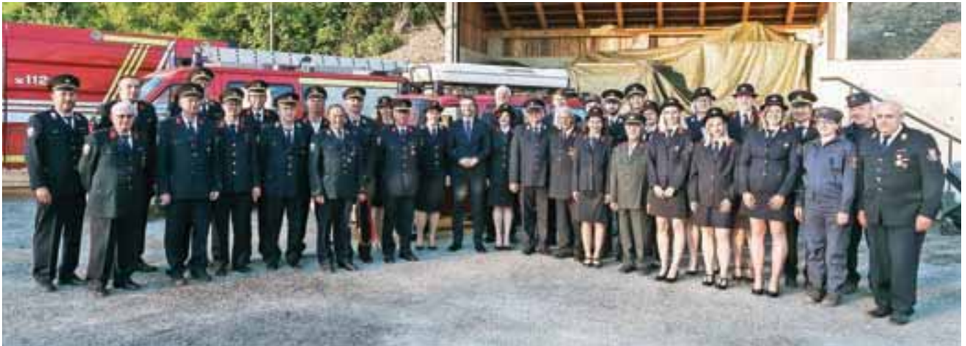
Gasilci PGD Sp. Pirniče - Vikrče - Zavrh z ministrom za obrambo

V PGD Sp. Pirniče - Vikrče - Zavrh in PGD Smlednik so zabeležili sto let delovanja, v PGD Preska - Medvode pa še deset let več.