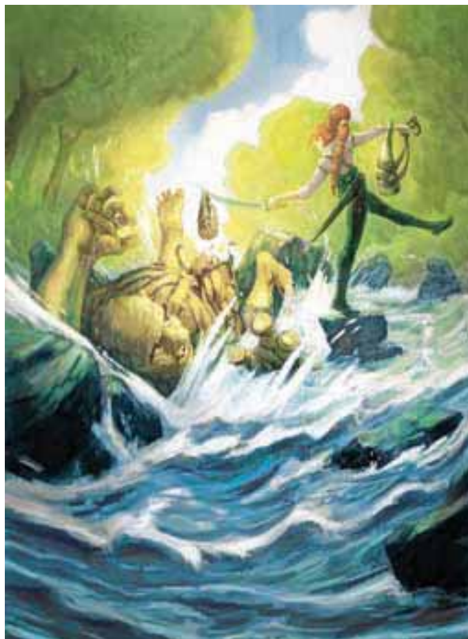
Ilustracija Cunning za igro Destiny's Divide

Treba je povedati, da sem pošasti in fantastične motive risal, preden sem slikal. V otroških letih sem pri slikanju gledal očeta, pa sem hotel biti njemu podoben in sem tudi sam risal. Izmišljal sem si svoje pošasti. Ko sem v srednji šoli odkril Tolkierna in njegove romane, sem navdušeno začel risati Srednji svet. Na akademiji sem ilustracijo začel zanemarjati, ker se mi je zdela preveč površinska in premalo art. Seveda sem ves ta čas spremljal ilustracijo in strip, a si nisem dovolil tega tudi sam početi. Pred kakimi sedmimi leti sem si potem nabavil grafično tablico – v to so me prepričali kolegi ilustratorji, češ saj znaš risati, poskusi digitalno, v tem je tudi zaslužek. Nisem verjel, a sem poskusil. Kolega mi je ob priložnosti dejal, da je začel razvijati računalniško igrico in potrebuje ilustratorje. Tako sem mu tri ilustracije narisal jaz,