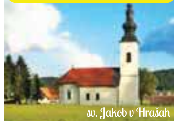
sv. Jakob v Hrašah