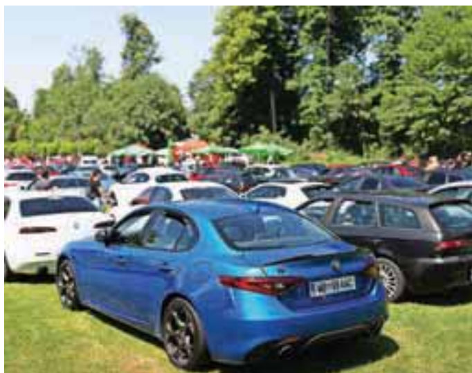
Vozila Alfa Romeo so bila vedno lepa in zmogljiva, zato imajo med avtomobilisti veliko privrženecv.

Slovenski ljubitelji vozil Alfa Romeo so se po letu premora spet zbrali v Zbiljah, kjer so pripravili veliko srečanje slovenskih »alfistov«. Na Zbiljski dobri se jih je zbralo krepko več kot sto.