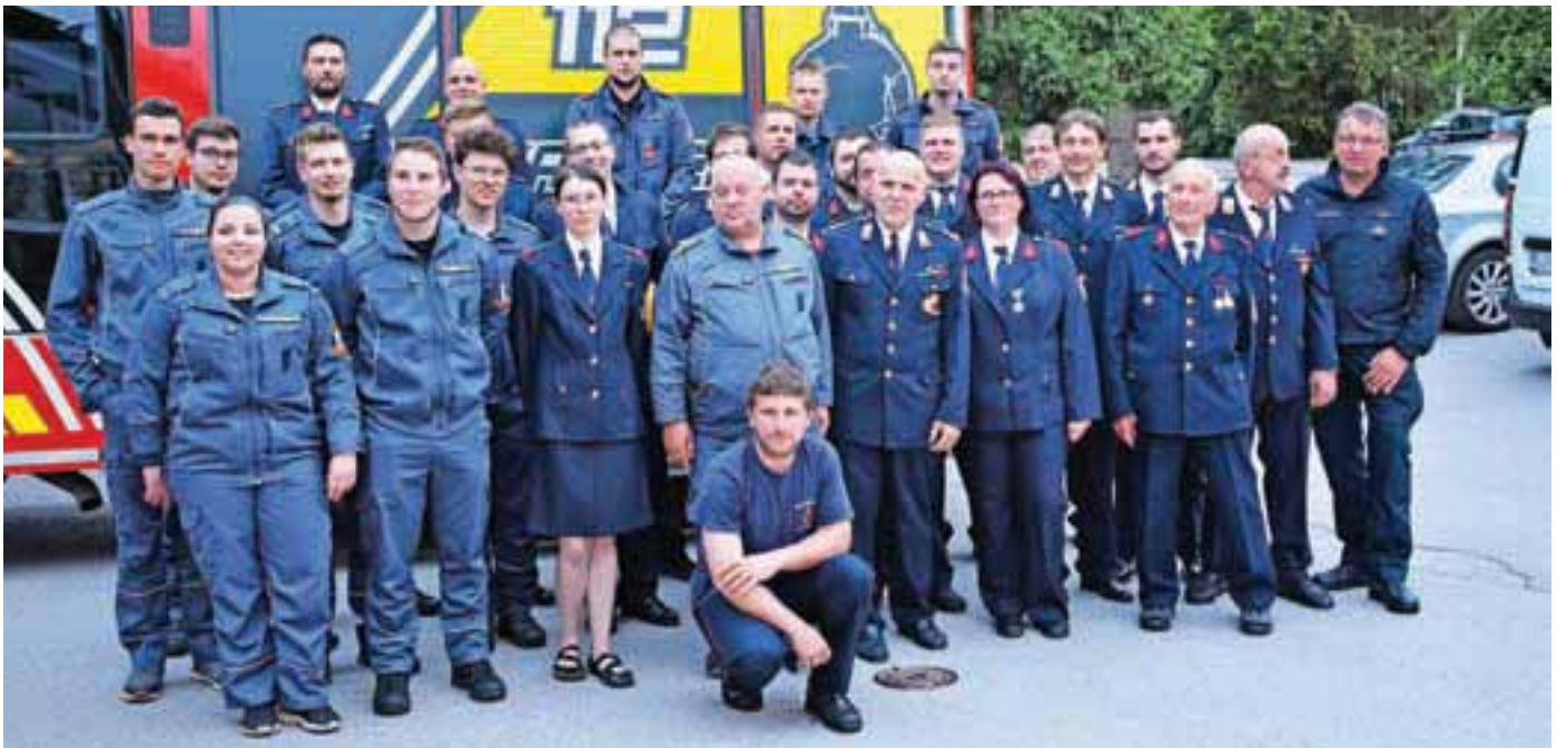
PGD Preska - Medvode