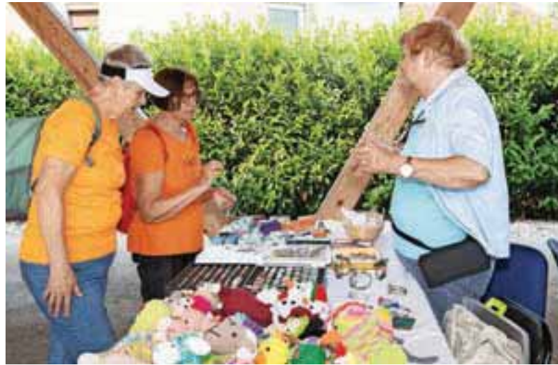
Vodilo Tržnice znanj je predajanje in prejemanje znanja.