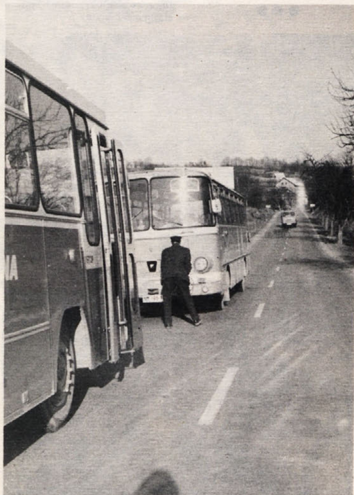
S sodobnimi Viatorjevimi avtobusi se vozijo v službo in domov zaposleni v Beti iz raznih belokranjskih vasi. Sile, porabljene pri peš hoji, lahko delavec zdaj v večji meri daje podjetju.