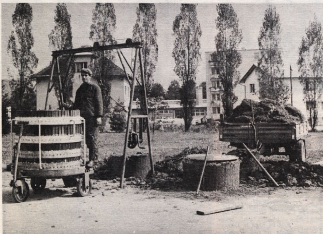
Pa pride trgatev pa je mlačev pa je treba žeti... Ob takih priložnostih je vselej več „bolnih“, zato so številni izostanki po en dan, kar pa se v teku enega leta nabere v lepo število izgubljenih ur za podjetje.