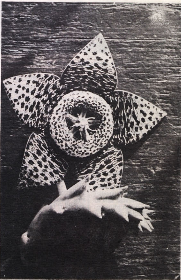
Ni dodatek k ženski obleki, ni modna muha kreatorjev, s katero bi zmedli ženskam glave in jim praznili denarnice, pač pa kaktusov cvet.

Na seji poslovnega odbora 11. septembra, so sprejeli naslednje sklepe: