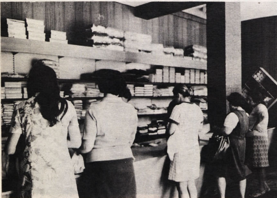
Industrijska prodajalna je namenjena predvsem delavcem, radi pa postrežejo tudi zunanjim kupcem. Še posebno je velik promet ob sobotah, ko imajo drugi prosto. V trgovini prodajajo 80 odst. domačih izdelkov in 20 odst. izdelkov poslovnih partnerjev. Posnetek je iz metliške trgovine.