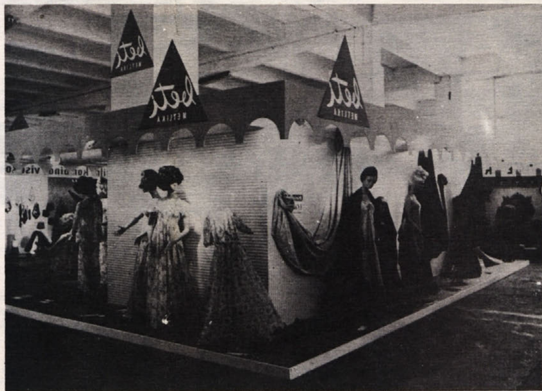
Zagrebški velesejem si je ogledalo nad milijon in pol obiskovalcev. Veliko zanimanja je vzbudil tudi naš razstaveni prostor, na katerem so prevladovala spalne srajce in pižame iz pliša, velurja in charmeusa. Precej zanimanja je bilo tudi za diolen loft. Predstavniki BETI so na velesejmu dobili veliko naročil.

Dobro obveščeni občani — dobri samoupravljavci!