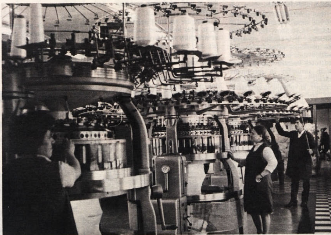
Delovni motiv iz metliškega obrata

— Ni vsakdo košarkar, ki ne more skozi tovarniška vrata.