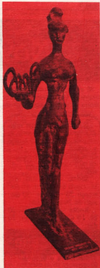
Tak je srebrni Modfest, ki ga je dobila BETI na jesenskem zagrebškem velesejmu za diolen loft.

Dobro obveščeni občani — dobri samoupravljavci!