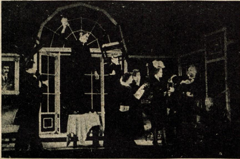
Nušičevi »Žalujoči ostali« na odru MG - Jesenice