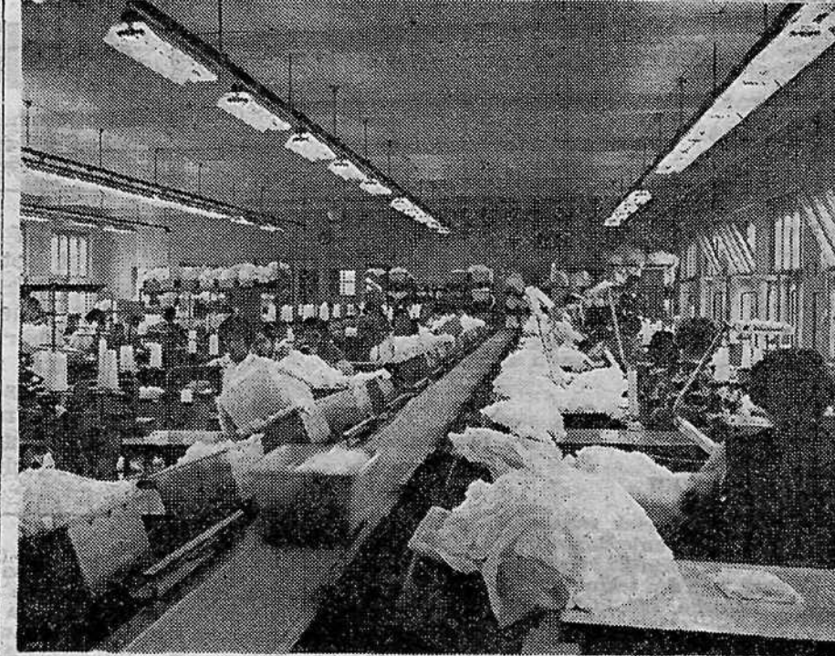
M. C. D.

V kolektivu Kartonažne se zavedajo, da bodo na področju samoupravnosti in družbeno politične dejavnosti morali še veliko storiti, če bodo hoteli ustvariti res zadovoljive medsebojne odnose. Zaenkrat so na tem področju še največ naredili v TOZD Tržič in Rakek.