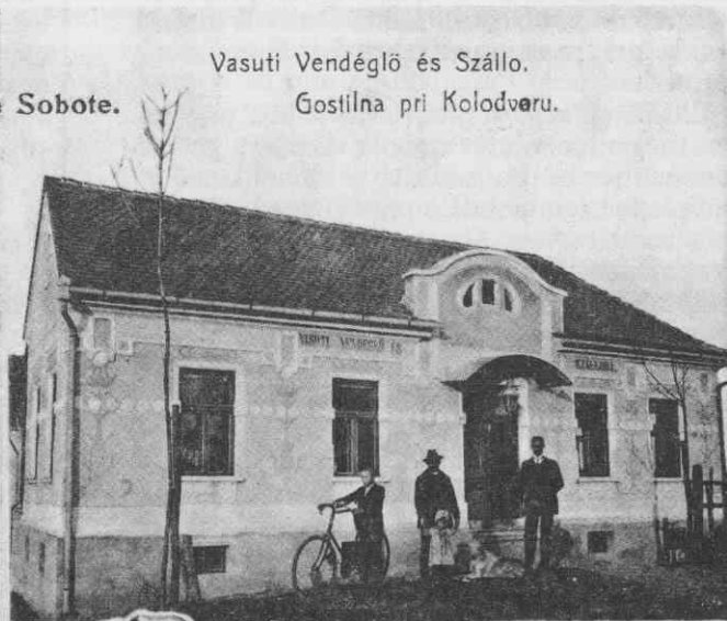
Vasuti Vendéglő és Szálló.