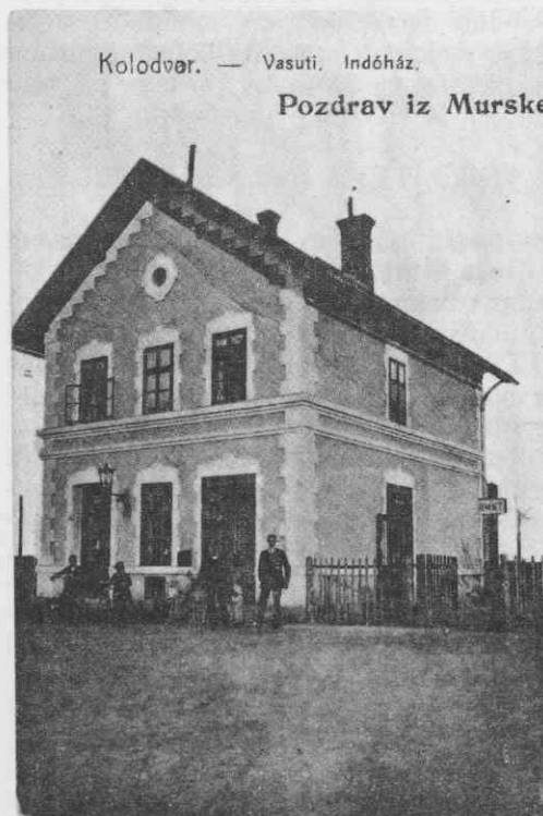
Kolodvár. — Vasuti. Indóház.

Zelo pomembno bi bilo torej sodelovanje zgodovinarjev dveh sosednjih dežel ter določitve skupnih raziskovalnih ciljev za odstranitev belih lis v raziskovanju. Skupaj bi morali obdelati vse podatke v raznih arhivih, ki se nanašajo na Prekmurje. Pri tem je realno misliti na izdajo skupnih krajevnih zgodovinskih monografij ali pa objavo arhivskega gradiva za določene kraje. Temu pomembnemu delu in raziskovalni dejavnosti Arhiv županije Zala daje na razpolago svoje bogato gradivo in umsko kapaciteto.