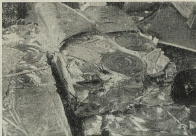
▲ Takole izgledajo proizvodi, ki nastanejo po stiskanju