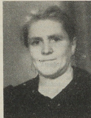
▲ Vrečarjeva mama

najstleten deček je odšel februarja 1943 v partizane. Že po petih mesecih je obležal smrtno zadet v Tehaboju na Dolenjskem. »Saj je bil še otrok, ko je odhajal, a braniti mu nisem mogla!« je tiho dejala. »Veš,« je pripovedovala dalje, »čez dan smo bile bolj malo skupaj. Zaradi noge sem se morala držati bolj v senci. In zdaj me je zlo-mek spet začel boleti! Ko mi je prišel predsednik ZB povedat naj se pripravim za na morje, kar verjeti nisem mogla. Res, lepo je bilo in zelo smo vam hvaležne!«