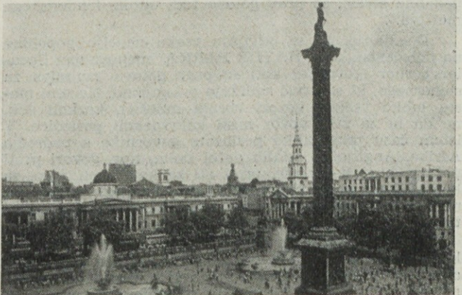
▲ Trafalgarski trg v Londonu

Anglija, ki predstavlja največji del Združenega kraljestva Velike Britanije in Severne Irske, leži na južnem delu otoka Velike Britanije. Od evropske celine jo loči prekop, znan pod imenom Kanal La Manche. Najbolj udobno potovanje na otok je vsekakor z letalom, ki traja od Zagreba preko Pariza do Londona približno 6 ur, seveda odvisno od vrste letala, s katerim se potuje. Na otok lahko pridemo tudi tako, da se z vlakom pripeljemo do enega od pristanišč na obali evropske celine se vkrčamo na ladjo, ki nas pripelje preko kanala na obalo Velike Britanije. Se posebno zanimivo pa je potovanje preko Kanala z ladjo — trajektom — npr. od Francoskega pristanišča Calais do angleškega pristanišča Dover. Zanimivost pri tem potovanju je ta, da popolno kompozicijo vlaka zapeljejo na ladjo — trajekt, ter tako po že imenovani poti, ki je istočasno tudi najkrajša pot preko kanala, pridete na ozemlje Velike Britanije, ne da bi