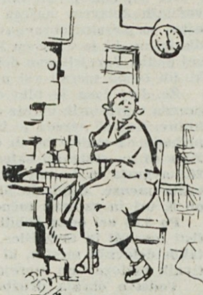
▲ Če med delom malo počijemo, nič zato. Minimalni osebni dohodek bomo že dobili

3. Vsaka nosečnica naj izkoristi vsaj mesec predporodnega dopusta! Vse nosečnice bi se morale zavedati, da je telesni in duševni napor v zadnjem mesecu nosečnosti med glavnimi vzroki za prezgodnji porod. Leon Kos