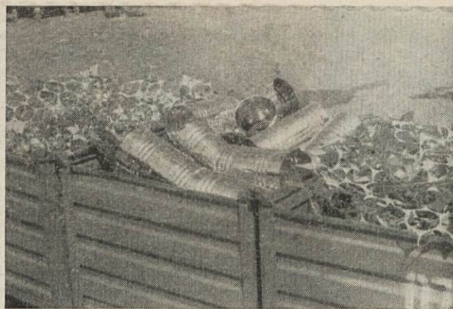
▲ Zaboji za odpadke v obratu Zalog