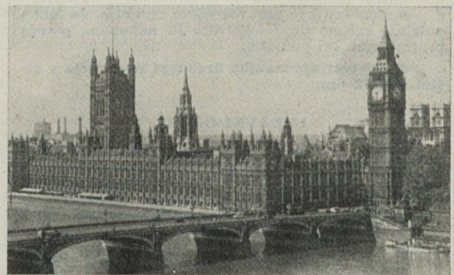
▲ Pogled na stavbo parlamenta z reke Temze

zapustili svoj sedež na vlaku ali svojo posteljo v spalniku.