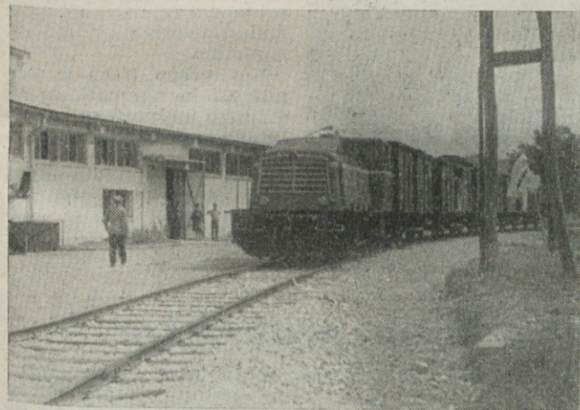
▲ Novi industrijski tir je za obrat Zalog velika pridobitev