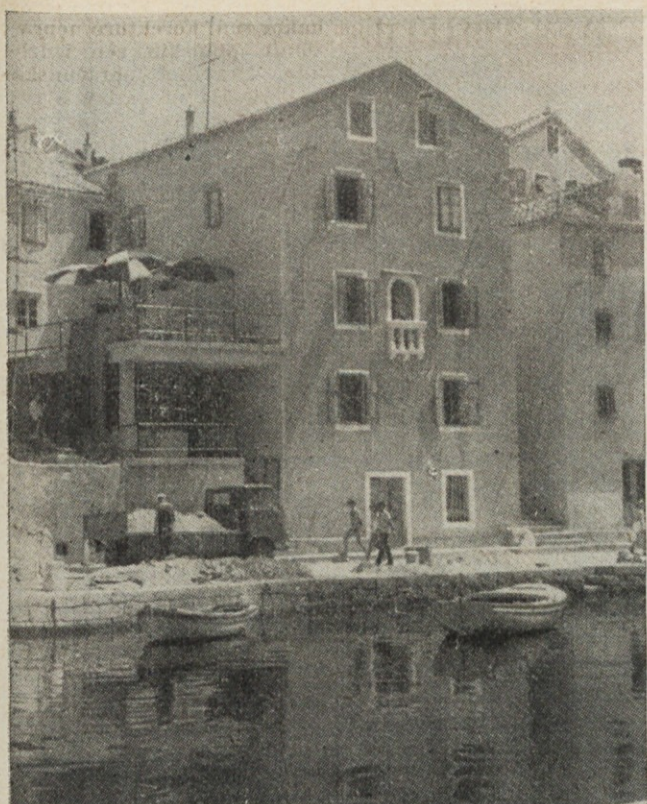
▲ Res je prijetno preživeti nekaj dni na morju. Še posebno mikavno pa jih je preživeti v našem počitniškem domu na Velem Lošinju

Za nov tip mopeda, ki ga osvaja Tomos, moramo izdelati Nadaljevanje na 10. strani