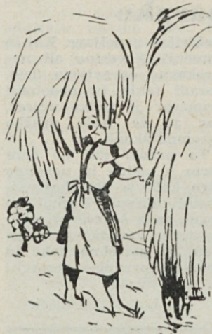
▲ Domače delo nikoli ne počaka. Ko pride njegov čas ga je treba opraviti