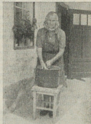
▲ Šumbergarjeva mati med veliko žehi