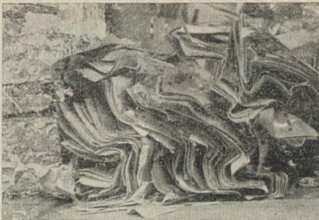
▲ Skladišče odpadkov v obratu v Mostah