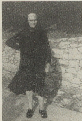
▲ Polkova mama na Velem Lošnju

POLK-ovi mami Antoniji je bilo okrevanje prav gotovo zares potrebno. Komaj štirinajst dni pred odhodom v Lošinj se je za vedno poslovila od svojega moža, železniškega upokojenca, ki je skupaj z njo vzgojil tri sinove — tri junake. Za vsakega izmed njih veljajo Kajuhove besede: