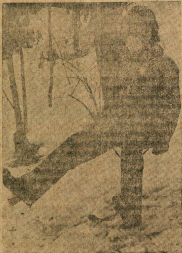
NOVA VRSTA SPORTA? — Slika kaže pripravo za drčanje po snežnem bregu na trinožniku pritrjenem na smuč. Maska preko ust in nosa naj drčanje varuje pred hudim mrazom. Novo vrsto sportne zabave preskusajo v Copertownu, N.Y.