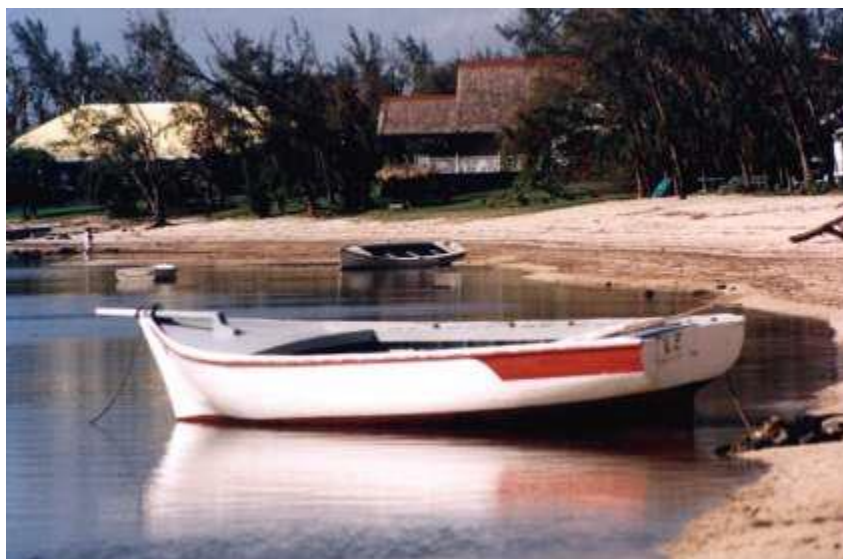
Obala Riviere Noire, kjer je pristal čoln in kjer je ostal lan

Bilo je okoli polnoči. Kraj je bil pust, nobenih avtomobilov, ničesar. Oklenil sem se fanta in razmišljal, kako bom prišel v bolnišnico ob tej pozni nočni uri. Desna noga je bila tako oslABLJENA, da sem se usedel na asfalt. Fant mi je skušal pomagati, a na koncu je spet začel kazati na morje, rekoč: »Moji bratje, moram jih poiskati.« Rekel sem: »Ne, ostani tukaj, da mi pomagaš.« Vedel sem, da lahko varno priplavajo, ker so meduze na zunanji strani greben. Toda odšel je, jaz pa sem sredi noči ostal sam ob cesti. Upanje me je zapuščalo in ulegel sem se, da bi počival.