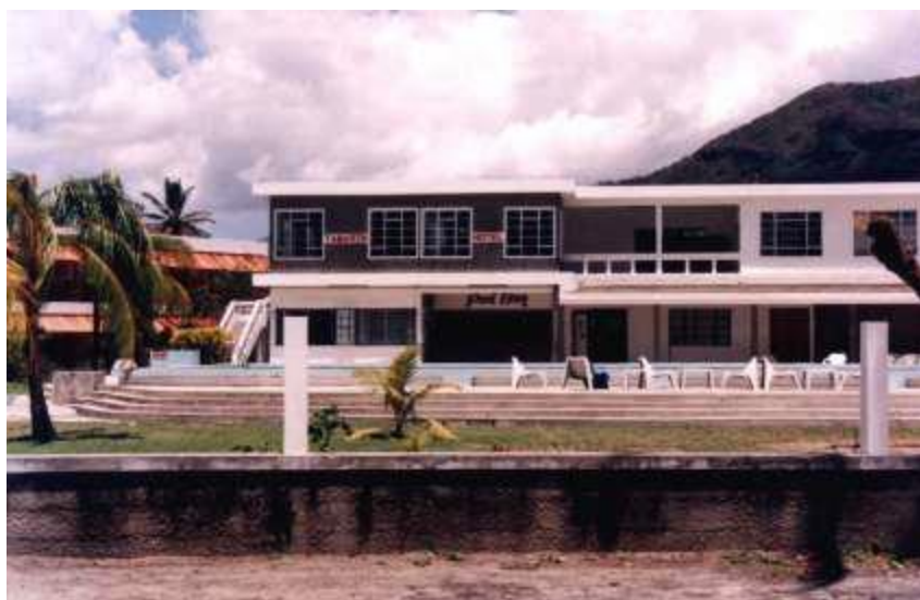
Hotel Tamarin Bay