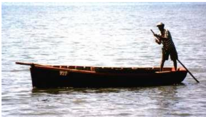
Lesen čoln na Mavriciju

Moja dva prijatelja sta čoln z mano vred začela nositi čez skale na grebenu. Na dnu so se pojavile luknje. To je bil lesen čoln in njihovo sredstvo za preživetje, zato sem vedel, da je situacija zelo resna, ker sta tvegala, da se poškoduje. Odnese sta ga do lagune in ga plavajoč skušala potisniti naprej. Rekel sem jima: »Pojdita z mano!« Toda rekla sta: »Ne, pretežko je, fant te bo spraval na plažo.« Potem je mladenič s palico potiskal čoln proti obali.