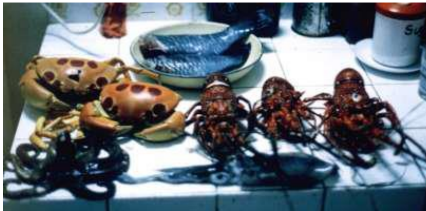
Tipični ulov morskih sadežev

ponoči, mi pa jih le oslepimo s podvodno svetilko in nato enostavno poberemo. Ribe ponoči spijo in odločiti se morate le, katero si želite in si jo privoščite za večerjo. To je bil krasen šport in svoj ulov smo lahko prodajali lokalnemu turističnemu hotelu.