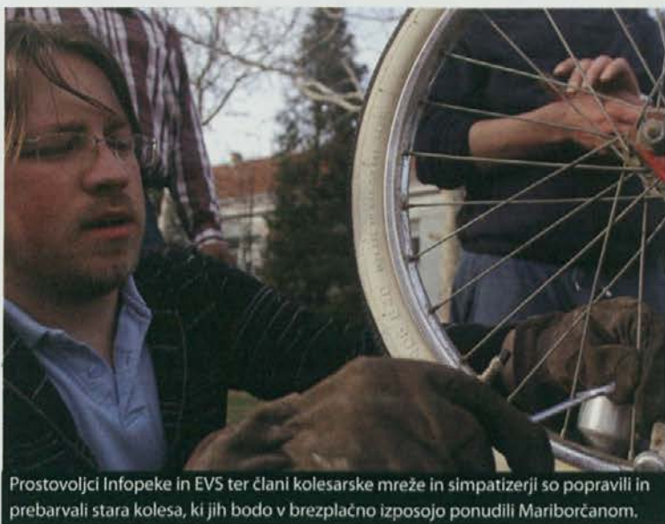
Prostovoljci Infopeke in EVS ter člani kolesarske mreže in simpatizerji so popravili in prebarvali stara kolesa, ki jih bodo v brezplačno izposojlo ponudili Mariborčanom.

Skratka, prav nič čudno ni, da je prostovoljsko delo v pravem razmahu v zadnjih desetletjih, ko ekonomski procesi vse bolj težijo k t. i. jobless growth (rasti brez zaposlenosti), ko je vedno večje število ljudi izključenih iz produkcijskih procesov in s tem iz družbe kot take. Posamezniki zato vse pogosteje iščejo možnosti samopotrjevanja in vključevanja v družbo v prostovoljskem delu, ki pa je potemtakem »prostovoljno« zgolj v navednicah. Kje je tukaj »prosta volja« posameznika, ki je brezposeln in brez prave možnosti za zaposlitev ter posledično za vključitev v družbo? Imenovati brezposelnega, ki opravlja neplačano delo, prostovoljec, je enako paradoksalno, kot reči mu, da ima veliko prostega časa.