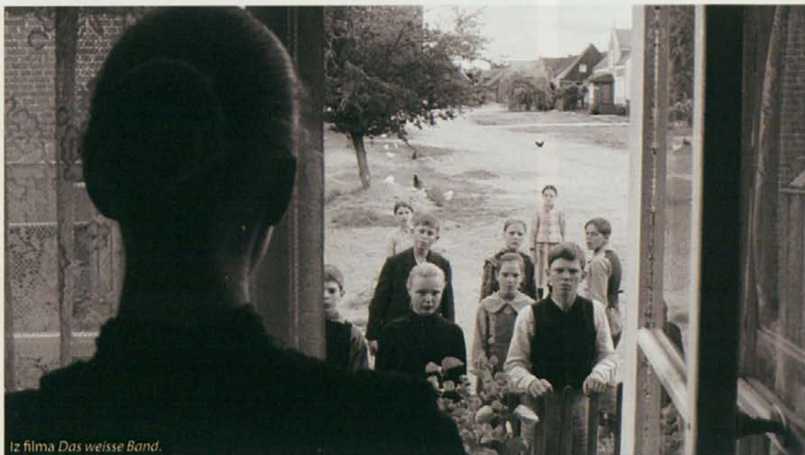
Iz filma Das weisse Band .

Gre, kot smo dejali, za moralno sliko, kolaž, ki protagoniste in prav tako gledalca ne izpusti iz primeža nasilja, obscenosti in še česa. Lahko bi rekli, da je Haneke prikazal svet, kakršnega nočemo poznati, če ga že ne, in to na izrazito oprijemljiv in prav psihološko turoben način. Znova vrhunsko in neprekosljivo.