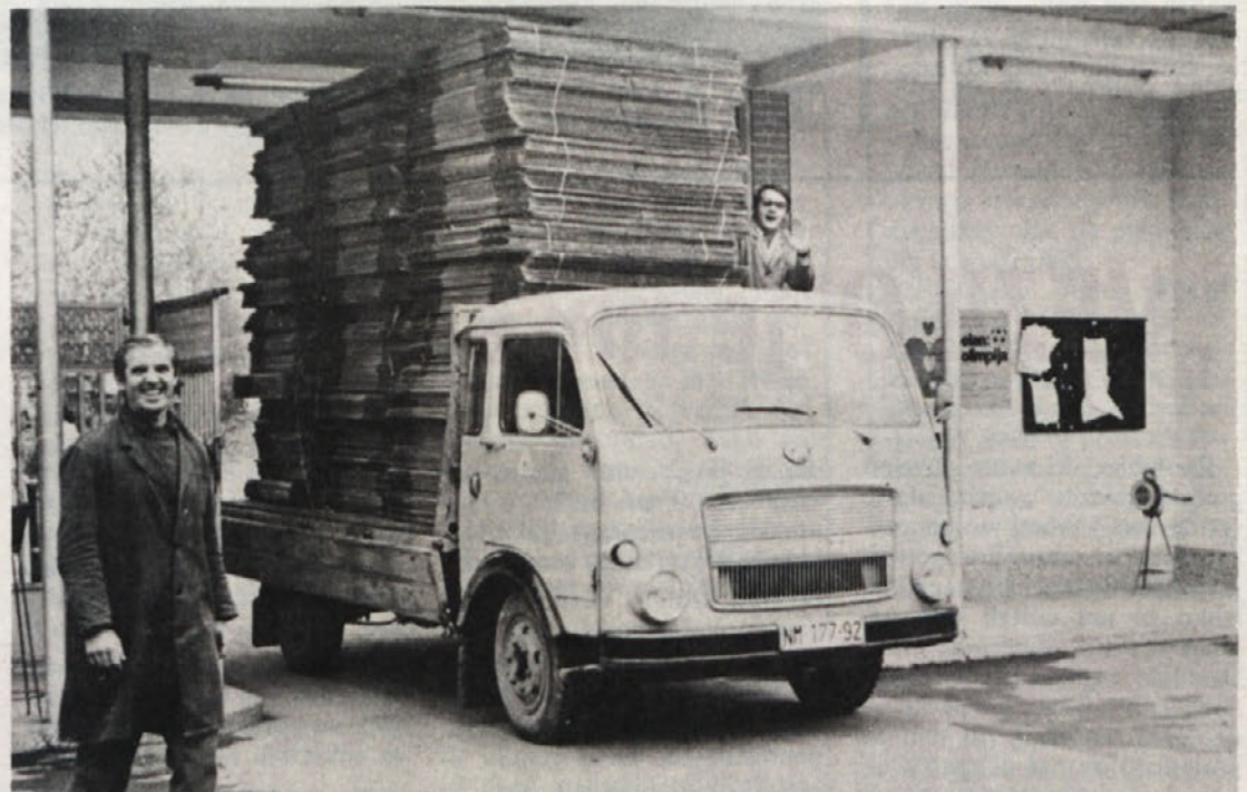
Poln kamion embalažnih kartonov, ki niso tako poceni. Tudi varčevanje z embalažo je točka stabilizacijskega programa in prav pri embalaži smo že veliko prihranili. Bi se dalo še več?