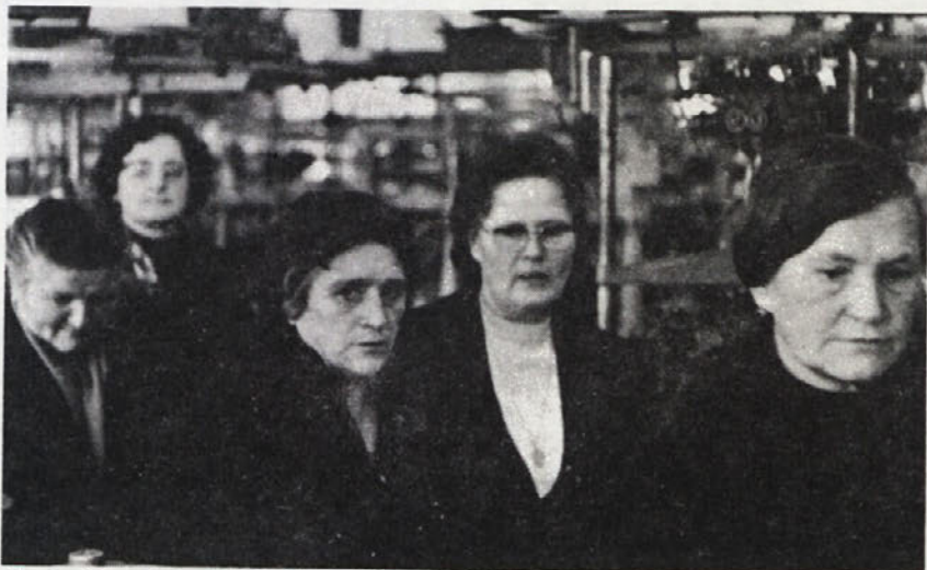
Srečanja nekdanjih naših sodelavcev, zdajšnjih upokoјencev, s podjetjem so vedno posebno doživljajo, polno lepih spominov, stiskov rok in grenkobe, da čas neusmiljeno hiti dalje, ne meneč se za naše želje, skrbi in načrte.