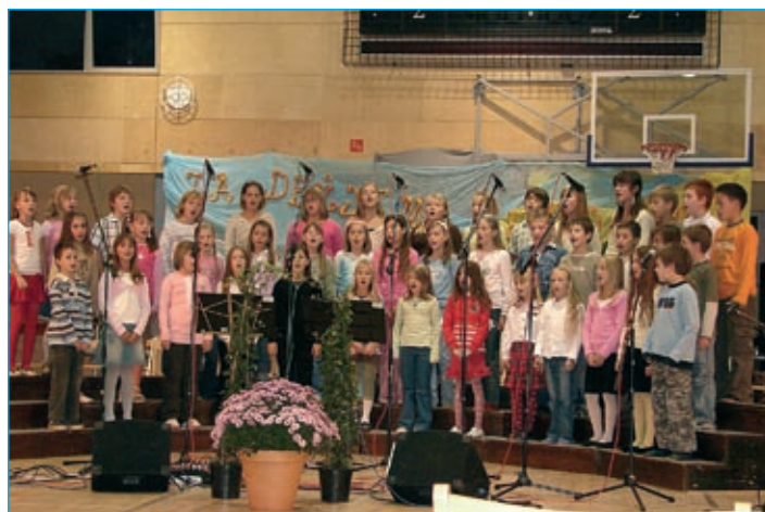
Pevski zbor OŠ Markovci