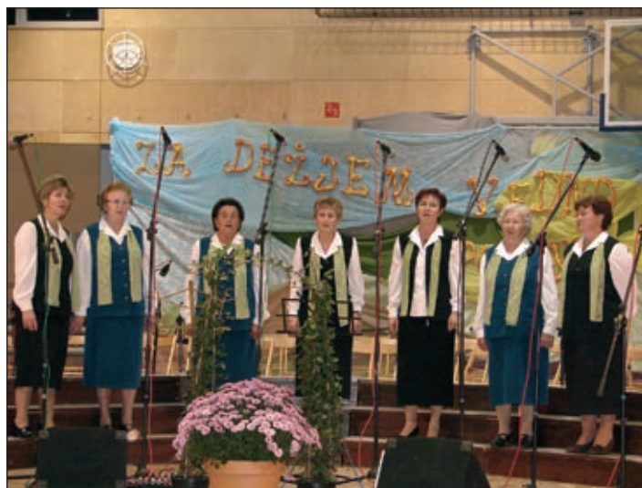
Ljudske pevke iz Zabovcev FD Markovci