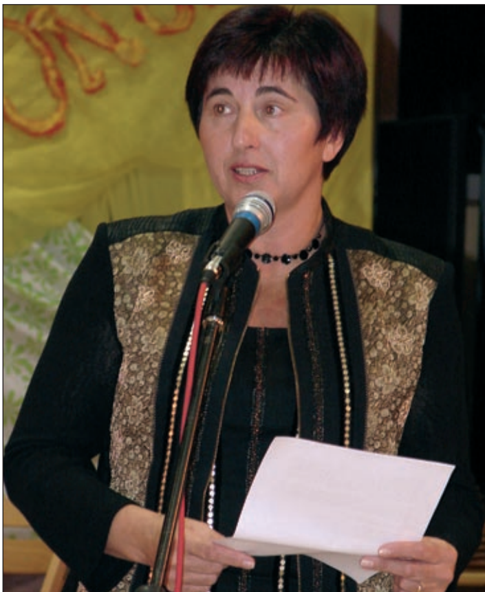
Evropsoslanka Ljudmila Novak