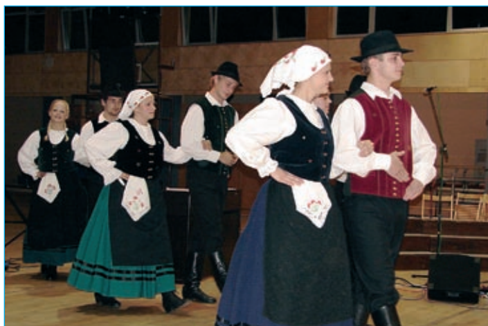
Plesna skupina FD Markovci