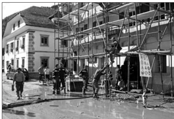
V kletnih prostorih muzeja je bilo več kot 500 m 3 vode. V štirih urah je nismo uspeli prečrpati.

Prizori, ki smo jih videli na samem kraju nesreče, so bili še veliko hujši kot prizori na televiziji. Naplavljenega blata po ulicah je bilo do kolen, porušene starejše hiše, uničeni avtomobili, polne kleti in stanovanja vode, pohištvo na ulicah in prestrašeni domačini.