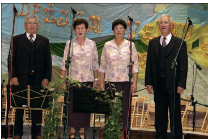
Ljudski pevci in godci iz Bukovcev