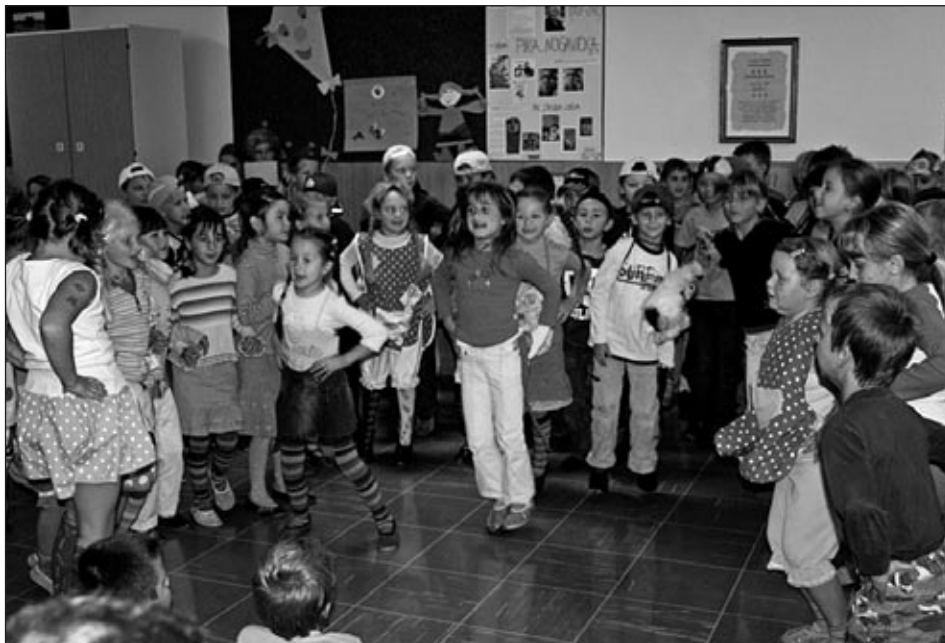
Na Pikin dan so vsi z veseljem poslušali pravljice o Piki nogavički ter peli in plesali.

V torek, 2. oktobra, so otroke razveselile vzgojiteljice našega vrtca in jim zaigrale pravljico o Rdeči kapici. Vsa pohvala igralkam, otroke pa je še posebej razveselilo to, da volk ni nikogar požrl in lovec ni ustrelil volka.