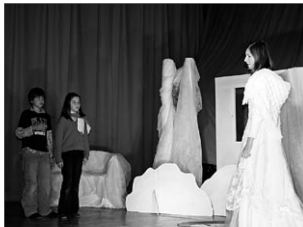
Iz predstave Snežna kraljica

Želimo jo predstaviti širšemu občinstvu, vsekakor pa jo bomo predstavili na sreča-