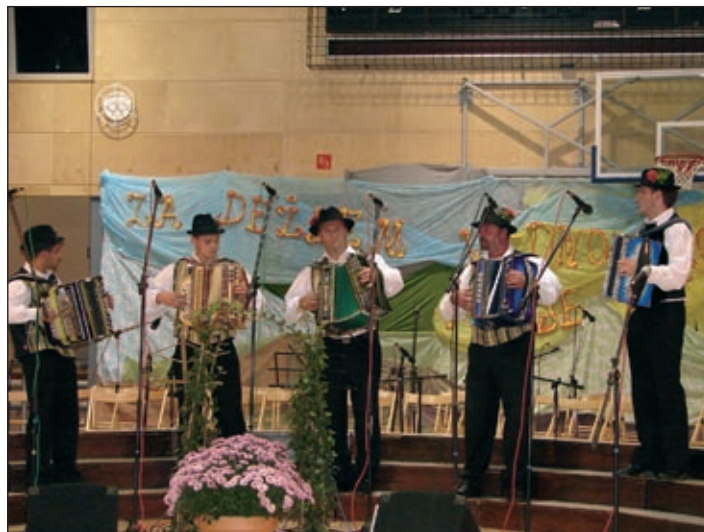
Harmonikarji iz Prvencev