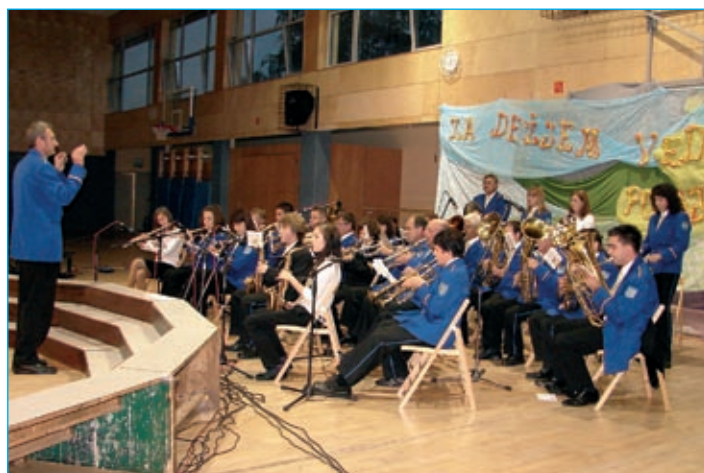
Godba na pihala občine Markovci