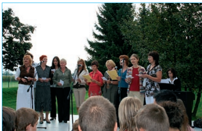
Tudi učitelji so učencem pripravili prijetno dobrodoščilo.