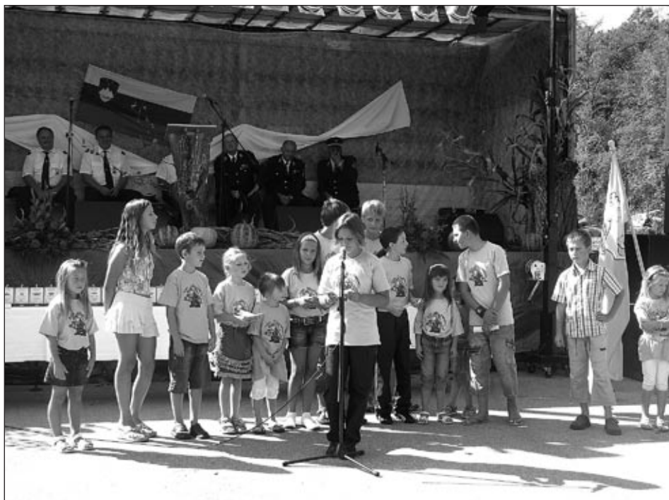
Na prireditvi so nastopili tudi najmlajši iz PGD Zabovci.

tudi naredijo. Vsi podatki o izobraževanju naših gasilcev pa se nahajajo na Območni gasilski zvezi Ptuj, ki zelo vzorno vodi evidenco.