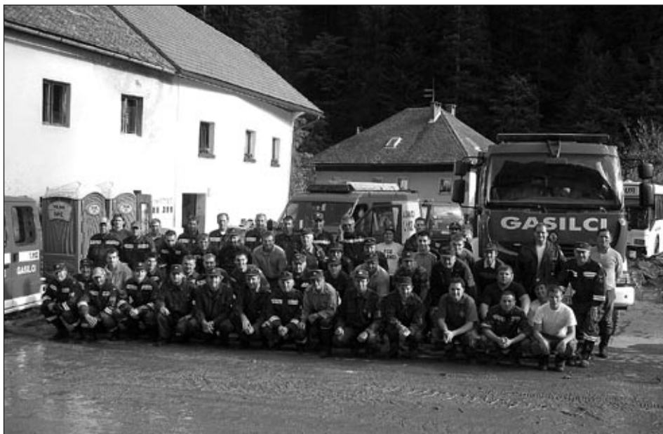
Po zaključeni akciji smo opremo pospravili in se odpravili domov.

Preko regijskega centra za obveščanje na Ptuj je bilo direktno alarmiranih 63 enot, posredno pa 84 poveljnikov in 760 gasilcev. V pičlih petih urah je bilo na odhod pripravljenih 57 gasilcev, ki so se 19. septembra točno ob 10. uri podali na dve uri in pol dolgo pot do Železnikov.