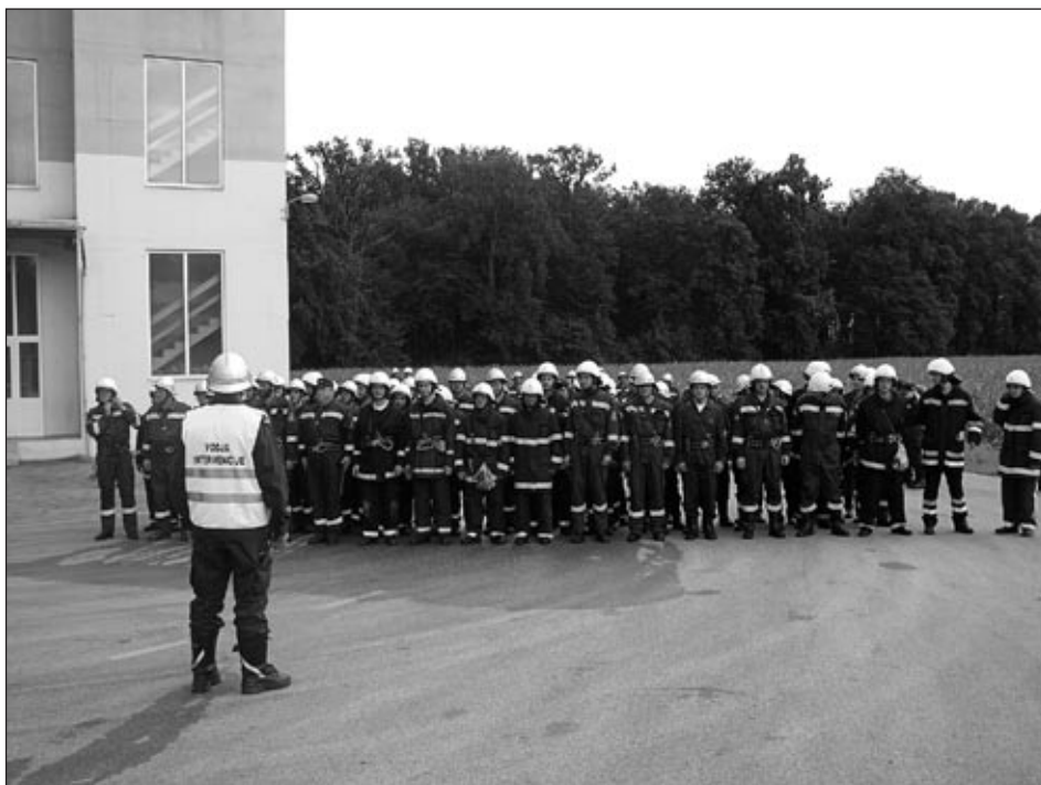
Gasilska vaja je bila izvedena na poslojpu Kmečkega mlina Korošec.