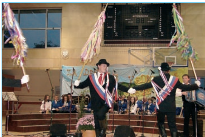
Kopjaši iz Markovcev