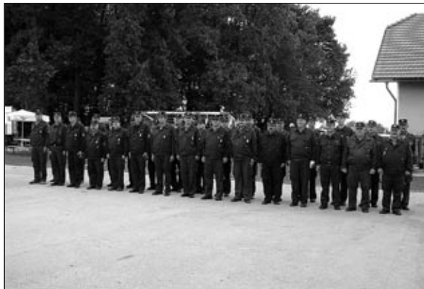
Da je tekmovanje potekalo v skladu s tekmovalnimi pravili, je skrbel 11-članski tekmovalni odbor in 45-članski odbor ocenjevalnih komisij.