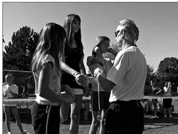
S podelitve medalj na letošnjem krosu

Najprej so k tej nalogi poklicani starši, ki lahko največ naredijo že z lastnim pozitivnim zgledom. Navade in ravnanja, ki si jih otrok pridobi v predšolski dobi pri skupnem preživljanju prostega časa, obojgatenega z vsebinami športa, je največja