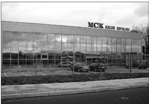
Poslovni objekt MCK