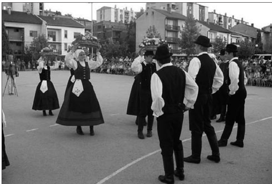
Utrinek z nastopa v Velesu

Ob prihodu domov so polni vtisov, novih spoznanj, znanstev in zelo utrujeni že začeli razmišljati o aktivnostih v naslednjem letu, ko jih čaka praznovanje ob 70-letnici društva in novo gostovanje, ki pa bo verjetno v drugi smeri kot letos – na zahod.