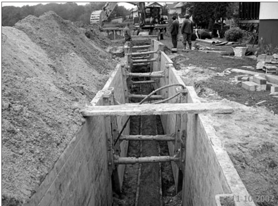
Delo na terenu

Julija 2007 smo izvedli nov javni razpis za izvedbo 2. faze sekundarne kanalizacije, ki zajema dokončanje sekundarne kanalizacije v naselju Markovci, navezavo obrtne cone Novi Jork na čistilno napravo Markovci in kompletno naselje Zabovci. Najugodnejši ponudnik na javnem razpisu je bilo Cestno podjetje Ptuj, d. d., s katerim je Občina Markovci 23. 8. 2007 podpisala pogodbo v višini 1.756.221,76 EUR z vključenim DDV. Fizično so se dela po tej pogodbi začela že v sredini septembra 2007. Vzporedno s kanalizacijo se posodablja ostala infrastruktura (asfaltne prevleke, rekonstrukcija vodovoda, javne razsvetljave in nizkonapetostnega omrežja – samo tam, kjer so obstoječi leseni drogovi). Zaradi obsega gradbenih in instalcijskih del so v času izvajanja del popolne zapore lokalnih cest, ki se sprostijo za lokalni promet po zaključku dnevnih del. Po izvedbi vse infrastrukture (sekundarna kanalizacija, javna razsvetljava, vodovod, nizkonapetostno omrežje in kanalizacija za optiko) se bo na mestih izkopov in prekopov izvedel grobi asfalt v višini obstoječega asfalta. Dokončanje obsega del za 2. fazo planiramo do konca junija 2008, če bodo ugodne vremenske razmere. Po izvedbi 2. faze sekundarne kanalizacije moramo izvesti še 3. fazo, ki bo obsegala sekundarni kanal od hišne številke 71 v Markovcih do čistilne naprave (približno 600 m) in izvedbo čistilne naprave v Markovcih. Pričetek 3. faze planiramo v juliju