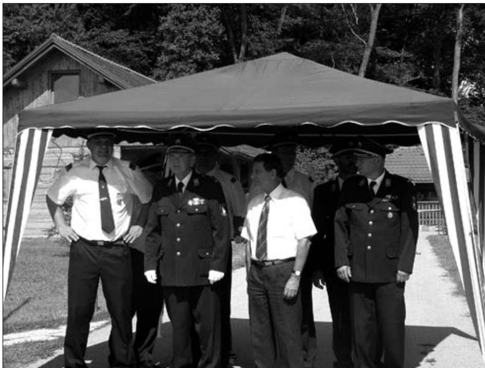
Gostje na osrednji slovesnosti ob 80-letnici društva

V letu 1981 je bil porušen del starega doma in na njegovem mestu zgrajen novi dom, ki so ga zaključili v letu 1982. Leta 1987 se je zamenjal avtomobil IMV 1600 za novi TAM 2000, za katerega so polovico sredstev prispevali vaščani. Zbiranje denarja ni bilo enostavno, vendar se je potrebno na tem mestu zahvaliti vsem vaščanom, predvsem tistim, ki so za avto darovali dogovorjeno vsoto. Leta 1989 so pionirji razvili svoj prapor. Leta 1990 je društvo nabavilo novo motorno brizgalno Ziegler. Leta 1999 smo nabavili in zamenjali TAM 2000 z novim vozilom Merce-