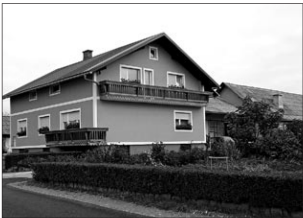
Kmetija Bezjak-Svržnjak Markovci

Člani Turističnega društva občine Markovci smo tudi letos izpeljali akcijo ocenjevanja okolja. Zaključna prireditev je potekala 2. septembra na dvorišču za zgradbo Občine Markovci.