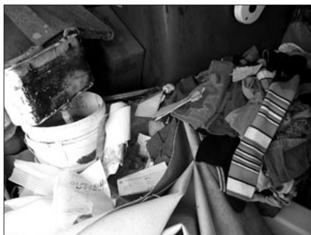
Takšni prizori pričajo o nevestnem ravnanju ljudi glede odlaganja odpadkov.

M. Murko: »Z javnim temeljitim osveščanjem občanov. Vsakdo izmed občanov ima v sebi zavest. Tisti, ki skrbi za svoje zdravje, ima tudi zdrav odnos do narave. Le tisti, ki pometa pred svojim pragom, s takšnim vzornim dejanjem varuje naravo in ohranja prijazno in čisto okolje in je ogledalo sosedu. Na terenu opažam, da imajo mnogi ljudje okolico svojih domov vzorno urejeno, malo proč (preko svoje meje) pa odmetavajo smeti,