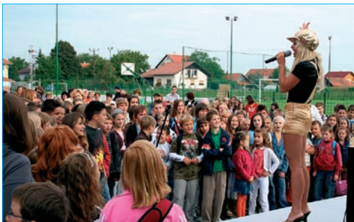
Na prvi šolski dan je učence OŠ Markovci zabavala skupina Skater.

O dogajanju tega dne naj spregovorijo še slike Mladi novinarji OŠ Markovci