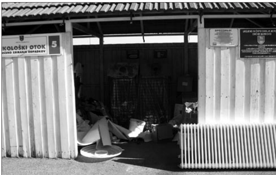
Odpadki tudi zunaj frakcije. Tovrstni odpadki na to mesto vsekakor ne sodijo.

M. Murko: »Ostanke iz umetnih mas (trda plastika), oslojen in plastificiran papir, kronski zamaški, ostanki kovinskih folij, ostanki stiropora, ohlajen pepel, odpadki iz tekstila, usnja, gume (ne avtomobilske), odpadki iz porcelana in keramike, plenice za enkratno uporabo, "hišne smeti" (ostanke komunalnih odpadkov). V posode za ostale odpadke je prepovedano odlagati: gradbeni material, kamenje, zemljo, vejevje, biološke odpadke, odpadke v večjih kosih (kosovne odpadke), odpadke v tekočem stanju, nevarne odpadke, pogin-