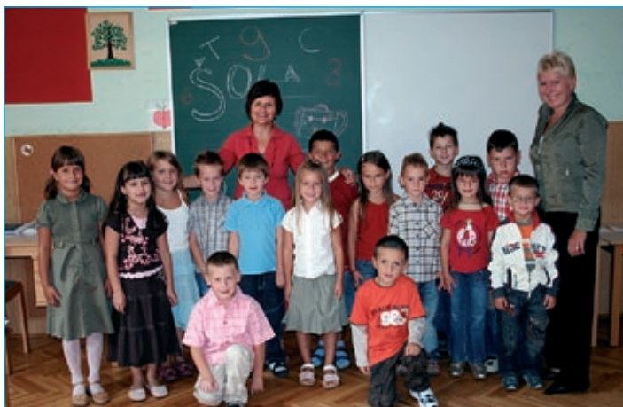
Najmlajši na OŠ Markovci - prvošolci