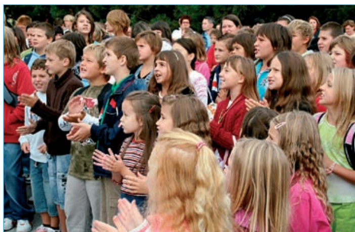
Zabave ni manjkalo.