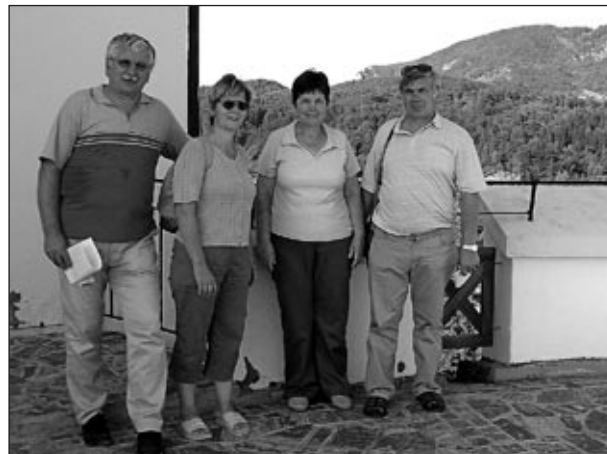
Sodelavci Karitasa župnije sv. Marko