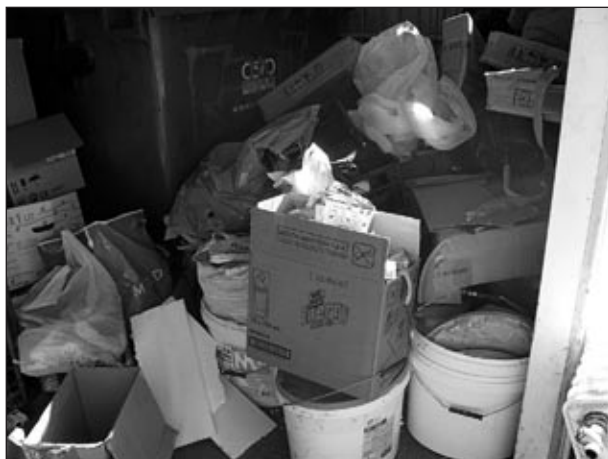
Ločeno zbiranje odpadkov?

Občina Markovci je bila med prvimi in je že pred leti vzorno uredila ekolo-