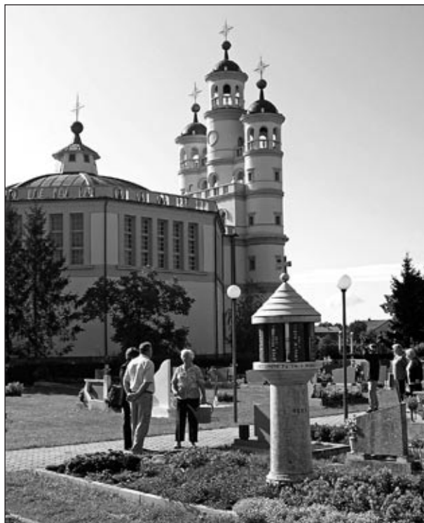
Spomenik žrtvam tragedije ob odranski cerkvi