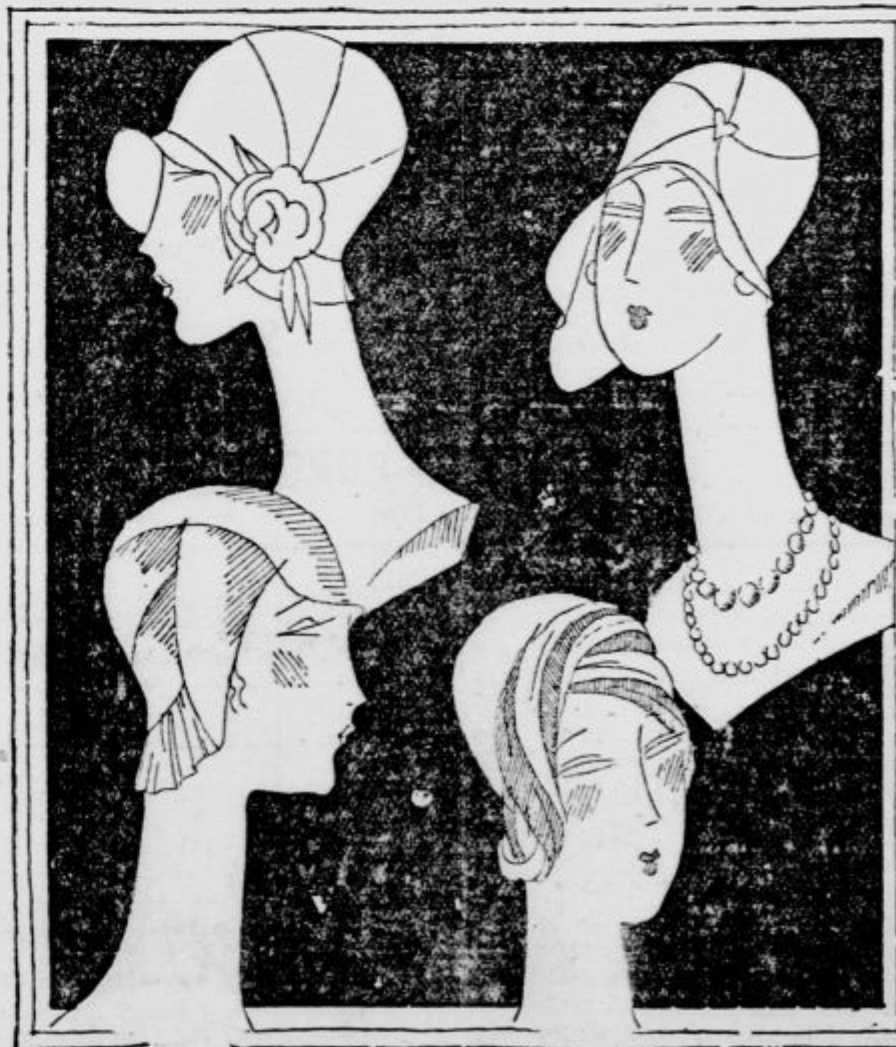
Štirje vzorci najnovjših klobukov