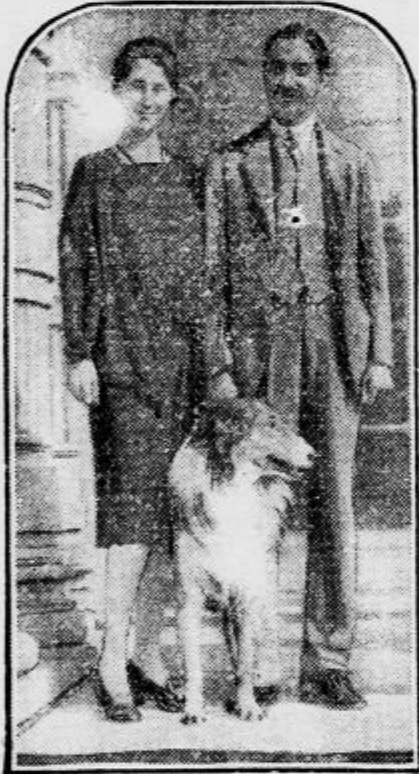
Indorski maharadža in njegova žena

V dvorcu Saint Germain blizu Pariza se je bivšemu indijskemu maharadži rodil potomec, radi katerega je nastal velik spor s francoskimi oblastmi. Maharadža se je bil pred časom ože-