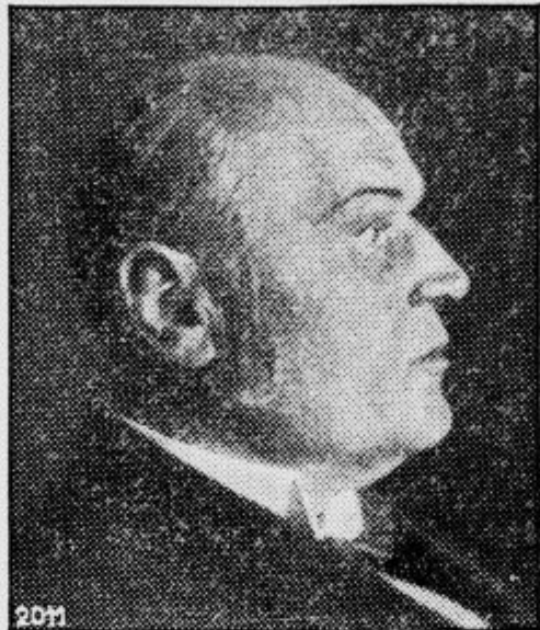
Dr. Antonín Švehla

Prične gniti šele okoli 8 dni po odtajanju. Pred popolno odjugo ga je olupiti in dati takoj v vodno kopel, drugače se osmudi, ker bi v stiku z zrakom nastopila oksidacija. Ta nedostatek velja zgolj za oči, saj prehrani prav nič ne škodi. Ako tako ravnaš z ozeblim krompirjem in ga skušaš, je docela užiten. Če bi to vedeli ljudje, bi se rešilo na tisoče stotov, ki jih dan na dan zmečejo med smeti.