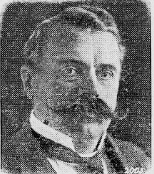
Novi čsl. ministrski predsednik Udržal

vodja čl. republikanske stranke, je odstopil z mesta praškega ministrskega predsednika.