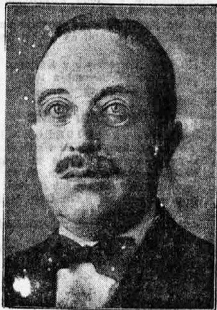
Francoski ministrski predsednik Tardieu.

Služba dvorjanek pa ni bila preveč naporna. Prostega časa so imele dovolj. Ker je bila kraljica določila, da opravlja dvorjanka na leto službo le en mesec, pa še takrat le vsak drugi dan. Na leto je bila torej dvorjanka komaj po 45 dni v službi, vse druge dni pa prosta.