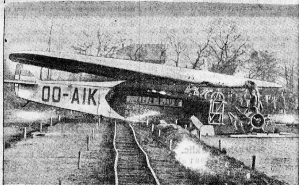
Ponesrečeno belgijsko letalo.

Na sliki vidimo aparat, ki ga je iznašel ameriški letalec Russell Cunningham. To je pokrivalo, ki se da zvezati s postajo za brezžične brezjavke. Pokrivalo se da s pritiskom na poseben gumb uravnati za oddajo ali pa za sprejem poročil.