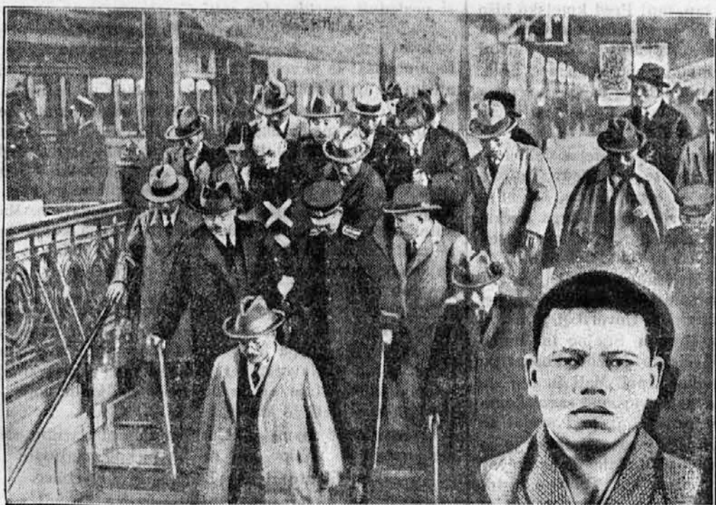
Napad na japonskega ministrskega predsednika Hamagučija.

V gosti megli je moralo neko belgijsko potniško letalo pristati v okolici Hamburga. Letalo se je sicer potrla, potnikom pa se ni pripetilo nič hudega.