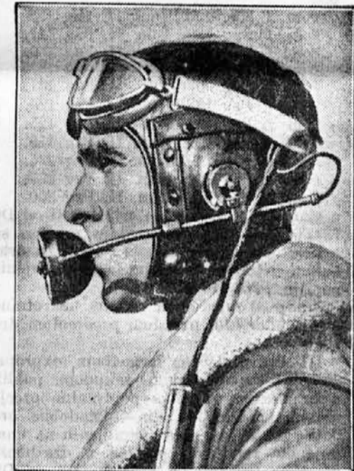
Radio-telefon za letalce.