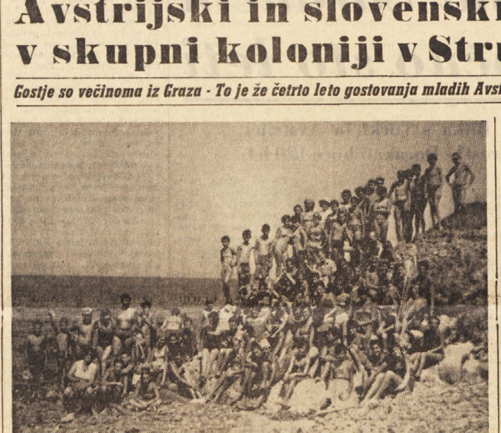
Skupina slovenskih in avstrijskih otrok v skupni koloniji v Strunjanju

Costje so večinoma iz Graza - To je že četrto leto gostovanja mladih Avstrijcev na istrski obali