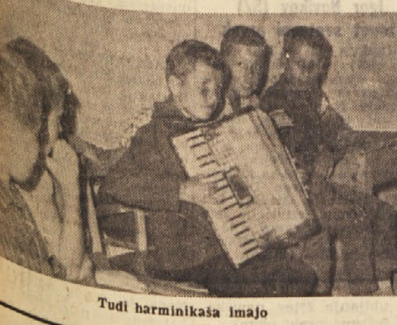
Tudi harminkaša imajo