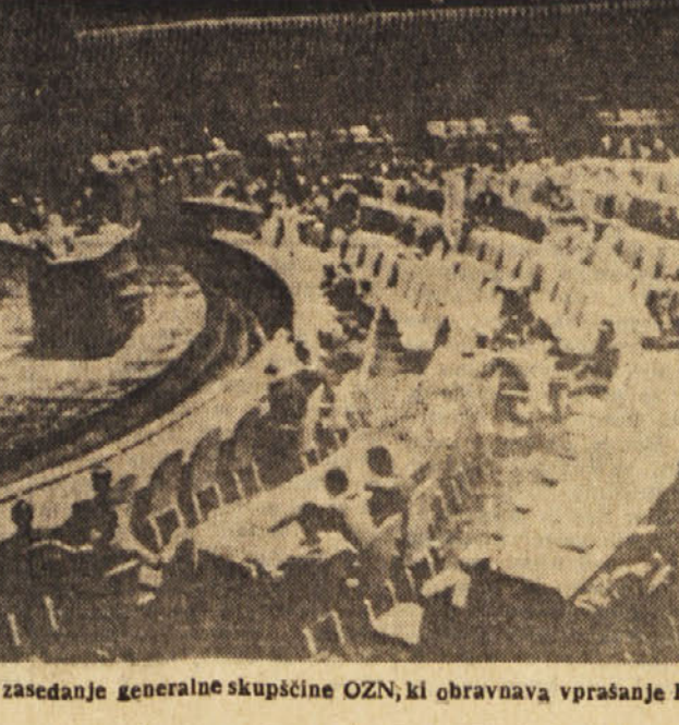
Pogled na sedanje izredno zasedanje generalne skupščine OZN, ki obravnava vprašanje Bizerte

aktivistov OAS in jih pridržali na raznih policijskih komisariatih, kjer preverjajo njihovi alibi. Policijske oblasti niso izdale nobenega uradnega sporočila, vendar se kaže, da pri preiskavah niso našli nič oziroma nič razstreliva. Danes je bila seja francoske vlade pod predsedstvom de Gaulle. Kratko sporočilo o tej seji javlja le, da so ministri poslušali poročilo zunanjega ministra Couve de Murville o mednarodnem položaju, zlasti pa o vprašanju Berlina in Bizerte. V resnici pa so se seji razpravljali tudi o drugih važnih vprašanjih, ne pa le o vprašanju rednega poslovanja, o katerem je govora v uradnem sporočilu. Prigotovo so razpravljali tudi o spremembah sedanje vlade, vendar pa je baje prevladovalo mnenje de Gaulle, ki nasprotuje vsakršnim spremembam v sedanjem položaju.