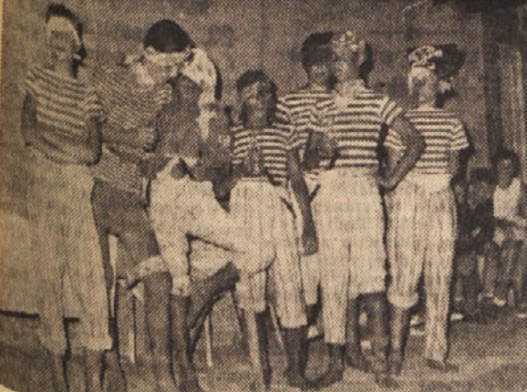
Slovenski in avstrijski egusarjia pojejo gusarsko pesem