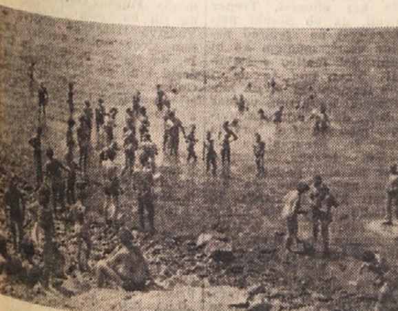
Najbolj je vsem všeč morje