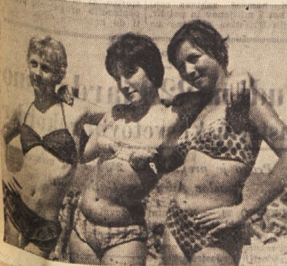
Sieti in njeni prijateljci Worli (ter Efi)