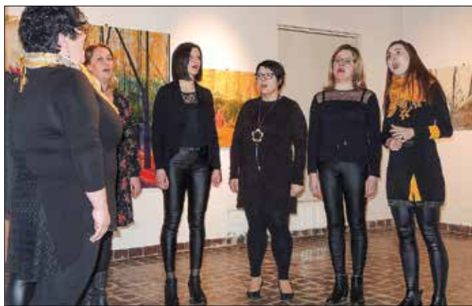
Vokalna skupina Viva la Bočna je poskrbela za glasbeno spremljavo.

DRUŠTVO RAČUNOVODIJ, FINANČNIKOV IN REVIZORJEV ZGORNJE SAVINJSKE DOLINE