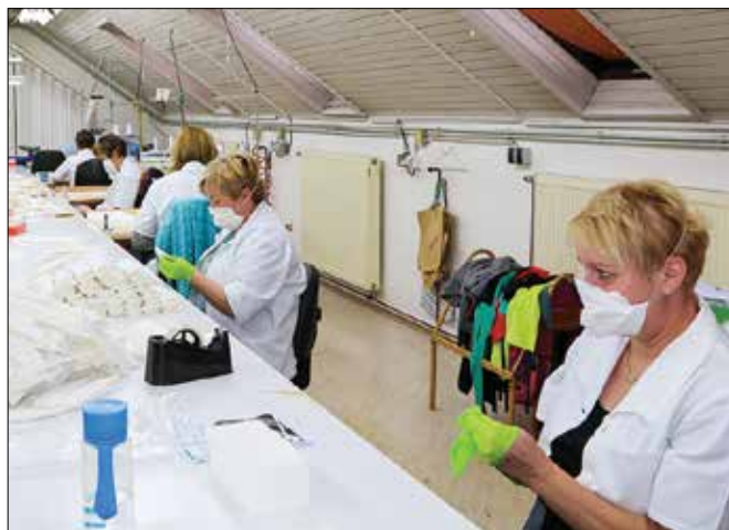
Pri Lukačevih izdelujejo zaščitne maske za enkratno uporabo za kupce v tujini in doma.

se je tega lotila na prigovarjanje strank ter zaradi trenutne situacije v državi. Kljub temu, da njeni izdelki niso za uporabo v zdravstvu, temveč za običajne ljudi, po nje-