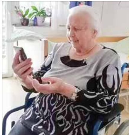
Stanovalci se lahko prek video klica pogovarjajo s sorodniki.

majo, smo omogočili, da se slišijo s svojci preko telefona. Telekom Slovenije nam je podaril v uporabo telefon, s katerim bomo lahko uporabnikom in svojcem omogočili, da se bodo videli preko video klica. Ker se zavedamo pomena socialnega stika, se zaposleni trudimo, da uporabnikom nudimo tudi psihosocialno pomoč.