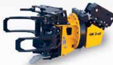
REZALNE KLEŠČE RK