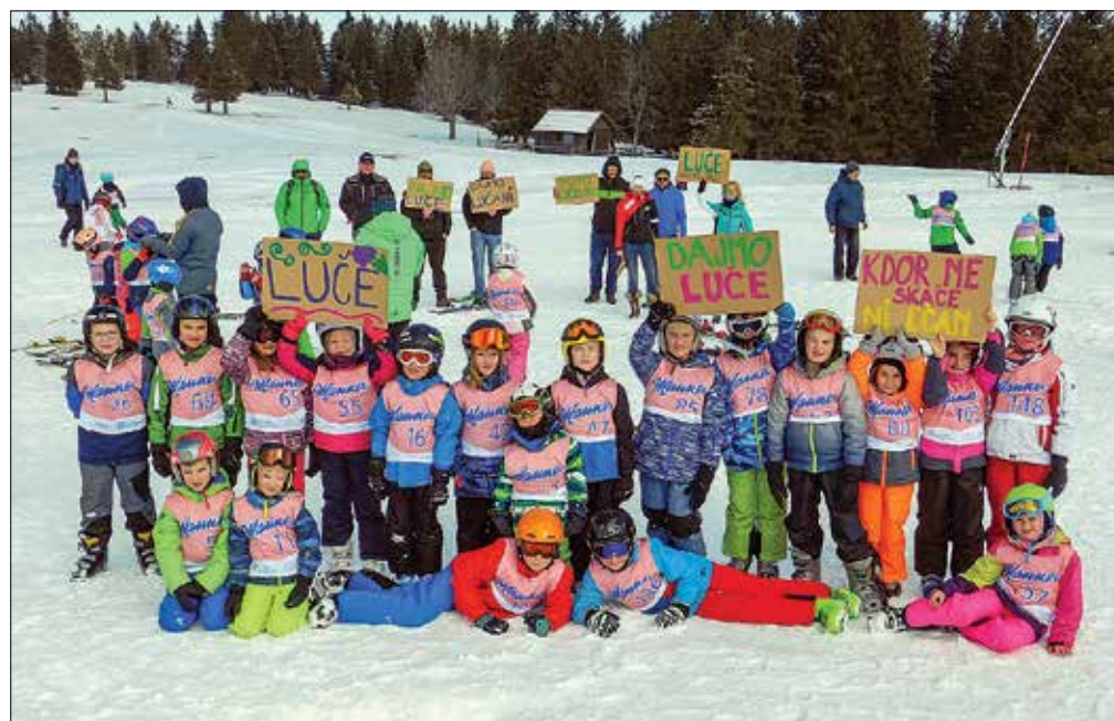
Ekipa, ki je branila barve lučke osnovne šole v smučarskih skokih.

Velja omeniti in pohvaliti tudi lučke navijače, mame, očete in dedke ter babice, ki so se v lepem številu zbrali ob skakalnici na Rog-