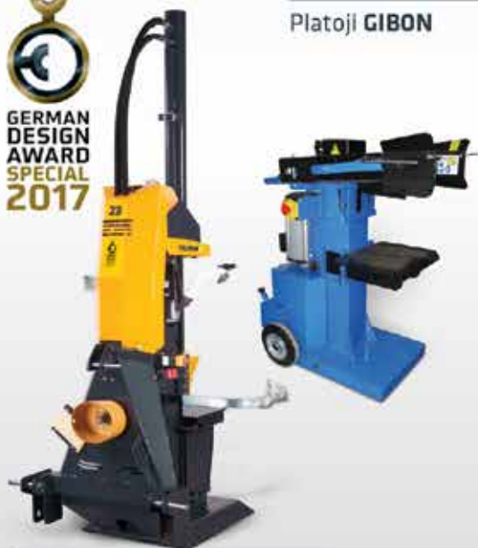
Cepilniki TITANIUM in ECO