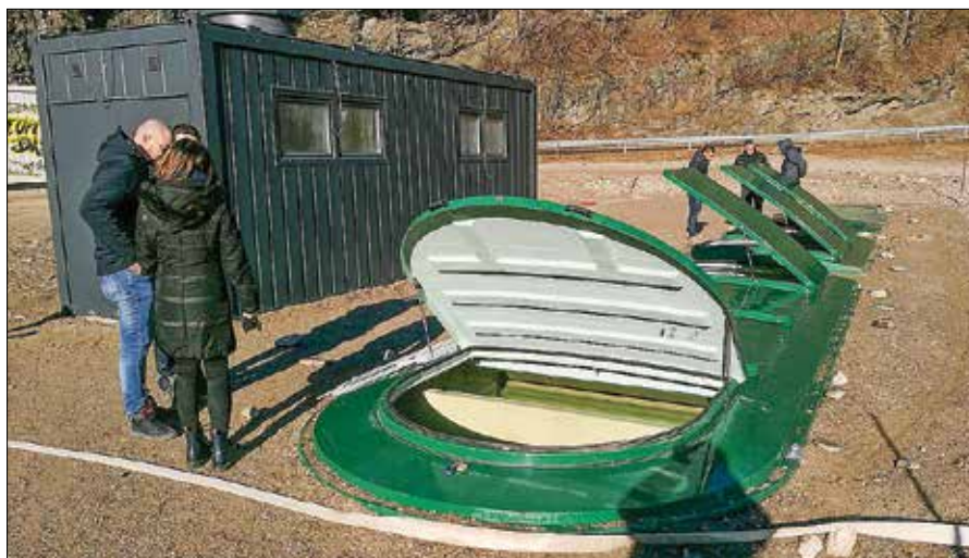
V novi čistilni napravi so začeli s poskusnim obratovanjem.

Sledi ureditev zunanosti samega kontejnerja, v katerem poteka čiščenje, in okolice čistilne naprave, da bo ta po videzu kar najbolj prijazna,