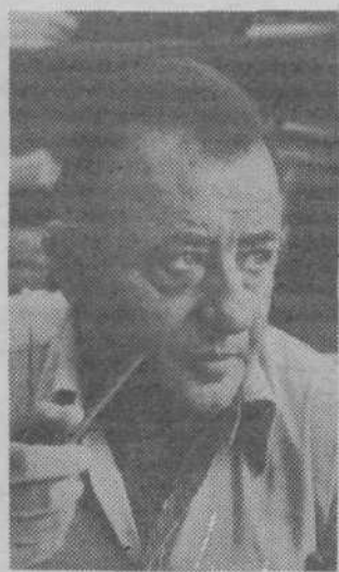
direktor DO Kemična tovarna Moste — Protektor.