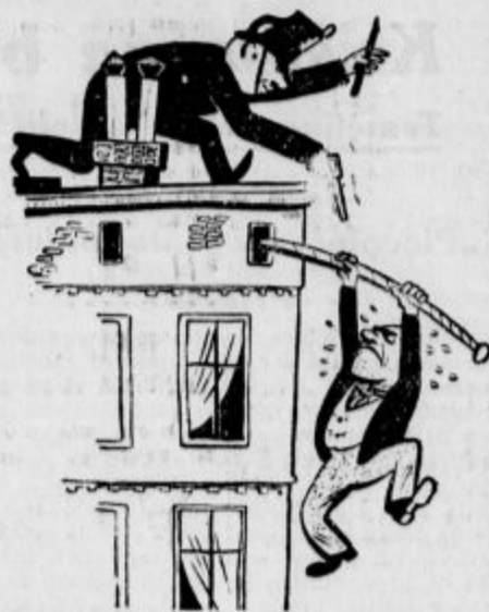
Stražnik vrh strehe vlomilcu: »Roki kviškute

Špecerlisko in kolonijalno blago, umetna gnojila, cementi itd. itd. dobavljajo Gospodarska zveza v Ljubljani