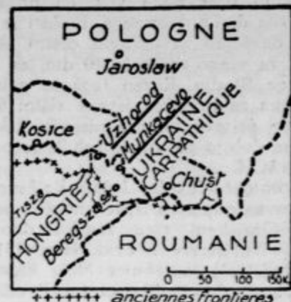
Zemljevid ozemlja, kjer je prišlo zadnje dni do nevarnega spopada med madžarskimi teroristi in obmejnimi stražami čsl. vojske

baje takoj spoznale, njegova sijajna obleka pa je napravila nanje tako velik vtis, da so se mu globoko klanjale. Pravijo, da so jih te poklonov, neke vrste dvornih poklonov, naučili v zvezi z bližnjim obiskom angleške kraljeve dvojice v Ameriki. Vide ti je torej, da bo Kanada britskim suverenom ob tej priliki pokazala tudi svoje petorčice, ki baje niso petorčice.