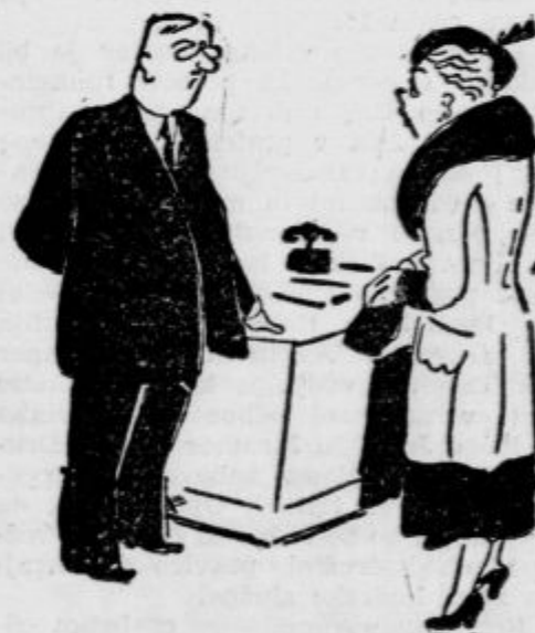
Zdravnik: »Kako morete vendar trditi, da je moj zahtevek previsok?«

Mati: »Tega ne trdim samo pravim, da bi bil z ozirom na to, da se je od mojega sina nalezal skrlatinke ves razred, zdravniški račun lahko manjši!«