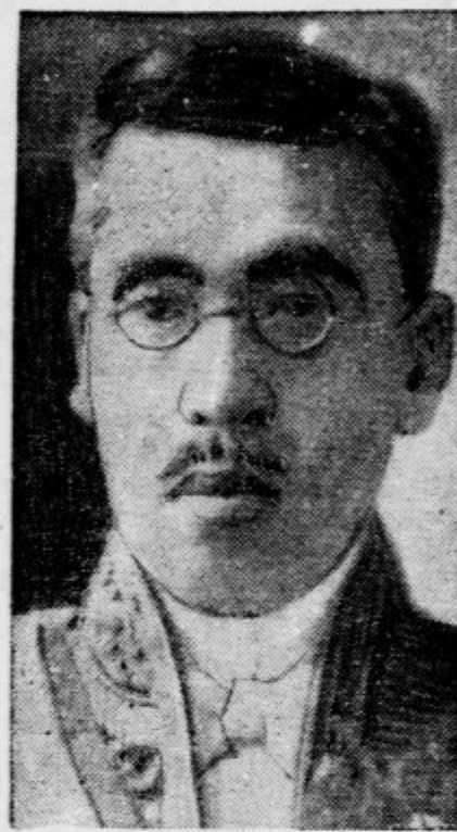
Baron Kiširo Hiranuma je zamenjal odstojnega princa Konojo