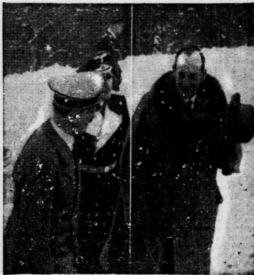
Poljski zunanji minister Beck je proti koncu minulega tedna obiskal nemškega kancelarja Hitlerja v Berchtesgadenu, kjer je bilo prijateljstvo med Nemčijo in Poljsko vnovič potrjeno