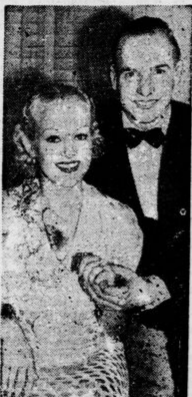
Jackie Coogan in Betty Grable sta se ločila od zakonske postelje in mize, baje zaradi denarnih vzrokov. Bettyna mati je objavila v listih izjavo, da se imata še vedno tako rada kakor poprej

ko frak kakor telovnik predolga in globoko izrez telovnika je poudarjal predsednikovo mršavost. Nosti bi moral višji telovnik, ki bi dajal njegovim ramenom več širine. Končno je imel telovnik pet gumbov, med tem ko mora imeti normalni telovnik k fraku samo tri gumba ali pa kvečjemu štiri, če je postava zelo visoka. In tako se je Chamberlain tistim, ki spoštujejo modne predpise, smrtno zameril posebno zavoljo enega ali dveh gumbov preveč.