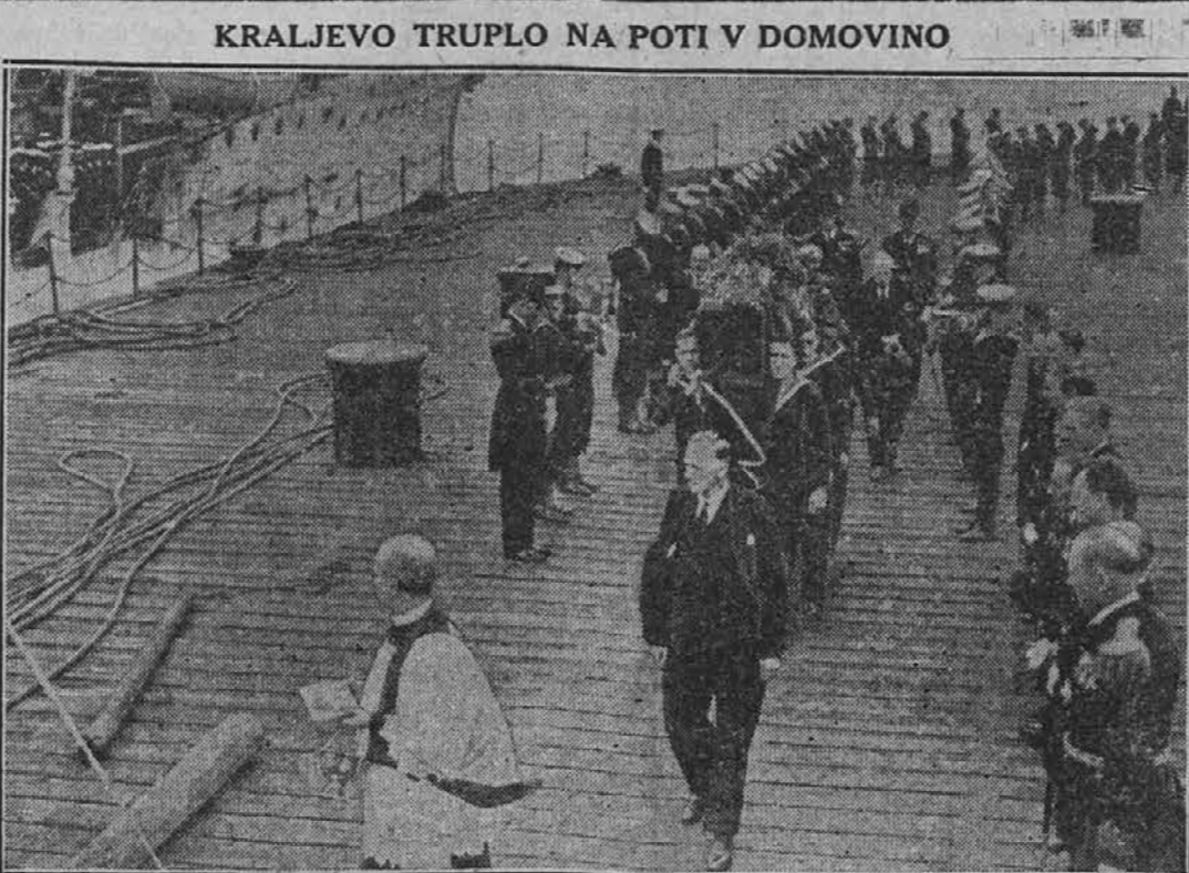
KRALJEVO TRUPLJO NA POTI V DOMOVINO