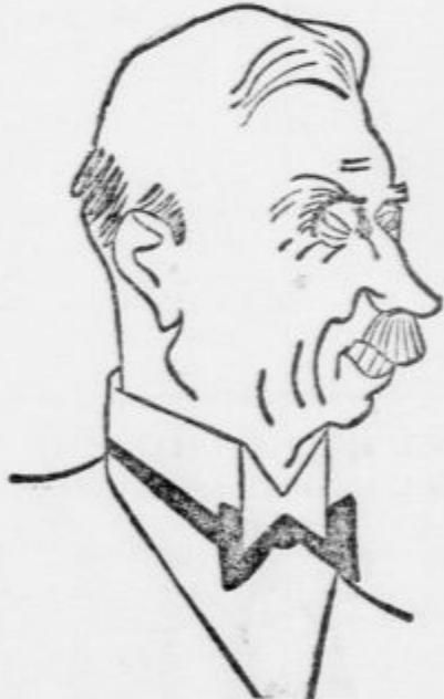
Nemški poslanik von Papan je vzel slovo od Dunaja. Drž. kancelar Hitler mu namerava poveriti drugo misljo