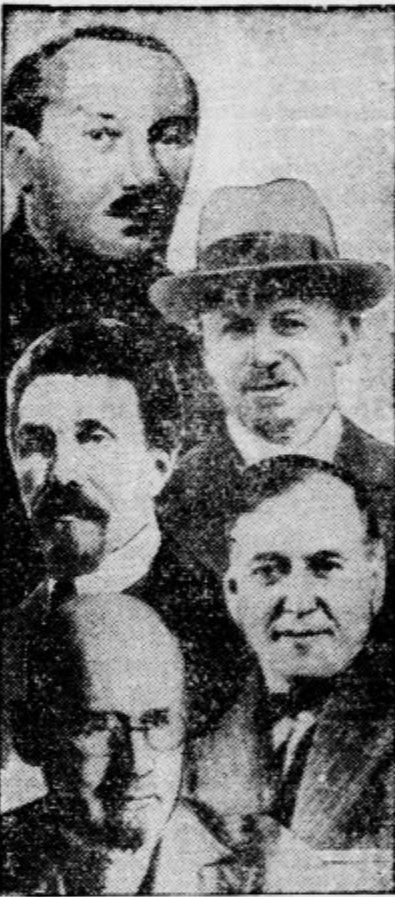
Petorica obtožencev iz sedanjega moskovskega procesa. Od zgoraj navzdol: Jagoda, Buharin, Rikov, Rakovski, Krestinski