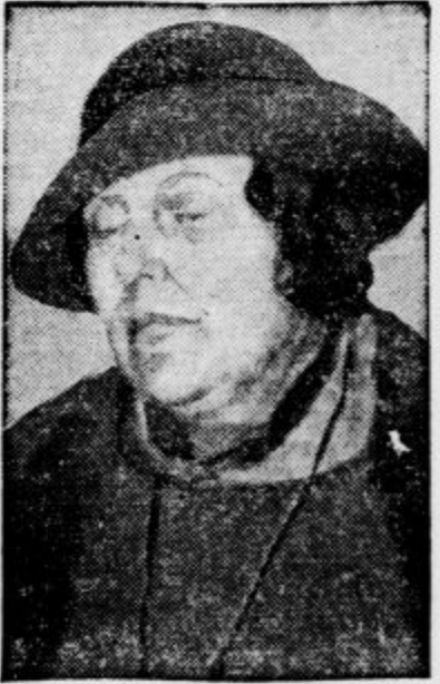
In njegova žena, pevka Skoblinova. Prvi je dal navodila za ugrabitev generala Millerja po sovjetskih agentih v Parizu in je potem zbežal iz Francije. Njegova žena je šele te dni priznala, da je bila poučena o vohunskih tajnah svojega moža