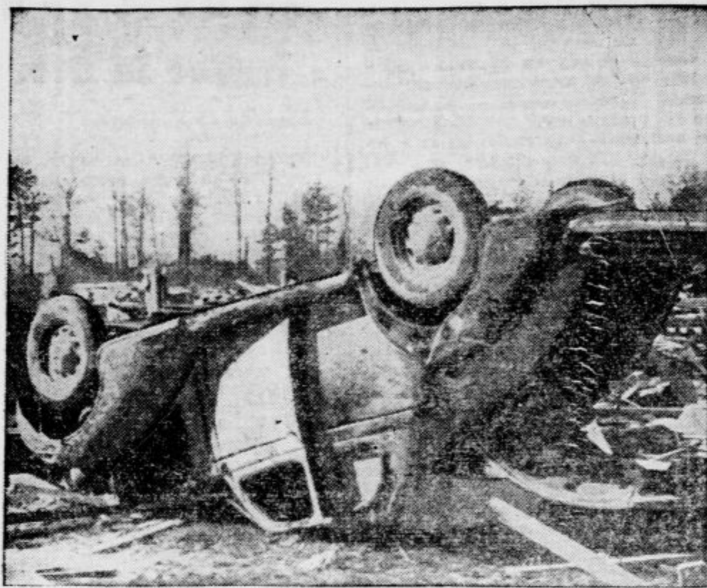
V ameriški Luiziani je nedavno divjal tornado, ki je odkrival hiše in prevračal avtomobile (slika)