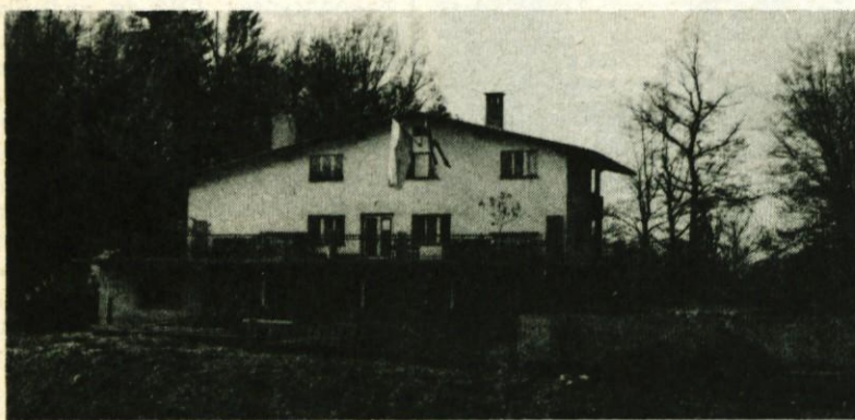
Jamarski dom na Gorjuši