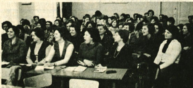
Med polletnimi počitnicami so se prosvetni delavci strokovno usposabljali za delo v šolah. Na sliki vidimo učitelje glasbenega pouka, ki skrbijo za glasbeno vzgojo v naših osnovnih šolah in vodijo posamezne pionirske in mladinske pevske zборе