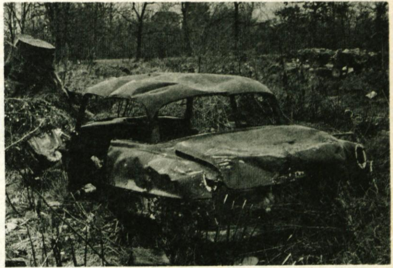
Ne tako redek pojav iz naše narave

nanaša na ta problem, saj bi s tem neposredno sodelovali pri naši akciji, s katero želimo doseči tudi spoštovanje odlokov, ki smo jih sprejeli. Pisali bomo o „divjih“ odlagališčih, onesnaženih cestah, rekah, potokih, o zraku, ki ga vdihava