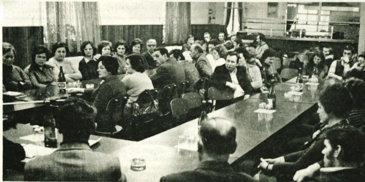
V delovnih organizacijah potekajo predavanja o samoupravni organiziranosti, dohodkovnih odnosih in pomenu družbene samozaščite. Na sliki vidimo udeležence predavanja v delovni organizaciji Univerzale

— da partija ne sme biti revolucionarna sekta, ki bi čakala v ilegali, ampak politično gibalna sila napredne