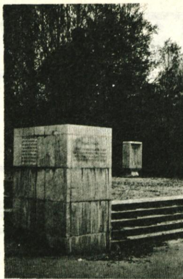
Spomenik revolucije na Trgu svobode v Moravčah

zgodovinskih člankov in fotografij bili objavljeni tudi spomini organizatorjev shoda na Taboru in predvojnih članov komunistične partije iz naše občine;