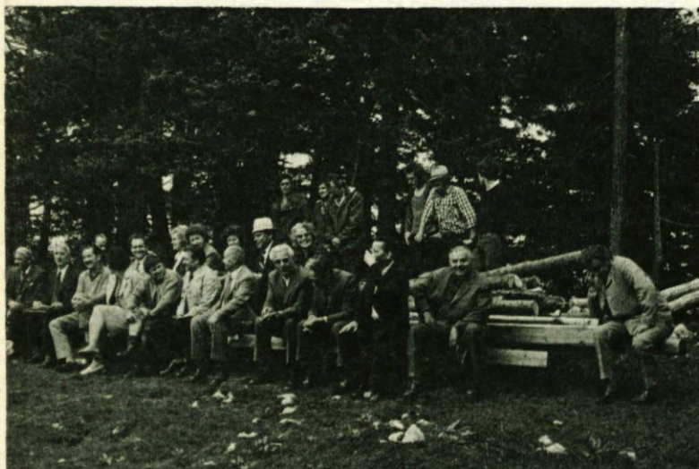
S skupnega sestanka radioamaterjev Domžal, Radomelj, Moravč in Republiškega odbora vezistov NOB na Menini planini

Pri Mercatorju v Domžalah, Koldvorska ulica, lahko dobite ovsen kruh za diabetike oziroma za sladkorno bolne.