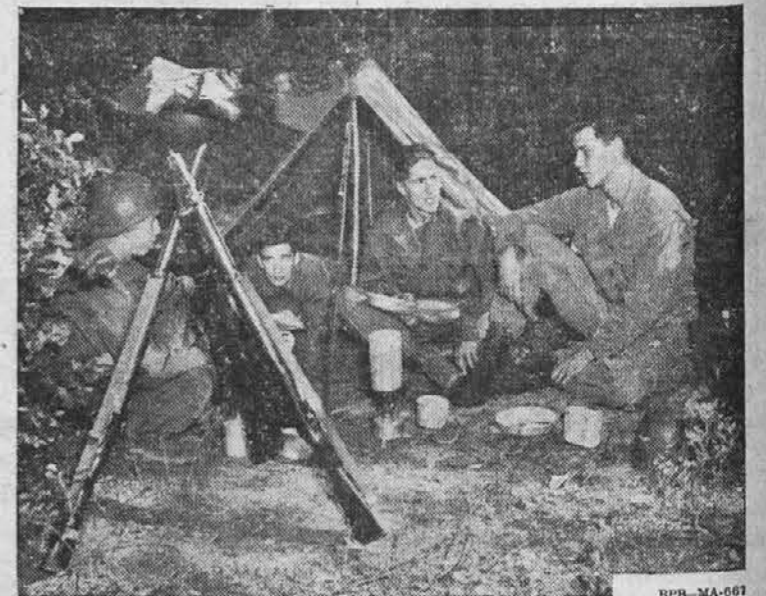
These four basic trainees of an Infantry division are enjoying "camping out" and cooking their own meals during field maneuvers which help to qualify them as well-trained soldiers. Four topnotch Infantry divisions in the United States now have welcome spots for veterans who choose to reenlist and for young men just starting their U. S. Army careers.