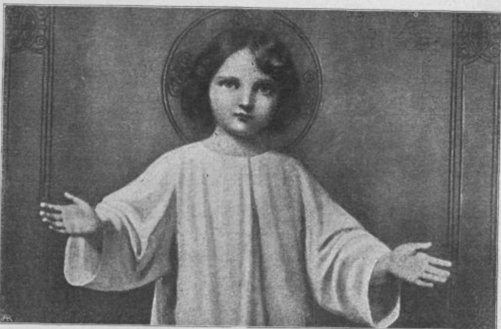
Kdor sprejme katerega teh malih, mene sprejme.

V Ljubljani imamo še dve zavetišči, oziroma tri. V vseh že primanjkuje pro-