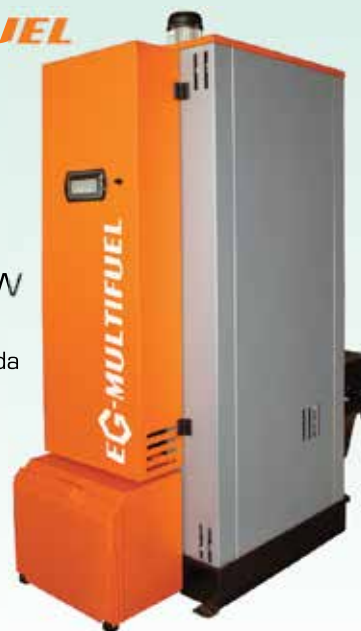
Vse cene so brez DDV.