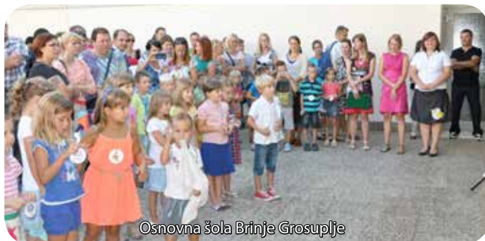
Osnovna šola Brinje Grosuplje