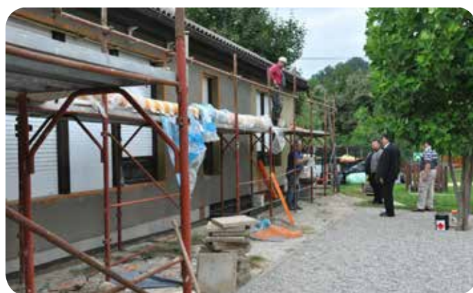
Energetska sanacija vrtca Pika v Šmarju – Sapu.