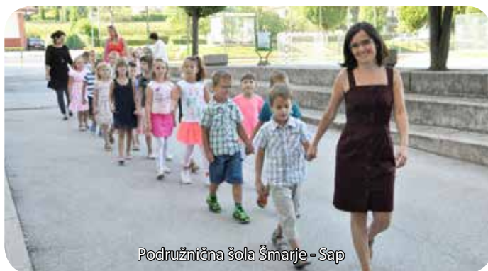
Podružnična šola Šmarje - Sap