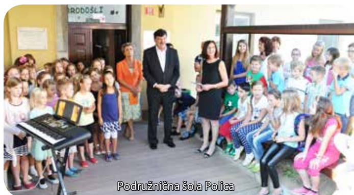
Podružnična šola Polica