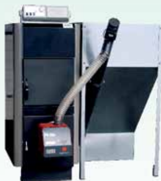
peč na pelete 25 kW KOMBU 25p