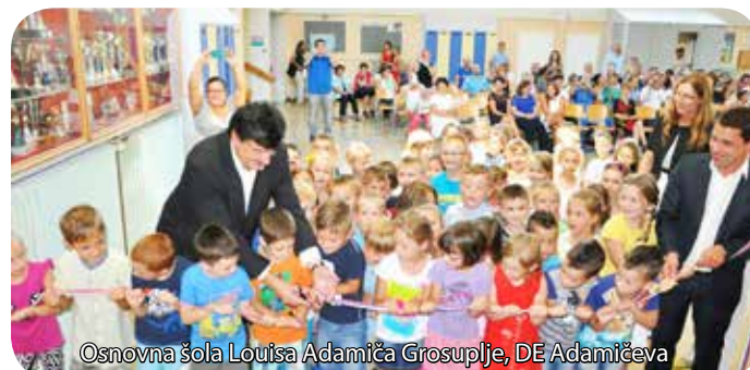
Osnovna šola Louisa Adamiča Grosuplje, DE Adamičeva