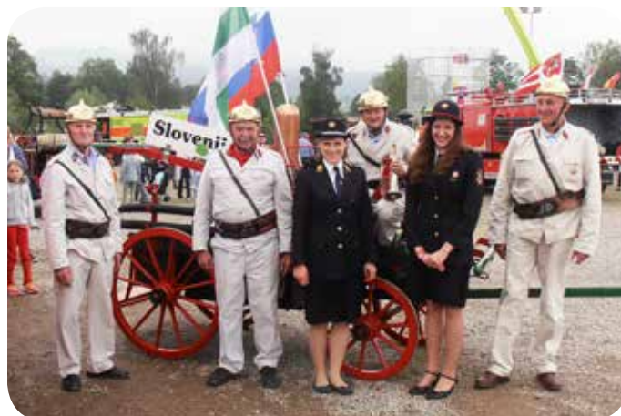
Na razstavnem prostoru starodobnikov, na dan parade.