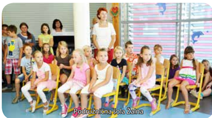
Podružnična šola Žalna