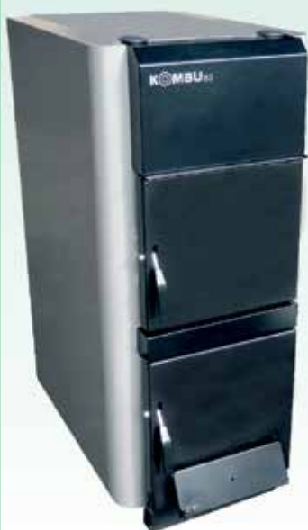
peč na drva 30 kW KOMBU 30

ugoden nakup z novimi subvencijami Eko sklada