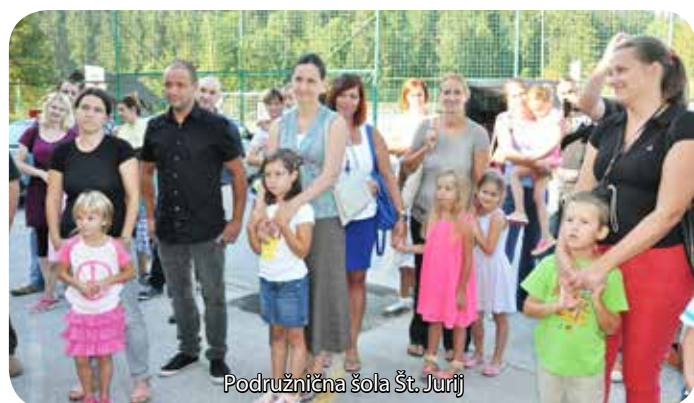
Podružnična šola Št. Jurij