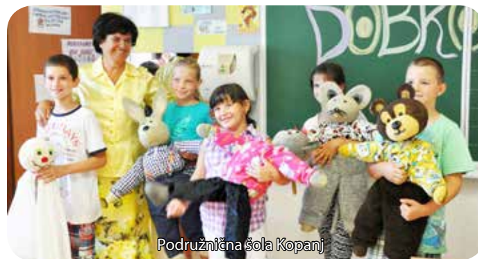
Podružnična šola Kopanj