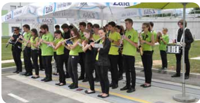
Pričetek prireditve je z zaigrano slovensko in evropsko himno naznanil Pihalni orkester Glasbene šole Grosuplje, pod mentorstvom Mitje Dragoliča.

Evropska unija je od svoje ustanovitve leta 1950 veliko dosegla. Vzpostavila je enotni trg za blago in storitve, ki zajema 28 držav članic s 500 milijoni državljanov, ki se lahko prosto gibljejo in živijo, kjer želijo. Uvedla je enotno valuto – evro, ki je zdaj ena najmočnejših svetovnih valut in zaradi katere je enotni trg učinkovitejši. Poleg tega prispeva največji delež programov razvojne in humanitarne pomoči na svetu ter ima vodilno vlogo na področju boja proti podnebnim spremembam in njihovim posledicam. Evropska unija ima tudi ene najvišjih okoljskih standardov na svetu.