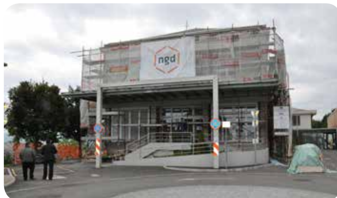
Energetska sanacija starega dela Zdravstvenega doma Grosuplje.