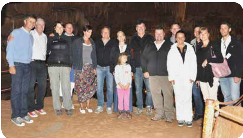
V Županovi jami je nastala skupinska fotografija.