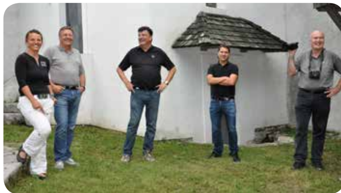
Na ogledu Tabora Cerovo...

Namen obiska je sicer bil, da bi naše turistične znamenitosti vključili v turistično ponudbo Ljubljane. Našo prestolnico vsako leto obiše lepo število turistov, v letu 2014 so po ocenah Turizma Ljubljana v Ljubljani zabeležili preko milijon nočitev. Poleg lepega in bogatega utripa mesta, ki ga zagotovo začutijo obiskovalci ob obisku naše prestolnice, domači in tuji gostje prav gotovo ne bi ostali ravnodušni tudi ob obisku bližnje kraške lepote, v neposredni bližini katere se nahaja še protiturški tabor, prav tako vreden ogleda.