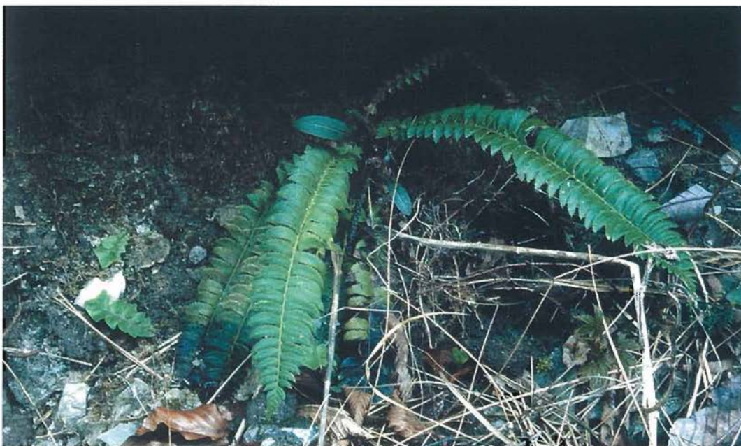
Slika 4: Najnižje nahajališče kopjaste podlesnice Polystichum lonchitis - subarktično-subalpske vrste na Kočevskem

samosvojem, mozaično pisanem rastlinstvu in rastju sotesk obeh potokov. Pri njihovem opisu se bomo osredotočili predvsem na najbolj zanimivo rastlinstvo in rastje.