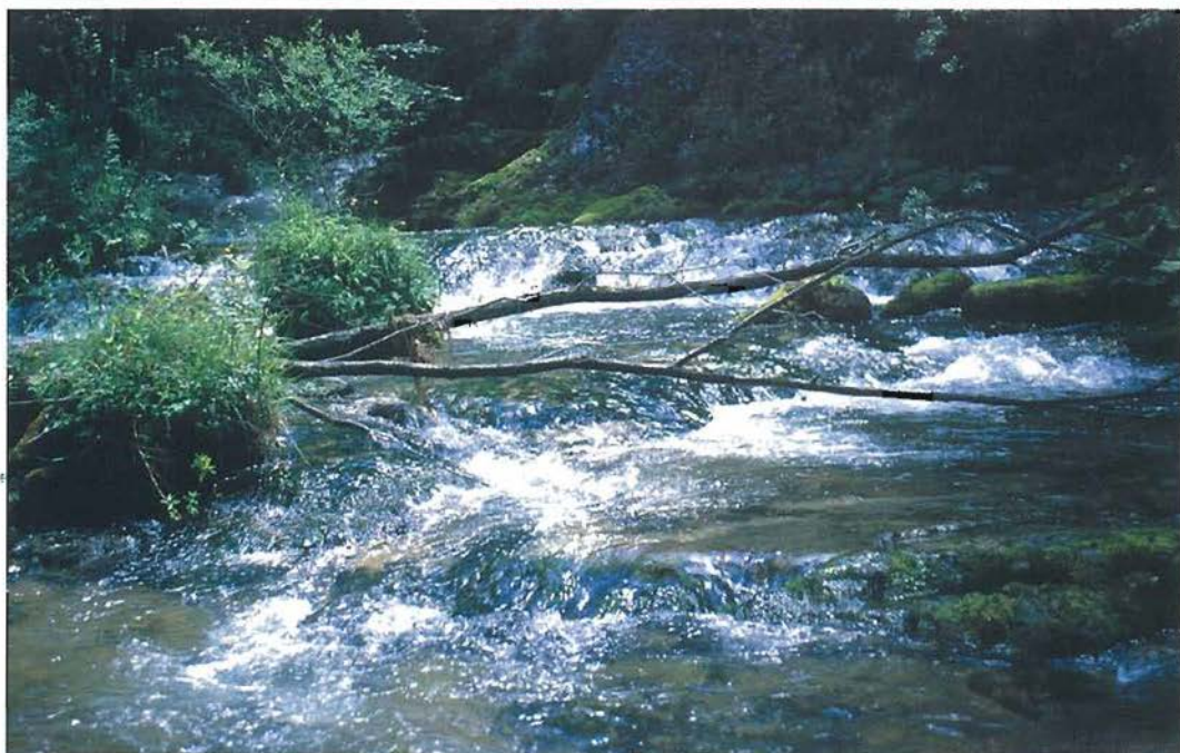
Slika 1: Potok Potok zgodaj spomladi. Fig. 1: The Brook Potok early in spring

je padec tolikšen, da so poganjale vode Potoka v preteklosti kar tri mlina, dva v kombinaciji z žagama.