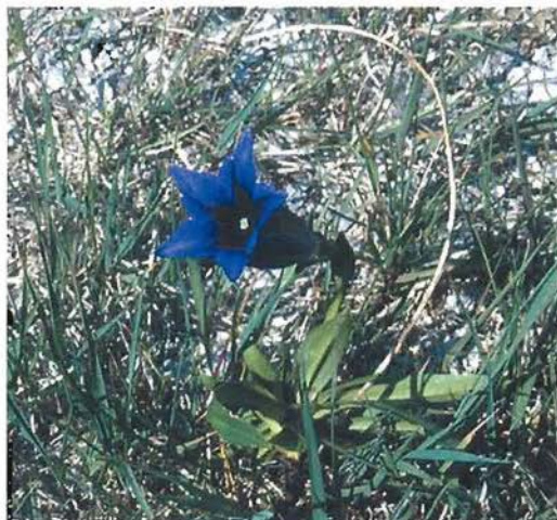
Slika 2: Najnižje nahajališče Clusijevega svišča Gentiana clusii - alpske vrste na Kočevskem Fig. 2: The lowest locality of the alpine species Gentiana clusii in the Kočevsko area

Raziskovano območje uvrščajo v belokranjski distrikt preddinarskega fitogeografskega območja (ZUPANČIČ et al. 1989) in leži v celoti v kvadrantu