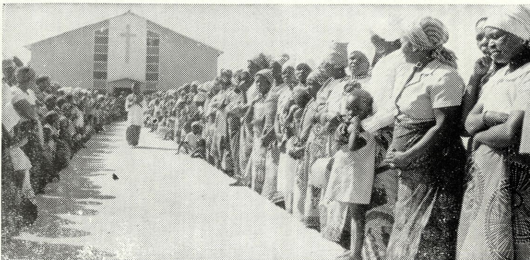
Verniki ob cerkvi sv. Kizita pričakujejo nadškofa

“Tu sem že od letošnjega maja. Prispela sem iz Vietnama. Vrata za Indijo, kamor sem bila namenjena, so se mi zaenkrat zaprla. Ker tudi nekatere dežele v Afriki postajajo teže dostopne za tujce, mi je kongregacija dala dovoljenje, da se pozanimam pri vas glede možnosti dela v Zambiji. Delala sem anesteziologijo dvanajst let.