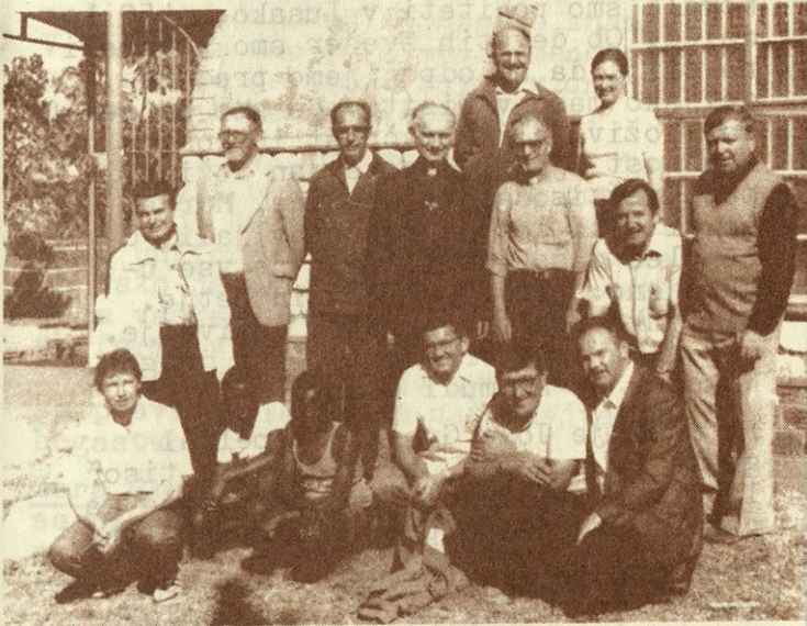
Misijonarji z gosti pred Marijino kapelico v Chelstonu.