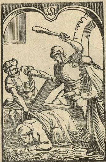
Jezus pade prvokrat pod križem.