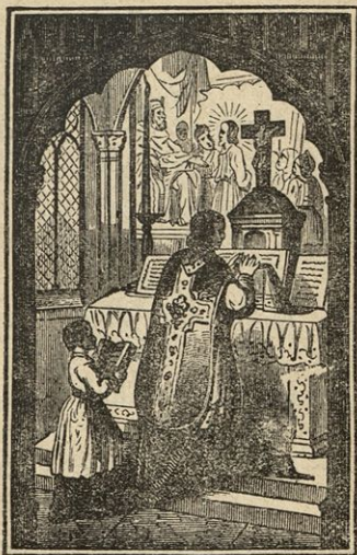
Mašnik bere evangelij; Jezusa peljejo k Pilatu.