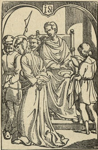
Jezusa Pilat v smrt obsodi.