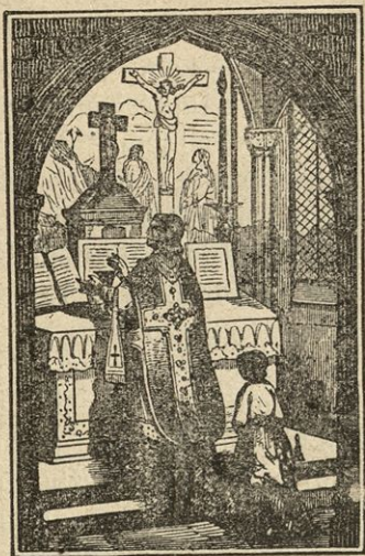
Mašnik se na persi udari.