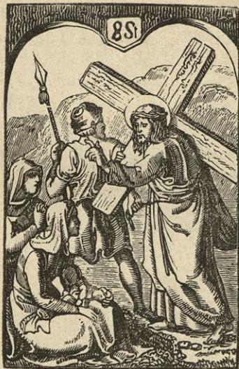
Jezus toláži Jeruzalemske žene.