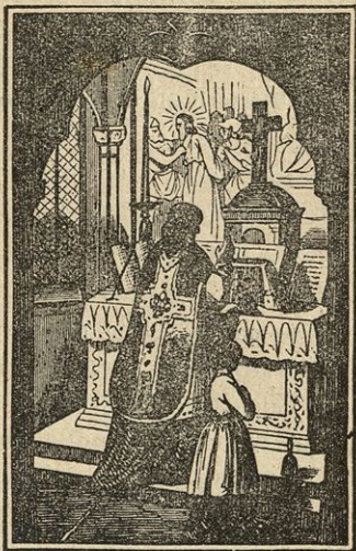
Mašnik kruh daruje; Jezusa tepežijo.