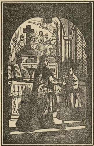
Mašnik si prste umiva.