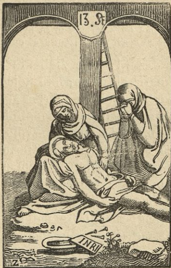
Jezusa s križa snamejo in Mariji v naročje denejo.