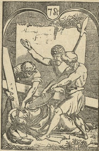
Jezus pade drugič pod križem.