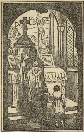
Mašnik povzdigne Kristusovo kri.