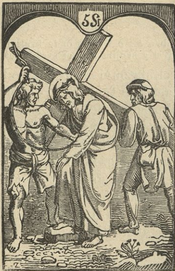
Simon Cirenejec pomaga Jezusu križ nesti.