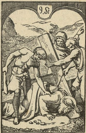
Jezus pade tretjič pod križem.