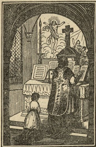
Mašnik stopi na desno stran.