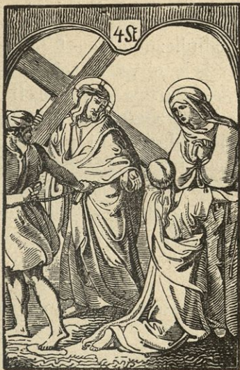
Jezus sreča svojo žalostno mater.