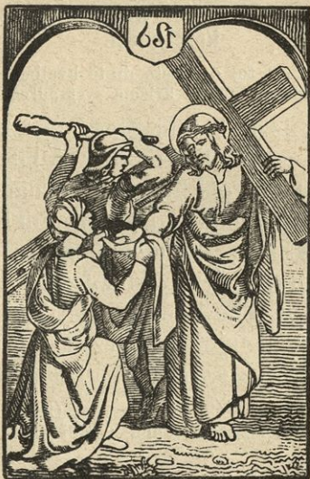
Veronika podá Jezusu potni prt.