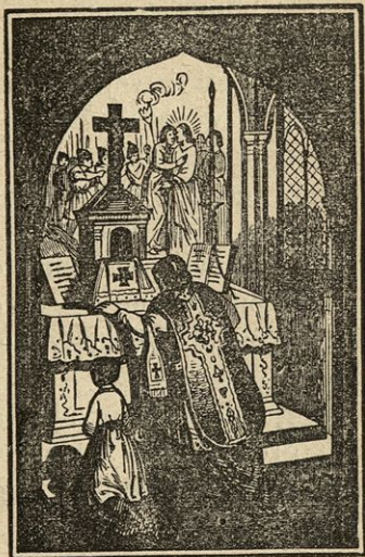
Mašnik altar kušne ; Judež Jezusa izdá.