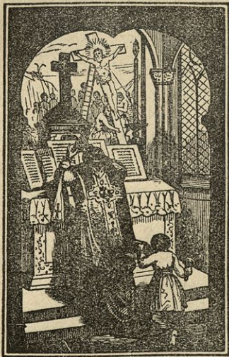
Mašnik povzdigne Kristusovo telo.