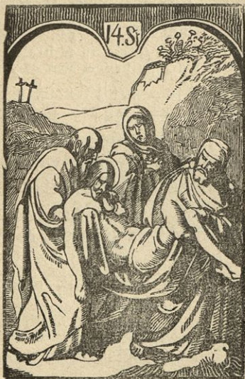
Jezusa v grob polože.