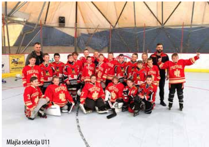
Mlajša selekcija U11