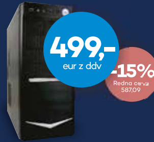
DOMAČI RAČUNALNIK ANNI HOME OPTIMAL

15,6" Intel Core i7-8550U 8 GB 256 GB GeForce GTX 1050 Windows 10 Home 64