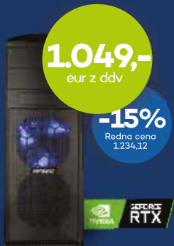
GAMING RAČUNALNIK ANNI GAMER EXTREME

Intel Core i7-8700 8 GB 512 GB GeForce RTX 2060