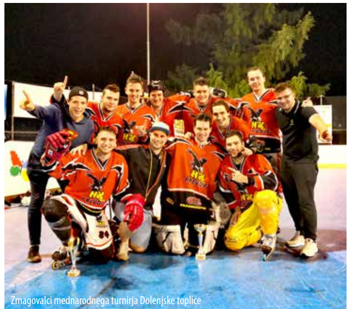
Zmagovalci mednarodnega turnirja Dolenjske toplice

Tako je. Po desetih intenzivnih mesecih in 18 odigranih kolih smo svoje nastope v rednem delu 1. lige in-line hokeja zaključili na odličnem 2. mestu ter v izločilnih bojih končnice zasedli končno 3. mesto v državi.