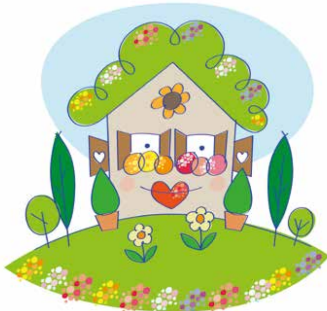
ILUSTRACIJA: ROMAN PEKLAJ

Naslednja številka Rokovnjača bo izšla 29. avgusta 2019; rok za oddajo član- kov je 20. avgust 2019 do 12. ure. Članki, ki bodo poslani po tem roku, v aktualni številki ne bodo objavljeni. Svoje članke, dolge največ 1500 znakov s presledki, pošljite po e-pošti na naslov: rokovnjac@lukovica.si. Sprejemamo le prispevke v elektronski (word, PDF) obliki. Več informacij na telefonski številki uredništva: 051 365 992.