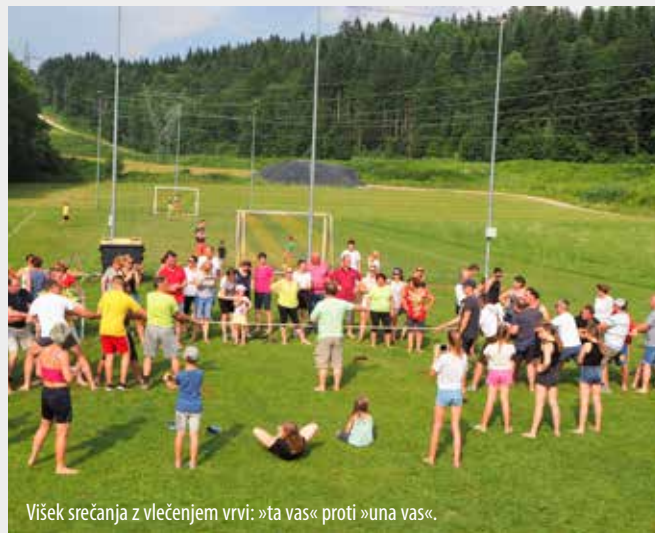
Višek srečanja z vlečenjem vrvi: »ta vas« proti »una vas«.

V nedeljo, 16. junija 2019, od 12. ure dalje so se krajan KS Rafoľe zbirali na 6. vaškem srečanju na igrišču ob brunarici v Rafoľah, kjer so prizadrevni člani ŠTD Rafoľe postavili šotore in vse potrebno za srečanje, ki ni bilo namenjeno samo članom društva, ampak vsem sedanjim in nekdanjim ter novim prebivalcem KS Rafoľe, torej vaščanom Rafoľ, Vrhovelj, Straže in Dupelj.