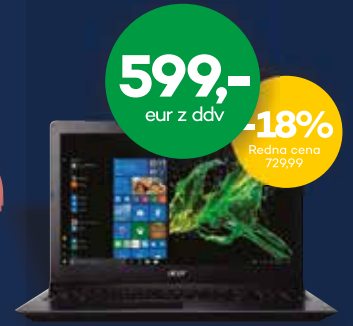
DOMAČI PRENOSNIK ACER A315-41-R7DX

Intel Core i3-8100 4 GB 256 GB Intel UHD 630 Windows 10 Home