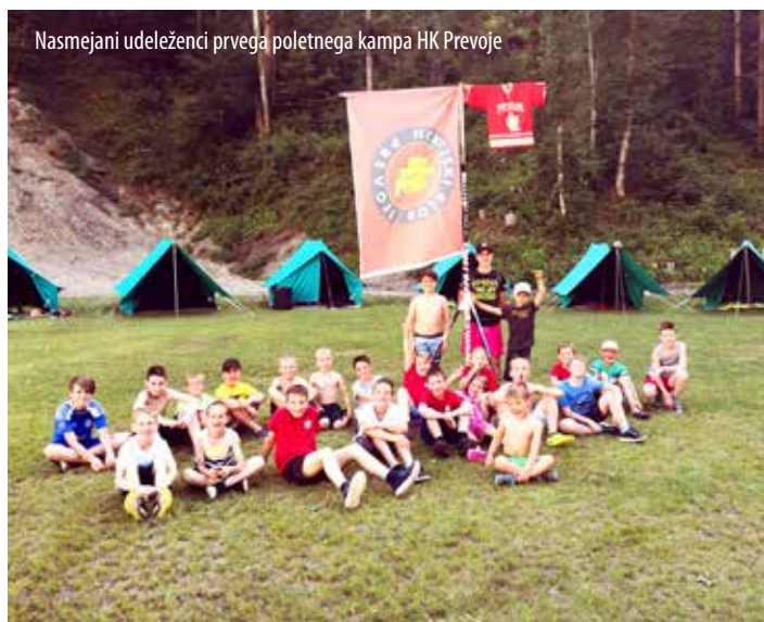
Nasmejani udeleženci prvega poletnega kampa HK Prevoje