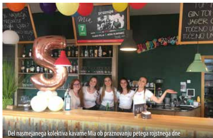
Del nasmejanega kolektiva kavarne Mia ob praznovanju petega rojstnega dne