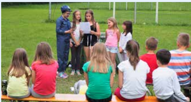
Otroci in starši so se veselo zabavali pri predstavi.