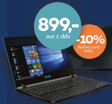
GAMING PRENOSNIK ASUS X560UD-EJ153T

Intel Core i7-8700 8 GB 512 GB GeForce RTX 2060