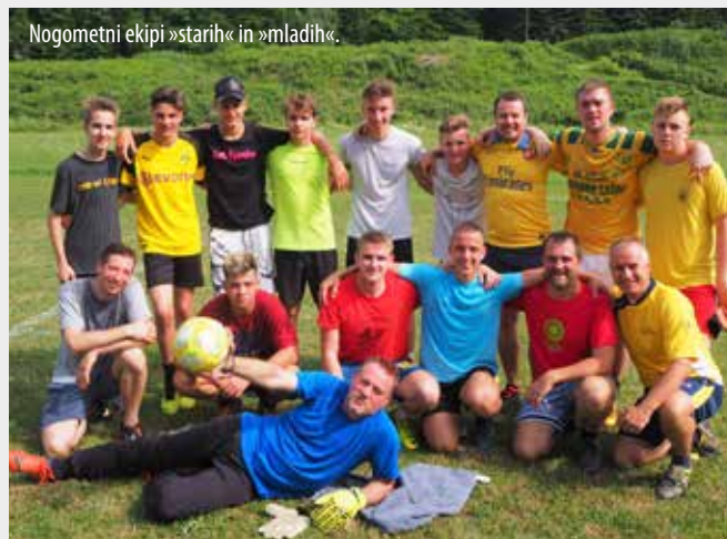
Nogometni ekipi »starih« in »mladih«.