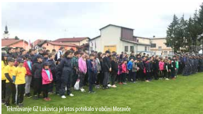
Tekmovanje GZ Lukovica je letos potekalo v občini Moravče