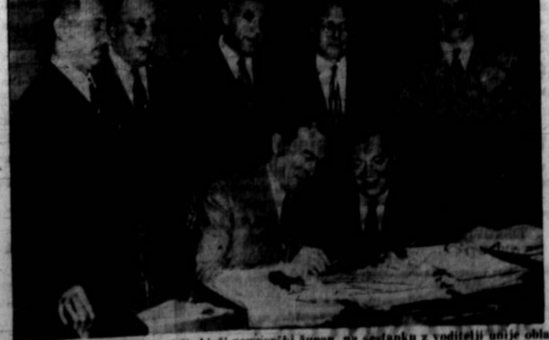
James J. Walker (levo pri mizi), bivši newyorški župan, na sestanku z voditelji unije običajnih delavcev in delodajalcev. Poleg njega je David Dubinsky, predsednik unije International Ladies Garment Workers. Župan La Guardia je imenoval Walkera za načelnika odbora, ki posreduje v sporih med unijo in organizacijo delodajalcev.

Neke dekle je rodilo in svoje nezakonskega otroka zadušila Drugo dekle je rodilo in svoje nezakonskega otroka pustila stati nekje v gozdu ali ob potu. Pred dnevi smo čitali v časopisu, starši so do smrti pretepelega petnajstletno hčerko, ki je bila noseča. To se je zgodilo v Prekmurju, lahko pa bi zgodilo tudi kje drugje. Takih zgodb je brez števila. Človek, ki jih čita, se nehoti vprašati, ali so ljudje res tako podivjali, da zločin enega najostudnejših zločinov, ki ga more človek zagrešiti, da ubije svojega lastnega otroka, ali ga, brezbrabnega in nepomočnega, pusti nekje na cesti. In vendar postanejo taka dejanja razumljivejša, če si jih malo bolj pogledamo.