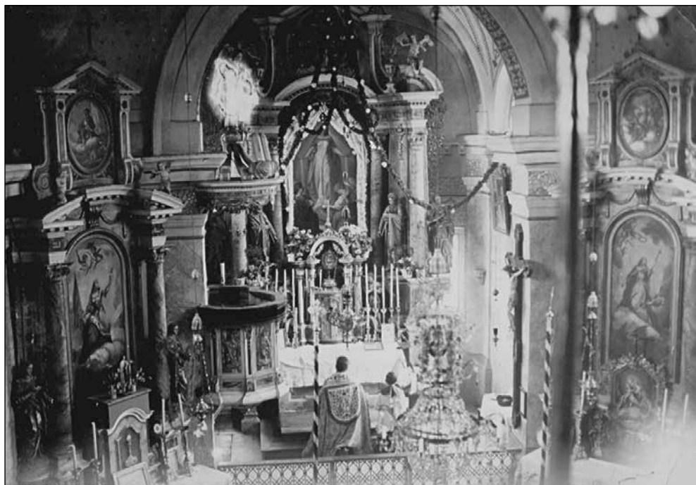
Cerkev pri Sv. Lenartu pred partizanskim uničenjem.