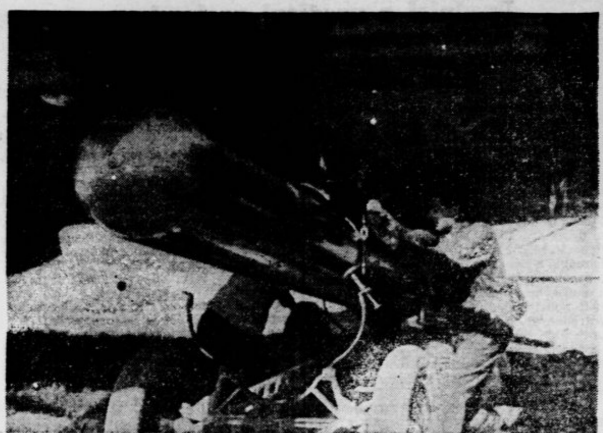
Priklopitev torpoda na italijansko torpedno letalo