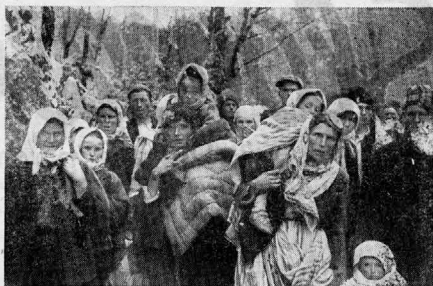
Begunci iz neke vasi, katero so partizani razrušili.