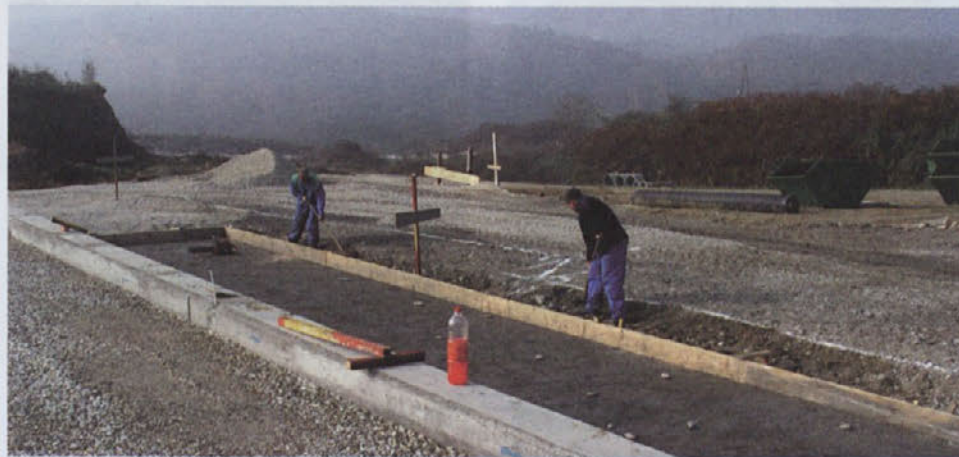
V zbirni center Ormož bodo lahko občani in občanke redno odlagali kosovne odpadke