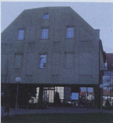
Nova podoba ormoške bolnišnice vpliva na dobro počutje bolnikov in zaposlenih