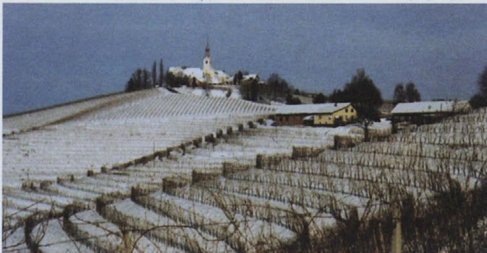
Svetinje v pričakovanju novega leta

stavljajo 38,7 odstotkov celotnih odhodkov, od tega pa je 119,6 milijonov tolarjev investicijskih transferjev.