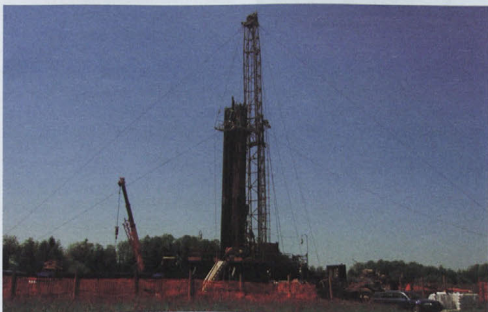
Rezultati vrtanja se ne skladajo s teoretičnimi dognanji