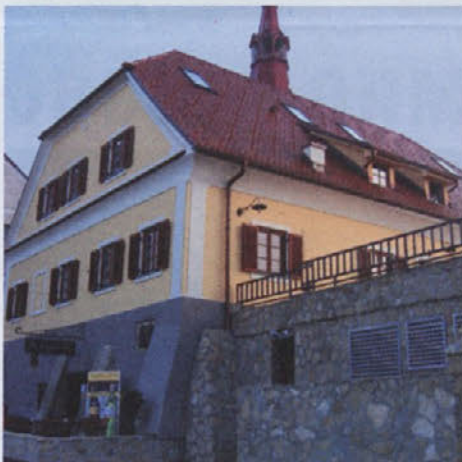
"Investicija v Svetinjah je odprla nova delovna mesta"