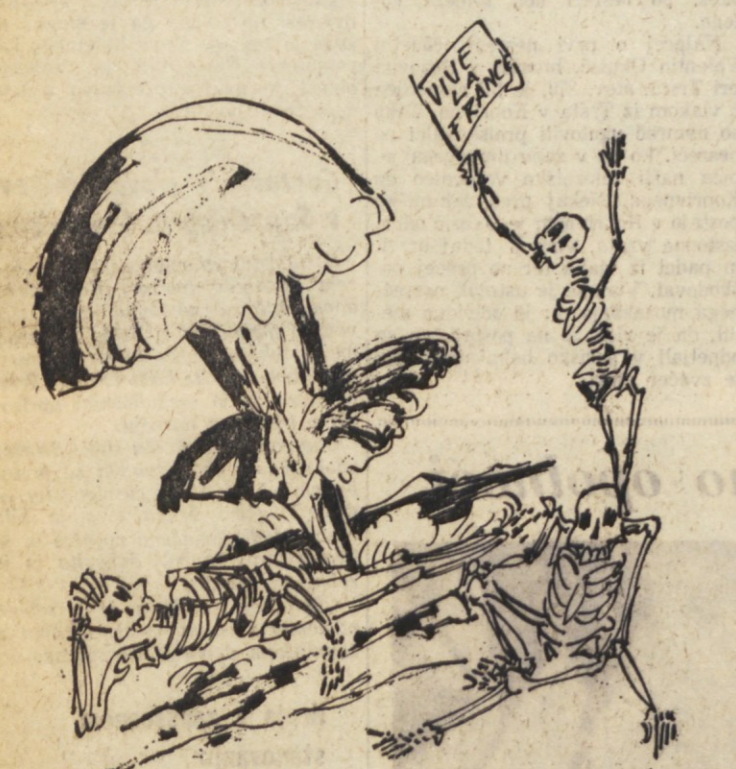
Da bi bili poletni dnevi še bolj vroči, so poskrbeli Francozi, ki so v Polineziji preizkusili atomsko bombo