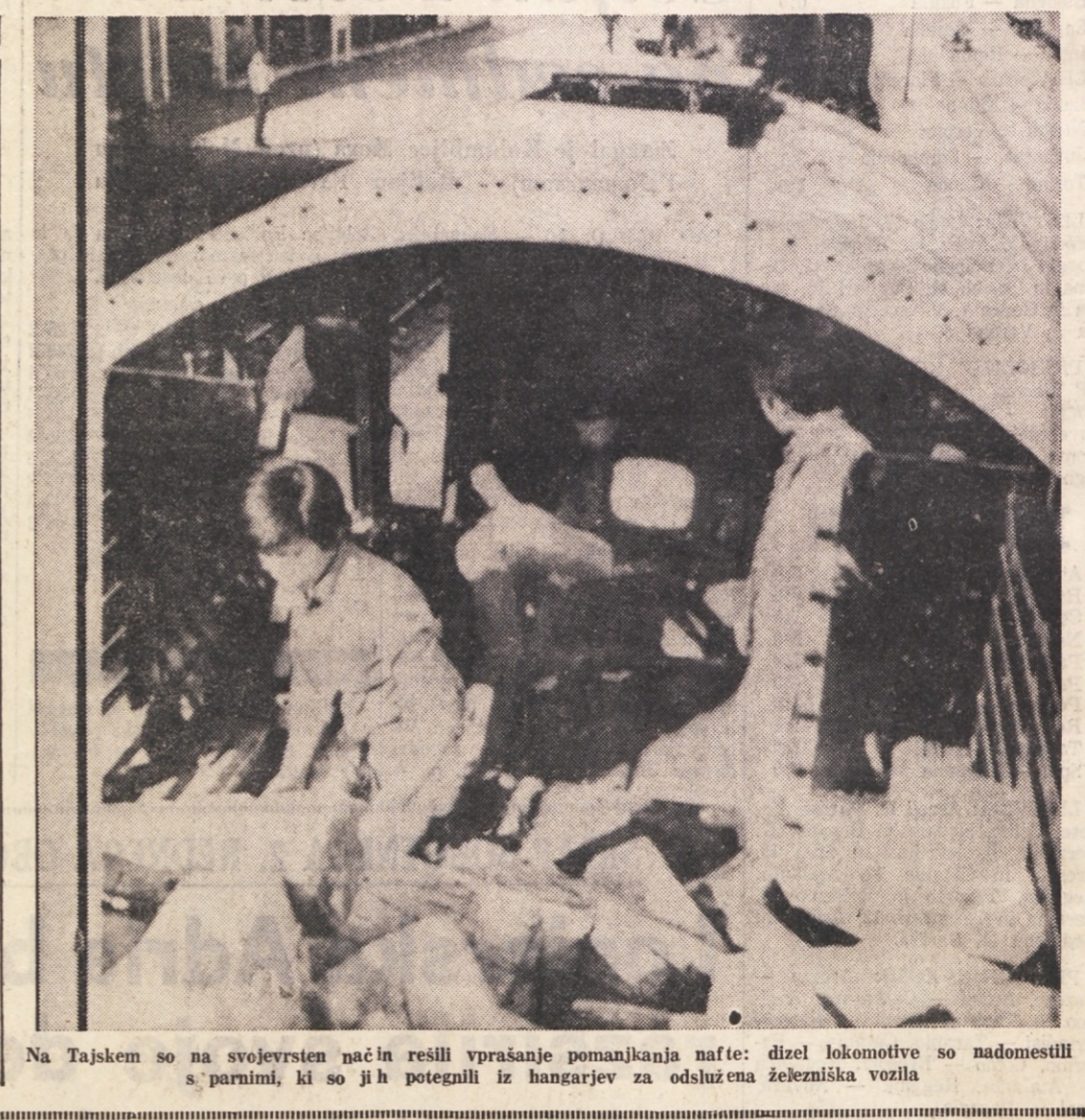
Na Tajske so na svojevrsten način rešili vprašanje pomanjkanja nafte: dizel lokomotive so nadomestili s parnimi, ki so jih potegnili iz hangarjev za odslužena železniška vozila