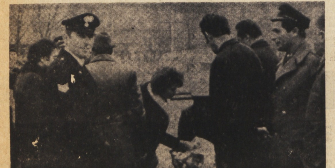
Srečanje obmejnih organov pri Škofijah

Kot vsako leto so si na Silvestrovo jugoslovanski in italijanski obmejni organi na večjih mejnih prehodih izmenjali darila in voščila za novo leto. Tudi to je izraz dobrih sosedskih odnosov in medsebojnega sodelovanja organov, ki opravljajo zelo važno, odgovorno in večkrat tudi naporno službo na najbolj odprti meji v Evropi, na mej-