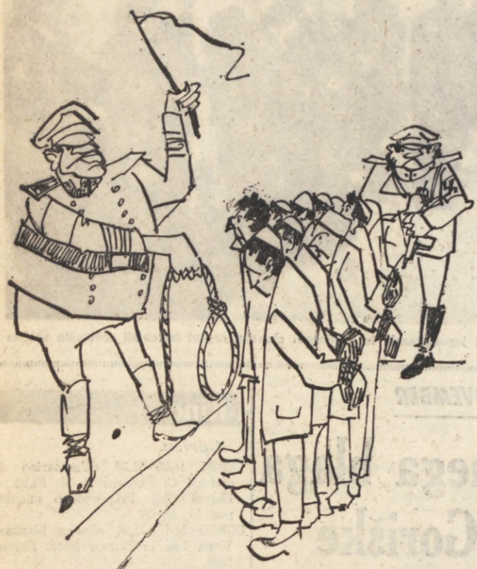
V pradamovini demokracije Grčiji, danes, žal, polkovniški, se je leto 1973 začelo z januarsko obsodbo skupine rodoljubov