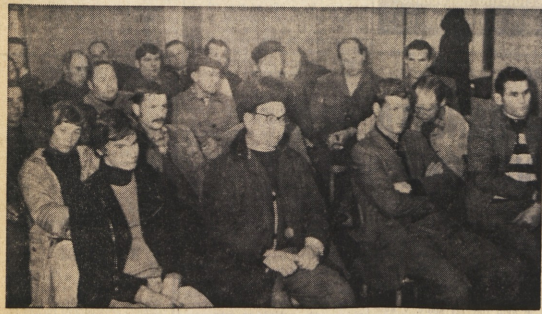
Člani lonjerske Adrie poslušajo poročila društvenih odbornikov na sobotnem občnem zboru