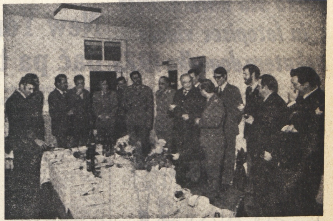
Na obmejnem prehodu pri Rdeči hiši so si jugoslovanski in italijanski obmejni organi izmenjali novoletna voščila