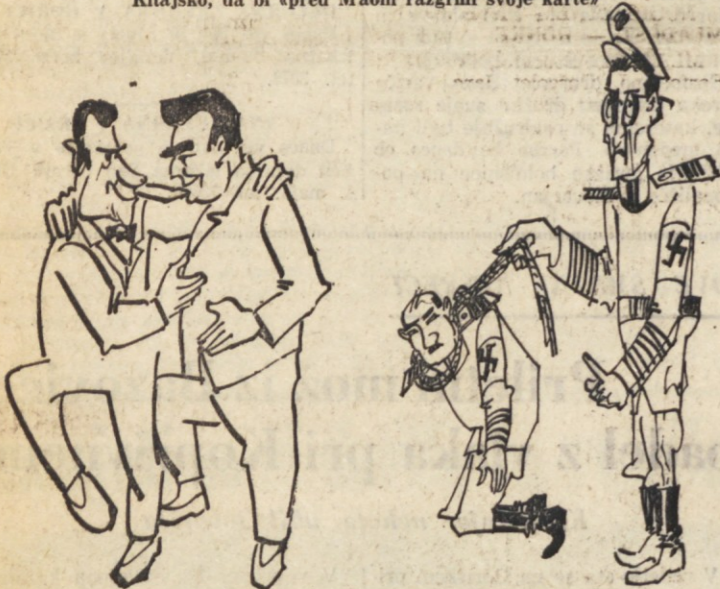
V juniju pa si je Brežnjev vzel evakance in čez Atlantik šel obiskat Amerikance, kjer je z Nixonom podpisal dogovor o omejevanju oborožitve