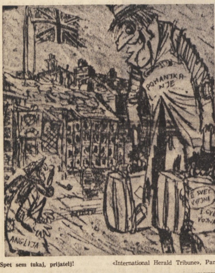
Spet sem tukaj, prijatelji! »International Herald Tribune«, Pariz