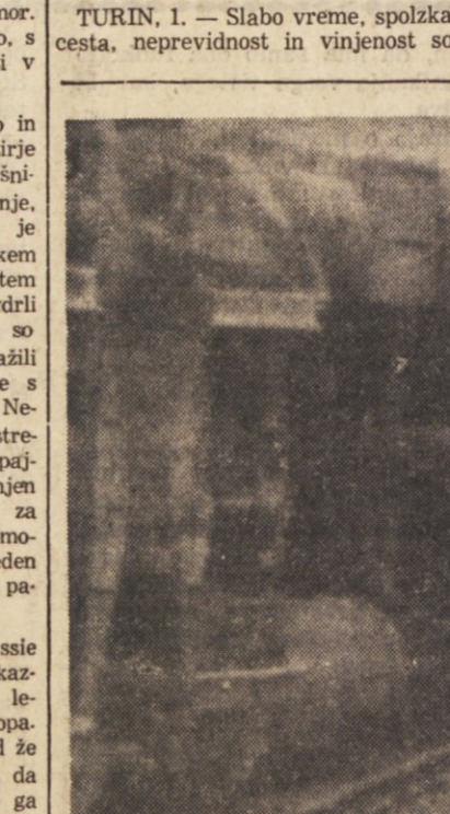
V soboto se je zgodila blizu Sara jeva huda železniška nesreča. Zaradi prevelike hitrosti je iztrila lokomotiva brzolaka Beograd - Ploče in potegnila za sabo šest vagonov. V nesreči je bilo nekaj potnikov hudo ranjenih.

TURIN, 1. — Slabo vreme, spolzka cesta, neprevidnost in vinjenost so