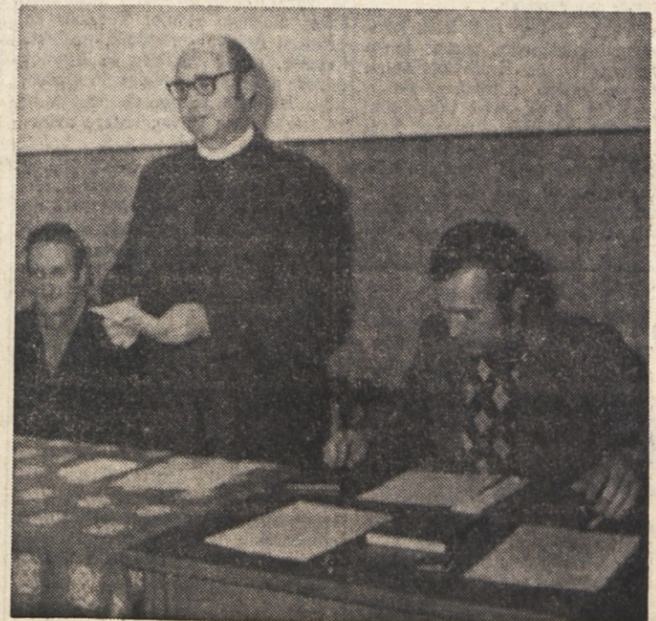
Predsedstvo občnega zbora KK Adria

Končno pa je bilo na občnem zboru se razloženo, zakaj je lanskoletni ob-