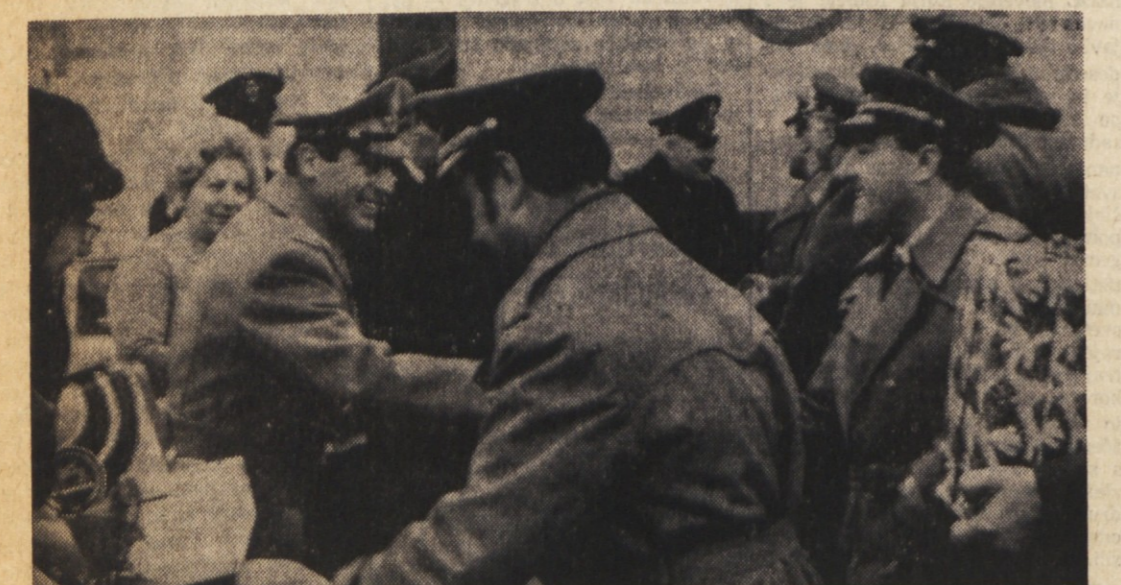
Izmenjava daril in voščil pri Fernetičih