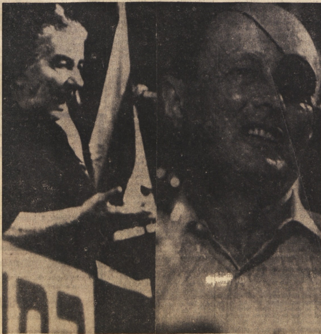
Predsednica vlade Golda Meir in vojni minister Moše Dajan: njuna laburistična stranka je na parlamentarnih volitvah v Izraelu prejela relativno večino glasov. Dejansko pa je Dajan, še več kot Meirova, znana govalec, saj je zaradi splošnega premika glasov na desno postal «jeziček na tehtnici» pri ustvarjanju nove vladne koalacije

RIM, 1. — S 1. januarjem so se zvišale cene poletov na notranjih progah letalskih družb «Alitalia», «ATI», «Itavia» in «Alisavia». Po- dražitev znaša 10 odstotkov. Vodstvo Alitalia je sporočilo, da je ukrep sprožilo ministristvo za prevoze zaradi naraščanja stroškov za vzdr- ževanje letalskih prog, predvsem zaradi podražitve goriva. Ministrstvo poudarja, da so podobne ukrepe sprožili tudi v drugih državah, kjer so se cene poletov zvišale tudi za 18 odstotkov.