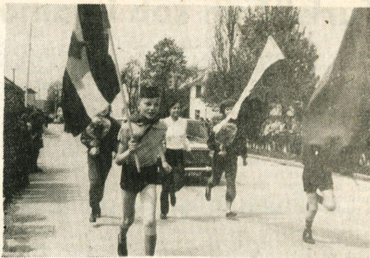
Štafeta mladosti s pozdravi tovarišu TITU za njegov 75. rojstni dan je šla tudi letos skozi Domžale in mobilizirala mladino obeh osnovnih šol, ki je letos samoiniciativno poskrbela, da so pionirji tako kot vsako leto doslej lahko sodelovali v tej manifestaciji ljubezni in spoštovanja do njihovega velikega vzornika. V bodoče bo treba to prireditve vsekakor organizirati tako, kot smo bili vajeni prejšnja leta.

S tem se je tudi v tem kraju začelo premikati iz zastarelosti k hitrejši in boljši povezavi med vasmi. Za mnoge pomeni ta cesta konec težav, ko so se morali brez potrebe voziti po 20 km daleč, sedaj pa je več kot za polovico skrajšana pot iz Crnega grabna v Tuhijsko dolino.