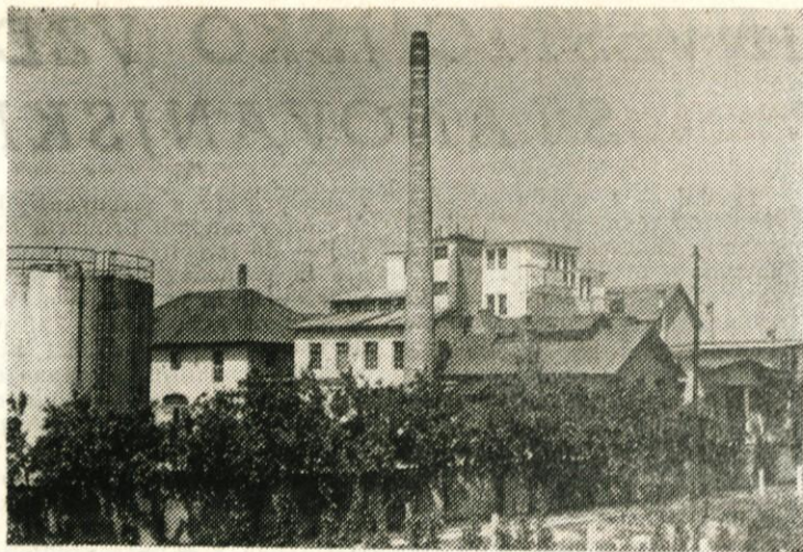
Del moderniziranega obrata »Oljarne« na Viru.

komaj verjetno, če bi bila proizvodnja tega živila na Viru rentabilna.