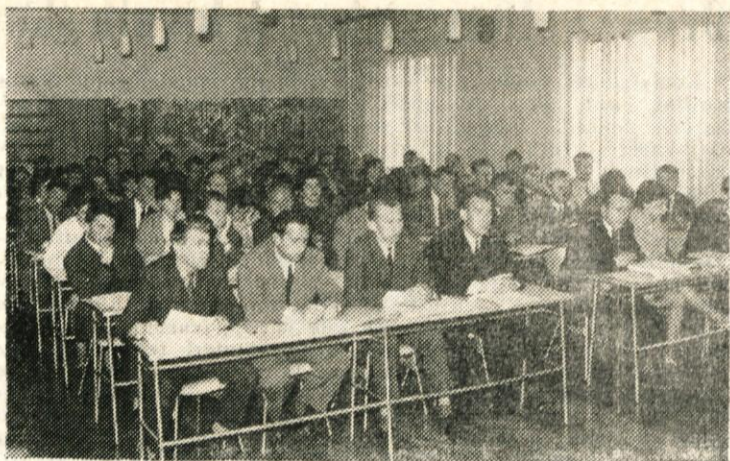
Prva skupna seja obeh zborov občinske skupščine v novem sestavu je bila 9. maja. 39 novoizvoljenih odbornikov je prvič poseglo v razpravo

Nova organizacija in nov način dela svetov zahtevata tudi nov način kadrovanja. Članstva svetov ne bo potrebno sestavljati toliko po kriteriju zastop-