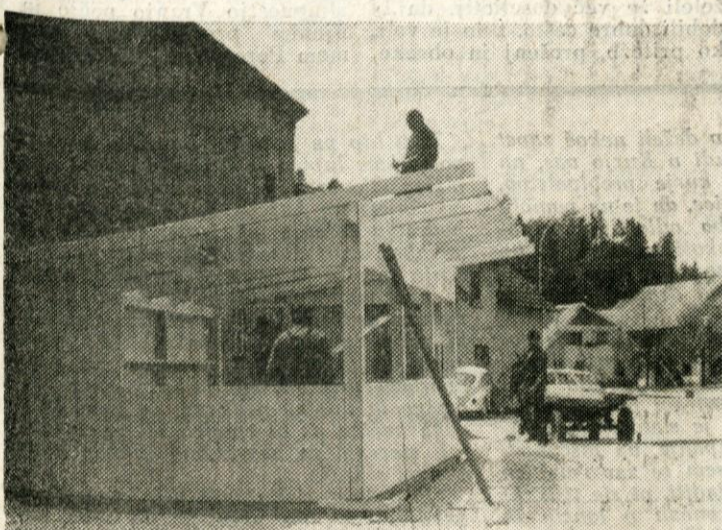
Nova avtobusna postaja, v kateri bo tudi bife, je tik pred dokončanjem. Tako rešitev perečega problema so Mengšani toplo pozdravili, pa tudi turistično bo s tem kraj samo pridobil.