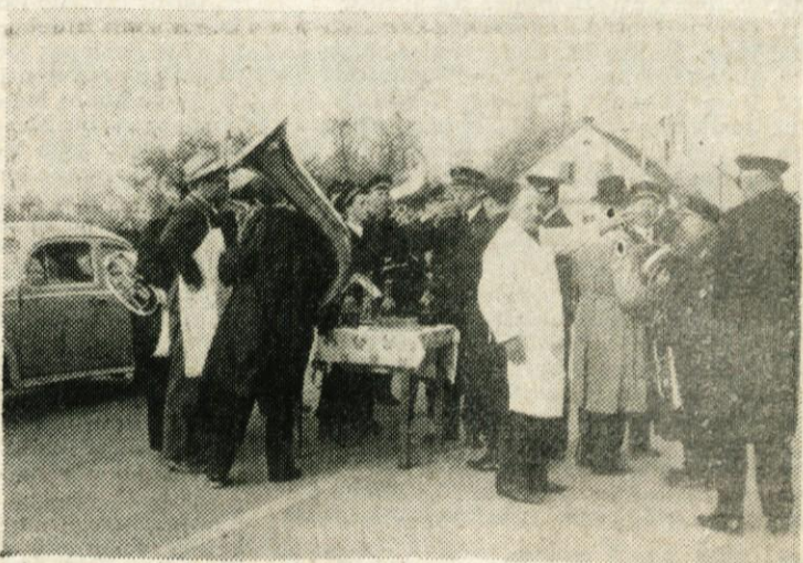
Več kot polstoletna tradicija se je za prvi maj ponovila tudi letos. Na vse zgodaj je domžalska godba zaigrala budnico, pred gostilno KEBER pa je godbenike pričakal gostilničar in jim postregel z golažem in pijačo.