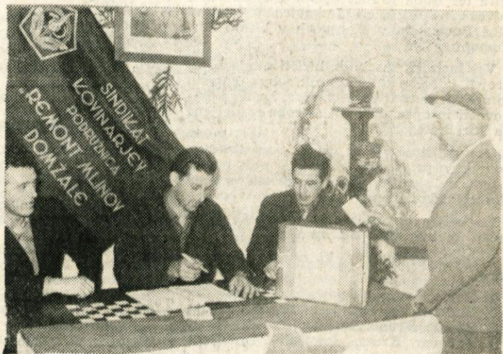
Občani so letos z vso odgovornostjo stopali na volišča in oddali svoje glasove za kandidate, katerim so najbolj zaupali. Vaznosti dogodka primerno so bila urejena tudi volišča. Posebno pohvaliti pa moramo skrbno urejeno volišče na Zlatem polju ali pa volišče v Mlinostroju, ki ga vidite tudi na sliki.