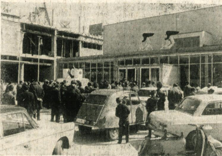
Letošnji domžalski majski sejem je že k otvoritvi privabil veliko število predstavnikov družbenih organizacij in gospodarstva, po interesu občanov, po obisku in po prometu pa je daleč presegel vse dosedanje tovrstne prireditve.