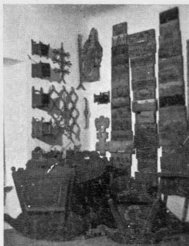
Iz etnografskega oddelka muzeja v Škofji Loki