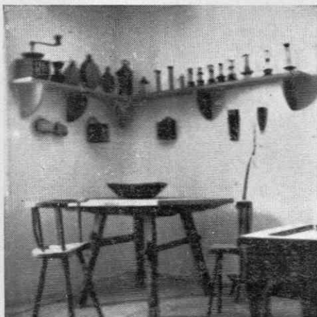
Kotiček iz etnografskega oddelka bivšega muzeja v Krškem