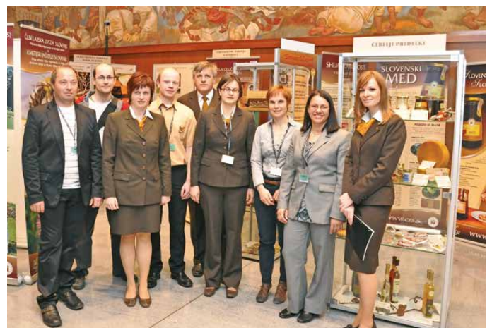
Sodelavci Čebelarstvene zveze Slovenije, Javne svetovalne službe v čebelarstvu na čebelarstveni razstavi v Državnem zboru Republike Slovenije