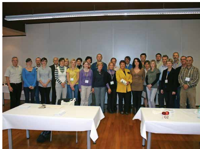
Preskuševalci medu na Mednarodnem ocenjevanju medu leta 2010 v okviru 3. mednarodnega foruma Apimedicine in 2. mednarodnega foruma Apiquality

ČZS je izvajala kampanjo »Ohranimo čebele« in ustanovila Sklad za ohranitev kranjske čebele. K ohranitvi čebel je precej pomagal preroški pogum takratnega kmetijskega ministra mag. Dejana Židana , ki je leta 2011 prepovedal uporabo neonicotinoidov, ki so povzročali zastrupitve čebel. Ta vizionarska odločitev je leta 2020 obveljala na ravni celotne EU. Leta 2010 smo dočakali tudi poklicni standard in izpitni katalog za pridobitev poklica čebelarški mojster/mojstrica. Do leta 2012 so bili na tej podlagi spet izobraženi in potrjeni novi čebelarški mojstri. Po drugi strani pa smo za najmlajše leta 2011 posodobili učbenik Čebela se predstavi . Posodobitev je kasneje doživel tudi Slovenski čebelar s spremembo formata v A4 in