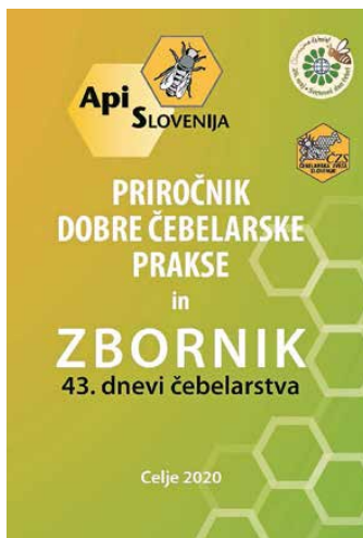
Priročnik dobre čebelarstvene prakse 2020

V prvih letih predsedovanja Boštjana Noča in vse do danes je sledilo mnogo premikov in dosežkov: uvedba enotnega kozarca za med slovenskega porekla, uvedba enotnega programa zatiranja varoj, sofinanciranje čebelarstvene opreme, izvajanje interne kontrole medu, promocija sajenja medovitih rastlin, izdajanje strokovne literature, kot so 1. in 2. del učbenika Slovensko čebelarstvo v tretje tisočletje, knjižici o medu in cvetnem prahu, knjiga Slovenski čebelnjak , Čebelarstveni terminološki slovar , knjižici o propolisu ter o pridelavi in predelavi voska, knjiga Varoja, čebela, čebelar , in ureditev Čebelarstvene knjižnice Janeza Goličnika. Njeno odprtje je sovpadlo s praznovanjem 110-letnice nepretrganega izhajanja revije Slovenski čebelar . Uredila se je davčna zakonodaja, vzpostavljeni so bili Register čebelnjakov, pašni redi in pašni kataster. Eden pomembnejših mednarodnih dosežkov Slovenije pomeni pridobitev na ravni EU zaščitene geografske označbe za slovenski med, kar je velika zasluga pobudnika in skozi vse korake gonilne sile Milana Megliča . Sočasno z, k napredku naravnanim, delovanjem ČZS, so k