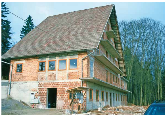
Brdo pri Lukovici leta 2000. Začela se je vnovična graditev Čebelarskega centra Slovenije.