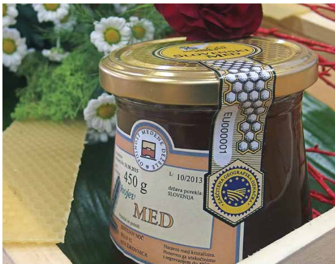
Slovenski med z zaščiteno geografsko označbo 2013

razvoju čebelarstva prispevala tudi čebelarstva društva in regijske zveze, pri čemer nekatere še prav posebej izstopajo.