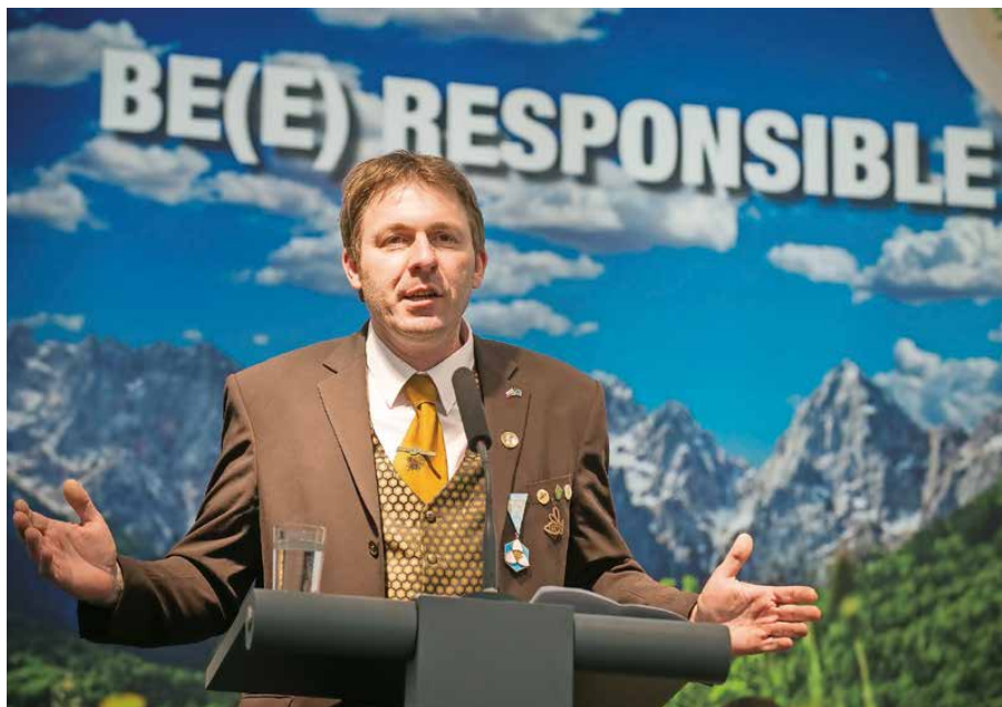
S pravim ciljem in vztrajno voljo se najde pot do na začetku na videz nedosegljivega cilja – svetovnega dneva čebel.