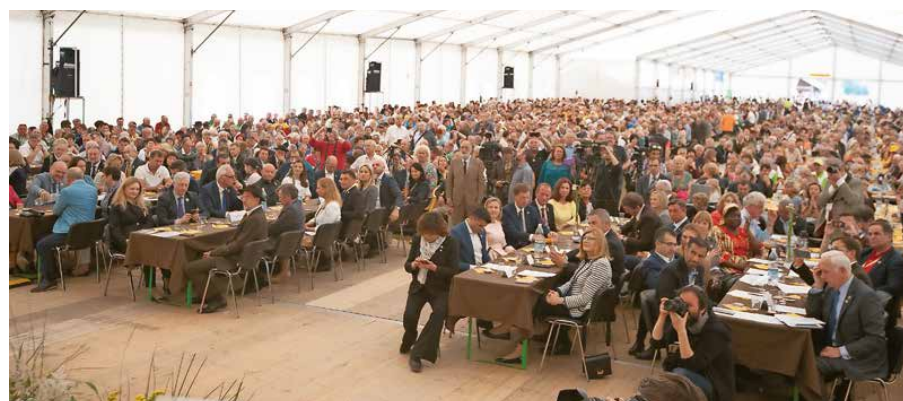
Praznovanje prvega svetovnega dne čebel, 20. maja 2018, v Breznici pri Žirovnici

za začetnike, Čebelje paše v Sloveniji, Veliki ljudje slovenskega čebelarstva, Monografija o organiziranem slovenskem čebelarstvu, Priročnik dobre čebelarke prakse.