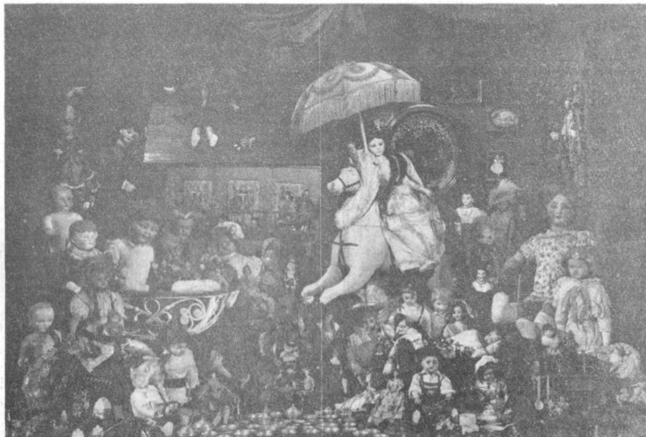
Dedek Mraz, prosim, prinesi mi... Tako pogostokrat napisane želje naših otrok pred novim letom. — Tudi mi se sprašujemo, kaj vse nam bo prineslo novo, 1971. leto. Ali srečo, bogastvo, zadovoljstvo — morda...?

Vsem prebivalcem občine Velenje želim obilo uspehov v delu in življenju ter srečne in zadovoljne praznike!