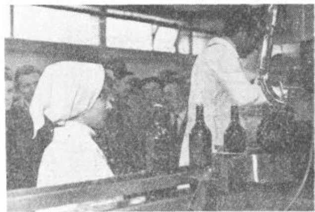
2000 steklenic napolnjenih v eni uri

Takrat je v podjetju bilo zaposlenih samo pet ljudi. Ti pa se niso zadovoljili s takratnim obsegom poslovanja in so podjetje razvijali naprej. Za razmah pa je prispevala tudi ugodna lega kraja, saj je Smartno ob Paki na razpotju treh dolin.