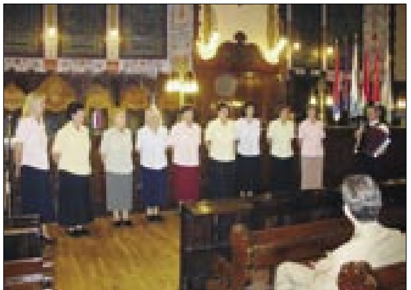
Spominčice med spejvanjom

zbejžalo, pa so mesto nji pripelali ludi, zvečkšoga Slovake iz sōverne Vogrskeske (Felvidék). V prejdnoj iži leko vidimo postelo, štero so nūcali samo na svetke, pa dosta svetešnji ženski kikeu, štere so zvečkšoga črne pa radeče farbe. V steno je nuzozidani omar (kasli), v šterom so meli