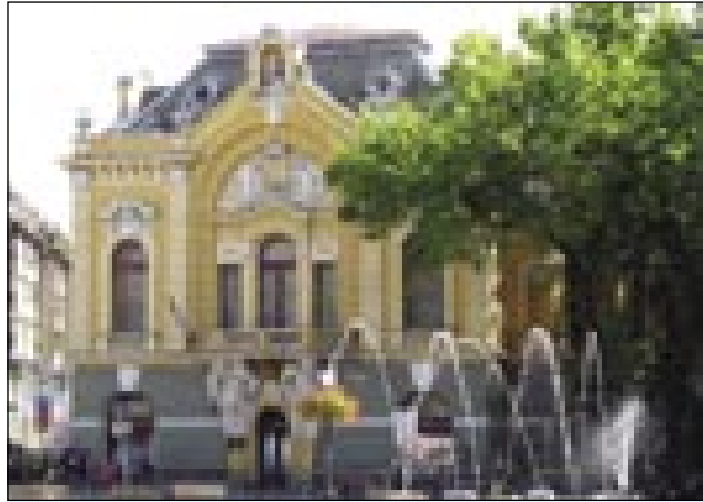
Zidina knjižnice in vodomet

Naš varaš, Somboteu je daubo ime po tom, ka so meli tū senje vsigdar po sobotaj.