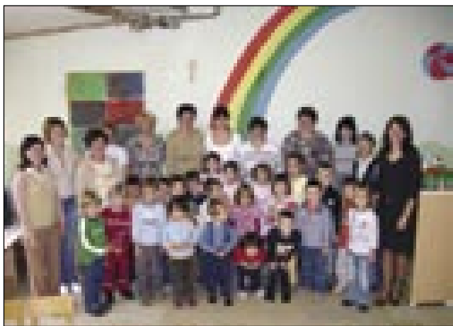
Programa v Gradu so se udeležili tudi malčki s svojimi mamicami iz gornjeseniškega vrtca

razne vrste pisem in smo po vsebini in zgradbi morali določiti, kakšno je katero pismo. Za konec smo pa učenci DOŠ Gornji Senik napisali pismo našemu ministru za šolstvo in kulturo, dr. Hiller Istvánu