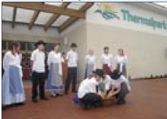
Na otvoritvi je (čeprav v dežju) nastopila otroška folklorna skupina ZS iz Števanovcev