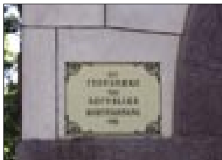
Vsi napisi v trej gezikaj

Nazaj smo si malo drügo paut vöodebrali kak tamta. Stanili smo v Szegedi, gde smo si pog-