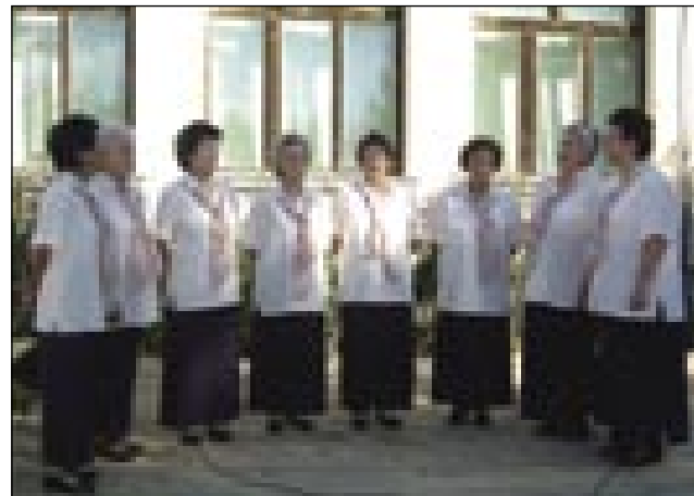
V kulturnom programi so gorstapile ljudske pevke iz Števanovec

Prvi so gratali Čepinčarge, drugi Avstrijci, tretji domanji,