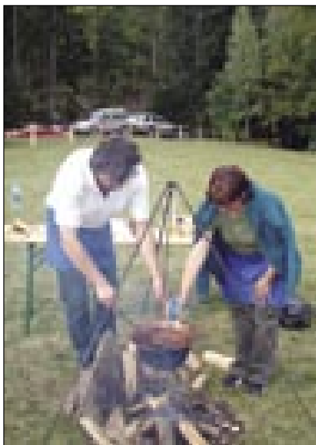
Küja se divjačinski golaž »po porabsko«

vküppoberem, dapa nika sam nej čednejši grato. Na konci sam papir vküpzmauždjo, pa sam ga talučo. Tak sam se odlaučo, ka taše slike mo neso na razstavo, s šterimi notrapokažem Porabje, kak ga dja s svojimi očami, prejk svojega