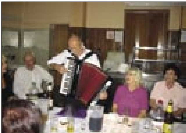
Slovenci z Vogrskoga pa Srbije vküper

iz Ljubljane v Beograd, pa de vsikši keden gnauk ojdla v Subotico. Vüpažo, ka de tau dosta pomagalo pri včenjej. V pevskom zbori majo petnajset členov, vsi so amaterji, šteri so prva eške nin nej spejvali. V varaši smo si oprvin poglednili varaško ižo. Ta stogi v centri, pa so go zozidali eške v starom Vogrskom med 1908-10. Njen stil je madžarska secesija, tau se že od zvüna vidi.