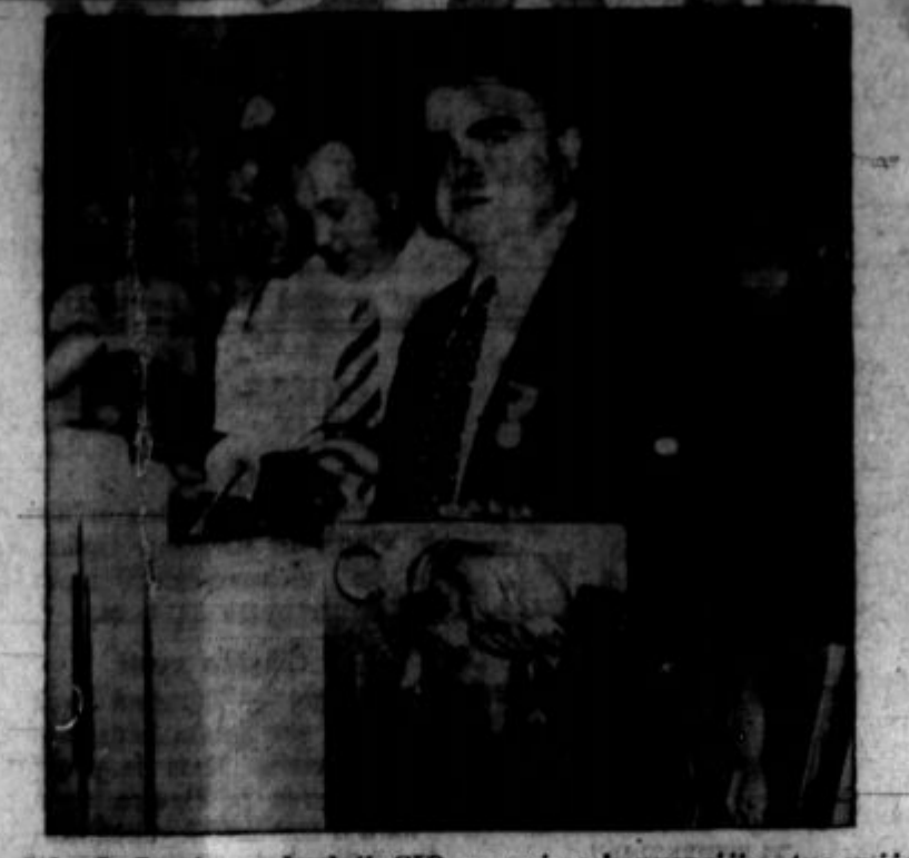
John I. Lewis, predsednik CIO, govori na konvenciji avtne unije v St. Louisu, Mo.