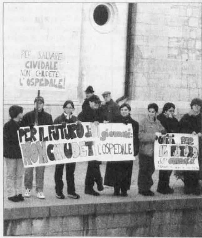
Una manifestazione per l'ospedale nel 1998

"Non sono state ancora prese, invece - fanno sapere i membri del comitato - decisioni per il piano di emergenza, perché esistono varie proposte da cui dovrebbe scaturire quella definitiva. Siamo particolarmente attenti a questo problema da cui dipende il futuro dell'ospedale, per quanto ottimisti dal momento che le assicurazioni in merito sono state fornite dai massimi dirigenti dell'azienda ospedaliera udinese e dal presidente