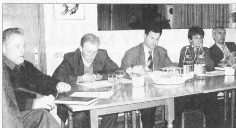
Alcuni degli intervenuti all'incontro organizzato dall'Ulivo delle Valli del Natisone