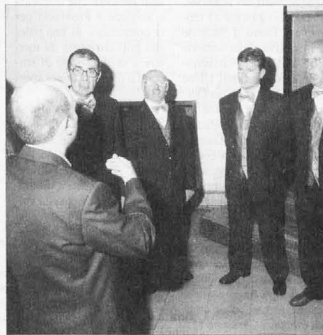
Zbor Matajur iz Klenja

V teh letih se je ustvarila gosta mreža stikov, ki je prispevala tudi k izmenjavi koncertov in torej se tesnejšega povezovanja.