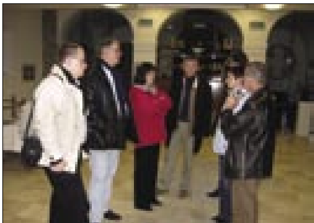
V monoštrski gledališki dvorani, ki bo glavno prizorišče kongresa