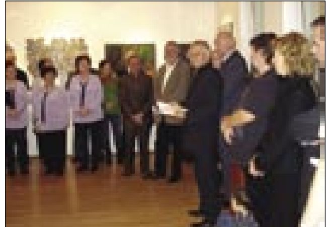
Umetniki in organizatori na otvoritvi razstave, na steroj je spejvo mešani pevski zbor Svoboda iz Maribora-Pobrezje