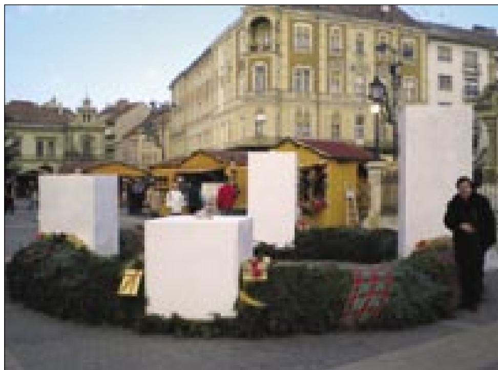
Velki adventni vejnec na glavnom trgi v Somboteli. Najvekša svejča na njem je 2,5 metra visika pa 2 tone težka

Kak vsakši svetek tak Kristušovo rojstvo tō nüca priprave. Te cajt, šteri se začne štiri kednov pred božičom, se imenuje advent. Rejč »advent« shaja iz latinske rejči adventus , štera znamenuje prihod . Advent se vsakše leto začne prvo nedelo po 27. novembri, pa se konča četrto adventno nedelo, na sveti večer. V etom časi se pripravlamo na božični svetek, spominamo se Jezušovoga rojstva v Betlehemi. Sveto