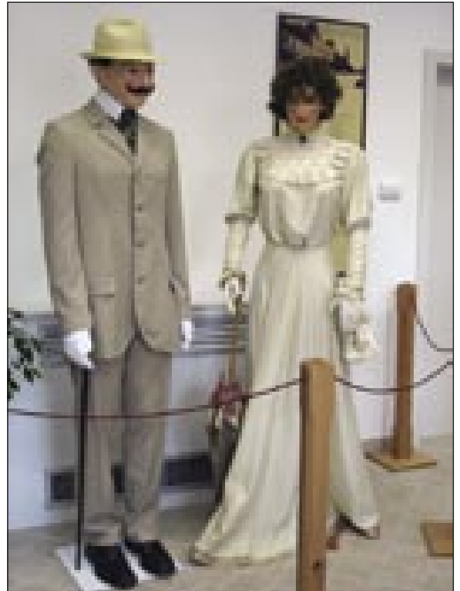
Zakonski par v meščanskem gvanti

njegvoga sina pa so bujli nacisti prauti konci bojne. Tiskarno je pelala dale njegva evangeličanska žena do leta 1947, gda so komunistarge vkrajvzeli tiskarno pa baute. Moderne