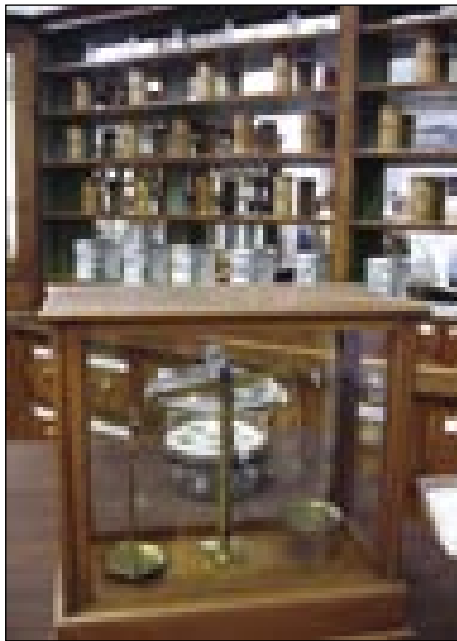
Omari iz prve patejke v Prekmurji

V Lendavi so v fabriki redili držence skoro stau lejt. Gda je fabrika leta 2001 na nikoj prišla, so začnili ništerni brodit, ka bi odprli muzej o tej meštiji. Zatau, ka so nej zavole paperov pa drugoga gradiva meli o prvi petdeseti lejtaj fabrike, so se avgustuša 2007 odlaučili, ka v ednoj zidini na Glavnoj ulici oprejo muzej, šteri zvün drženc nutpokaže eške fiškališki kancelaj, patejko pa veštauk za štampanje tō. Tau so vsi bili tali meščanskoga, varašanskoga žitka v Lendavi. Gnes je muzej v ednoj novobaročnoj izi, za štero vnaugi pravijo, ka je najlepša