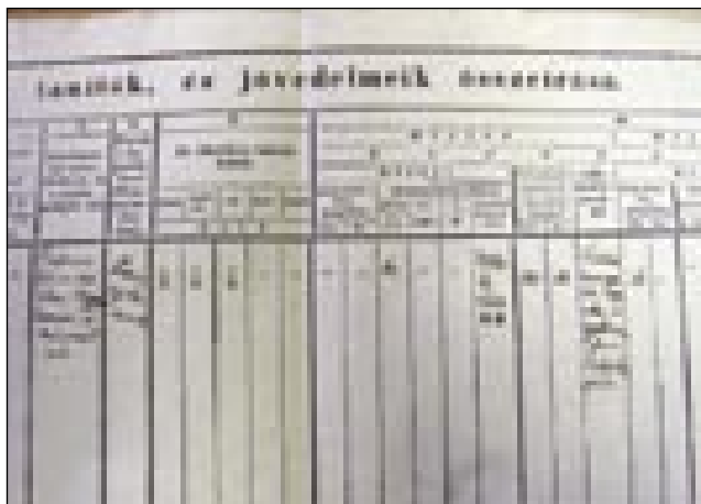
Vprašalnik za Gorenji Senik

bla kukarce in 20 fontov lena. Emo je 1/8 plüga orne zemlé, gracia in gorice, s toga je 3 fointe 30 krajcarov aska emo.