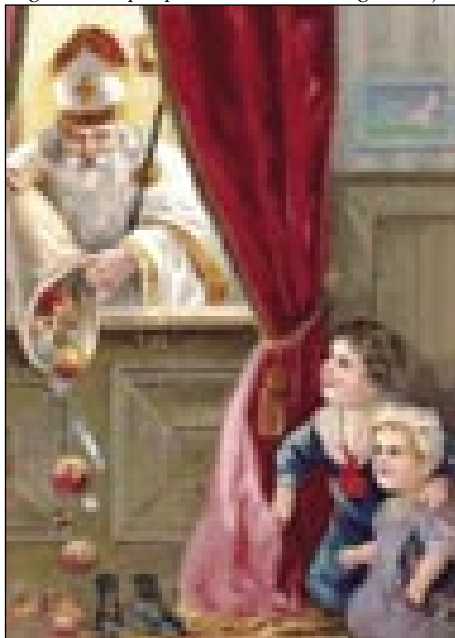
Miklavž tala dare

Miklavž je prvi, ka začne z obdarüvanjom v svetašnjom mejseci decembri, pa v adventi. Fejst je prilübleni v cejлом krščanskom svejti. Svoj den (god) ma 6. decembra, Miklavžov obhod pa obdarovanja pa se dogajajo na predvečer goda, tou je 5. decembra. Kak sam že pravla, Miklavž je tisti 'bejli', ka ma škofovsko aubo pa bot, bejlo keco, bejle rokavice, dugi svetli kaput pa velki koš da-