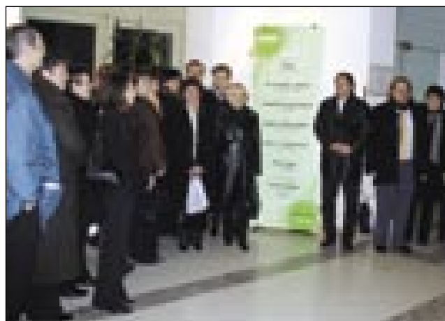
Skupina Porabcev v mariborskem gledališču

Cankar se v temeljnem delu slovenske dramatike Za narodov blagor ukvarja z družbenokritično problematiko. Politične razprtije med levimi in desnimi, razdori v strankah in tekmovalnost za naklonjenost bogatih mecenov niso bili aktualni samo v Cankarjevem času. Politične mahinacije, ljubezenske afere,