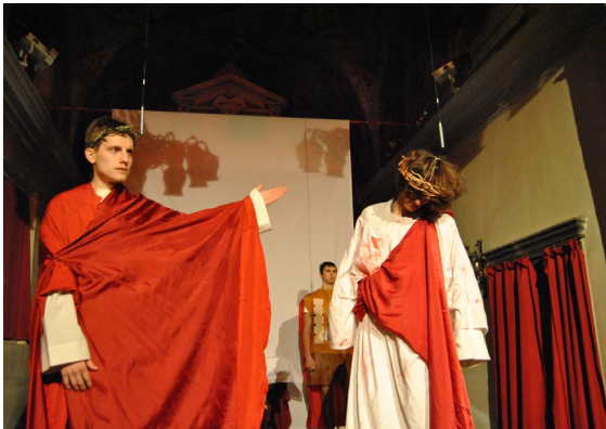
Štepanjski pasijon 2016.